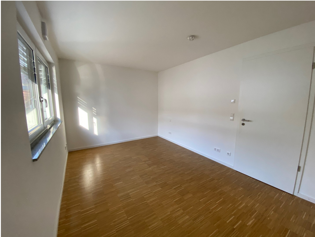
Zi. 2 Richtung Westen