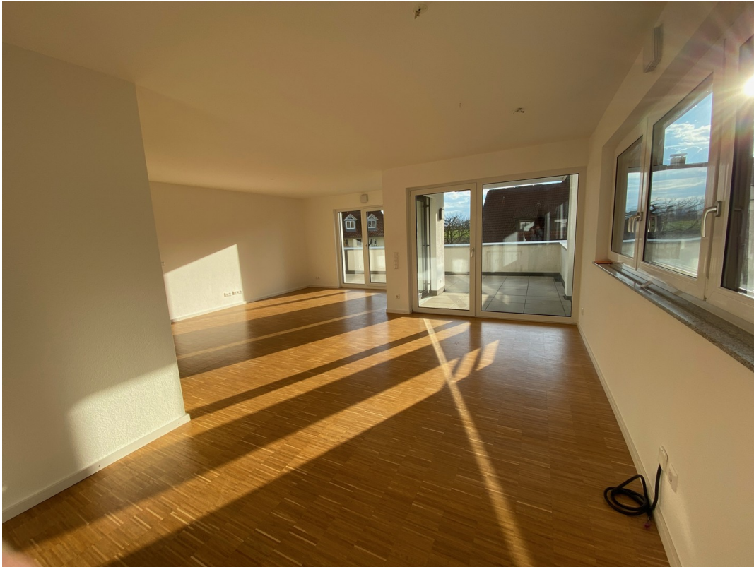
Heller Wohn- und Essbereich