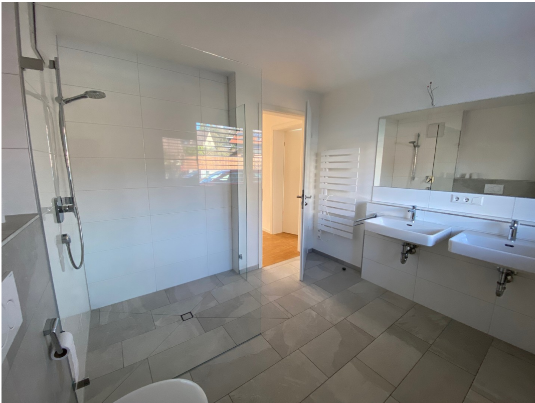
Bad mit Dusche 120x150cm