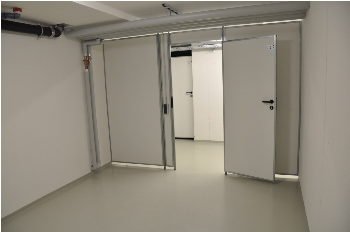
13,5 m 2 Keller