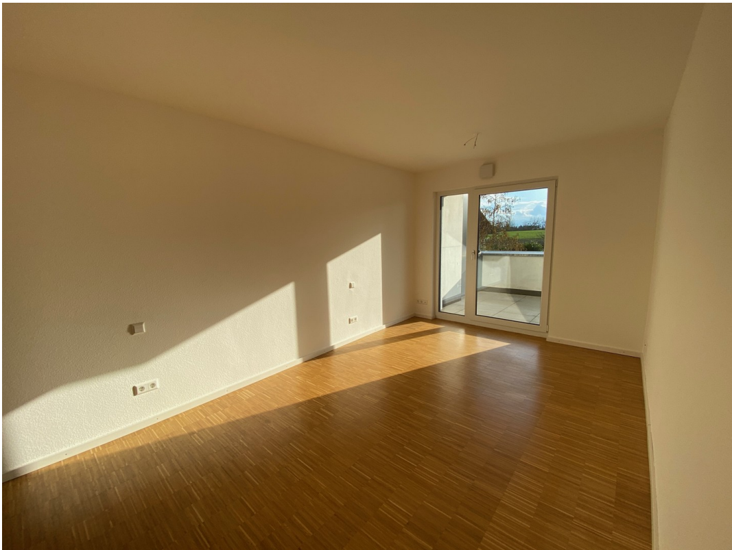
Zi. 1 Richtung Süden