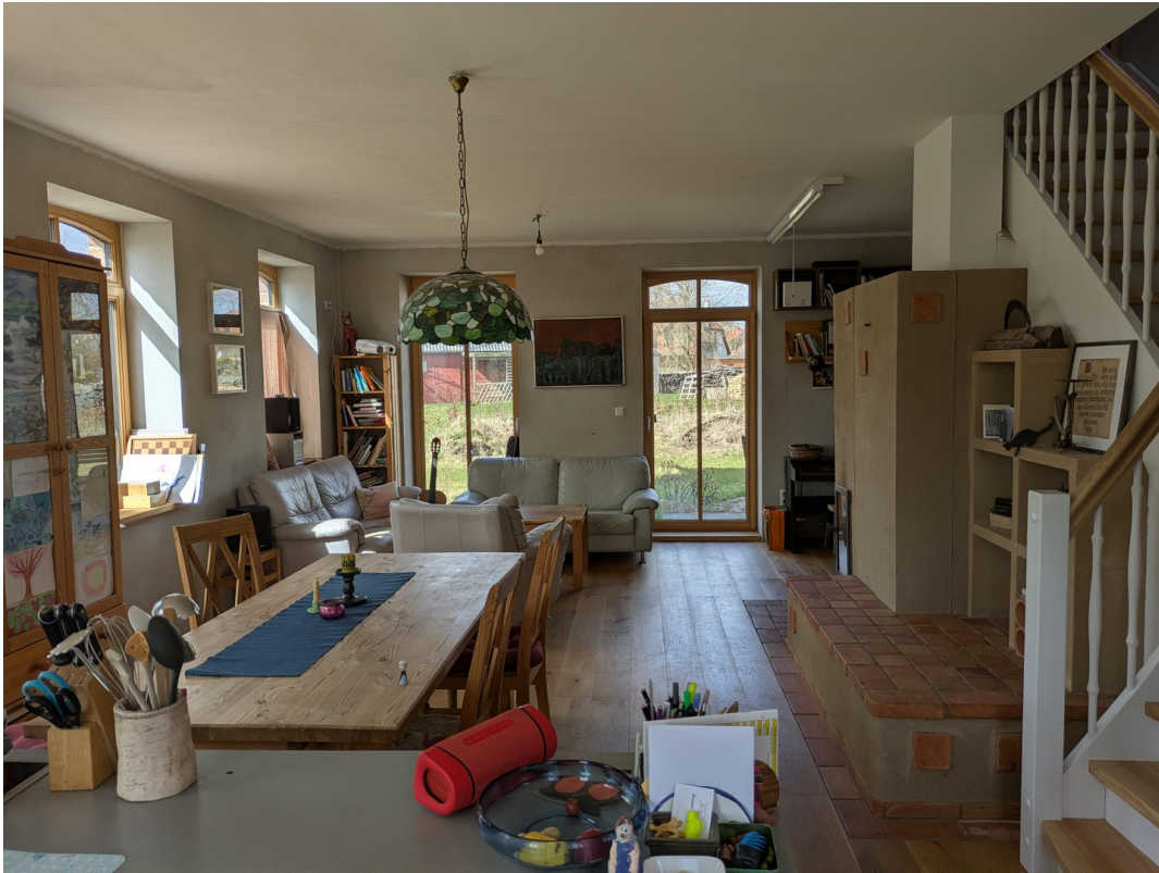
Blick von Küche ins Wohnzimmer