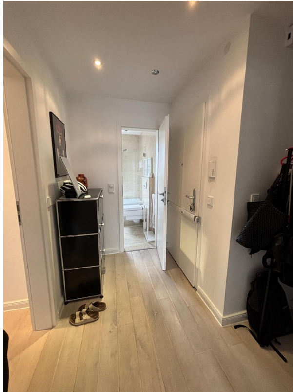
Wohnungseingang , Flur