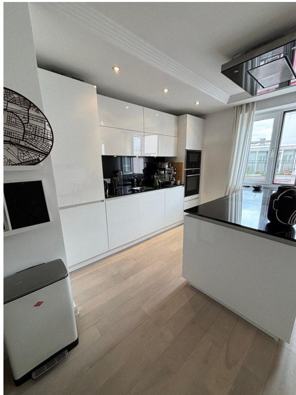
Einbauküche mit Kochinsel