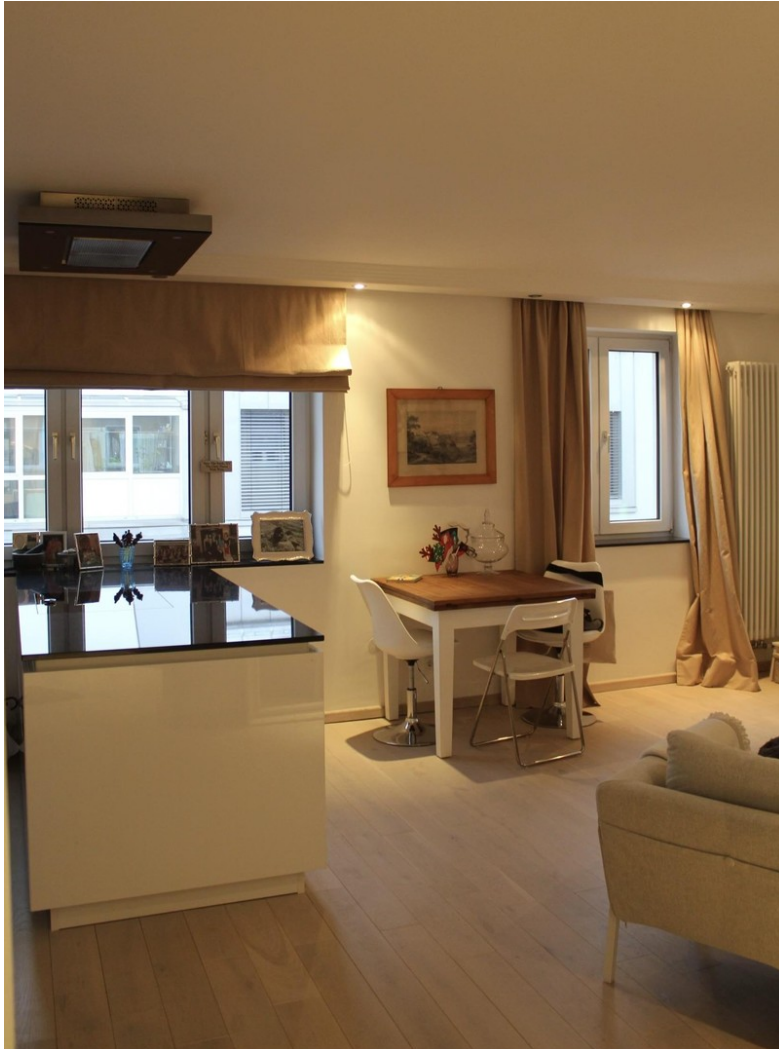
Wohnzimmer mit offener Einbauk