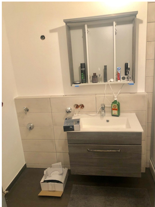
Waschbecken / Bad