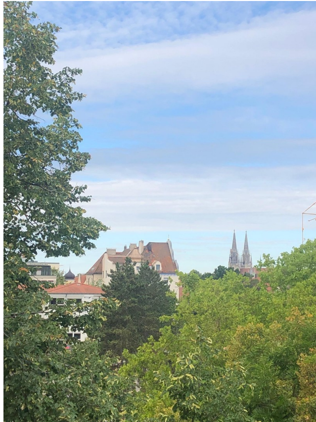
Blick in die Innenstadt