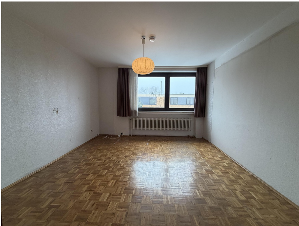
Zimmer 1 im OG