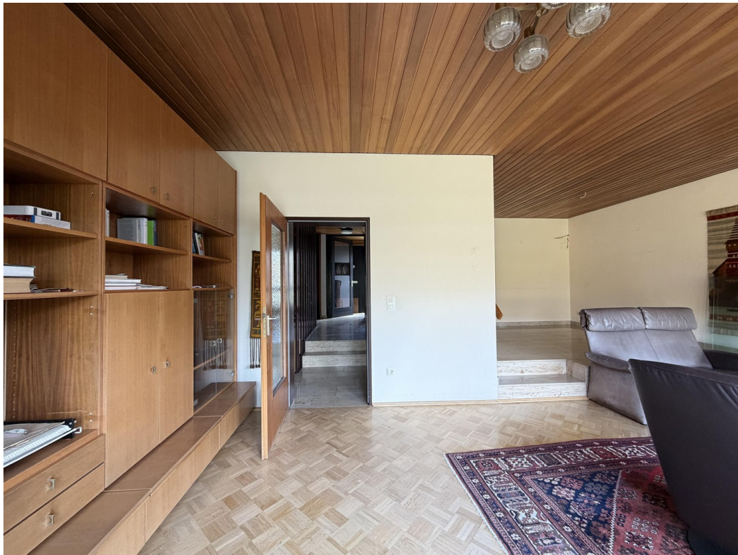
Blick in den Flur EG