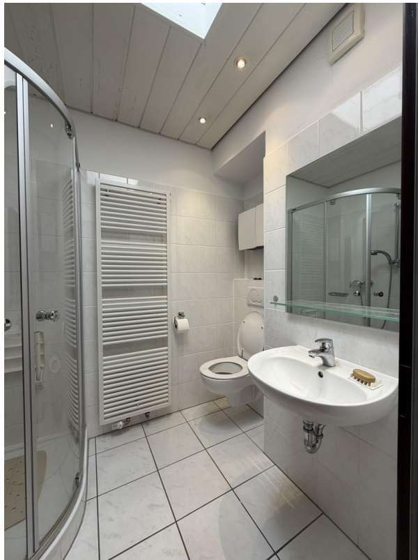
Duschbad im OG