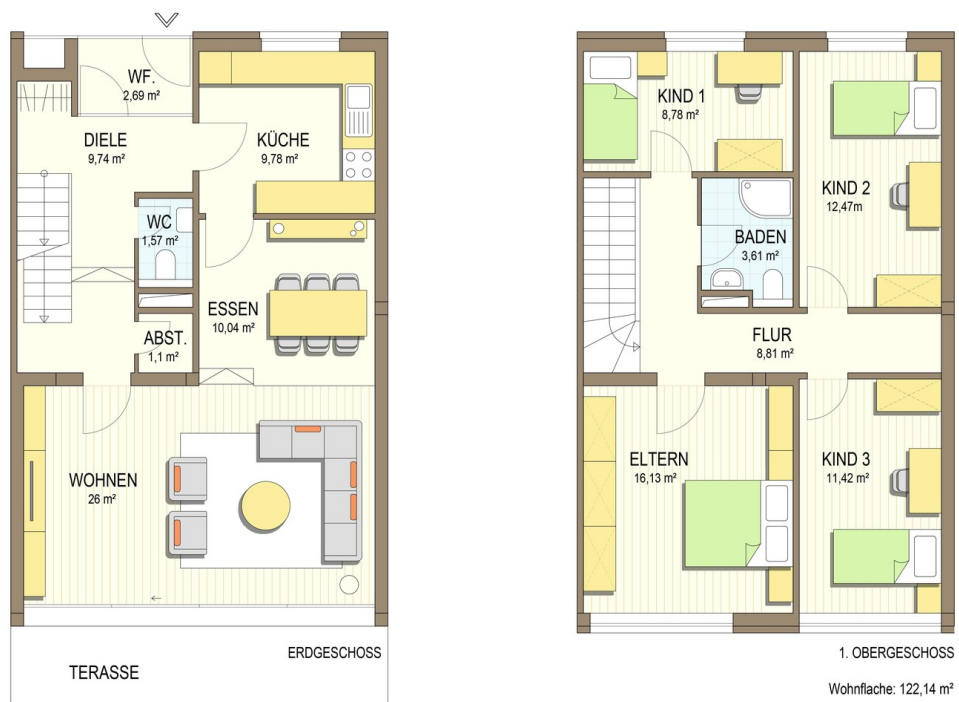
Grundriss EG und OG