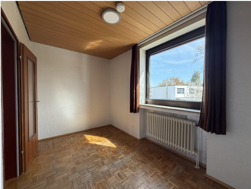
Zimmer 3 im OG