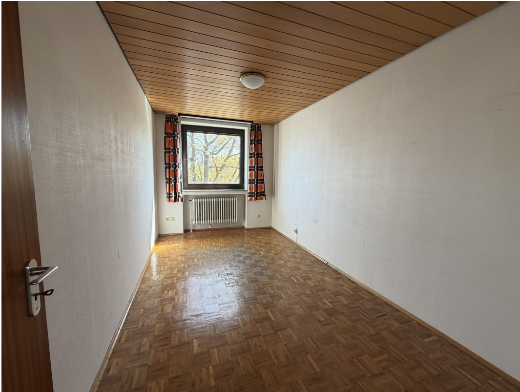
Zimmer 2 Im OG