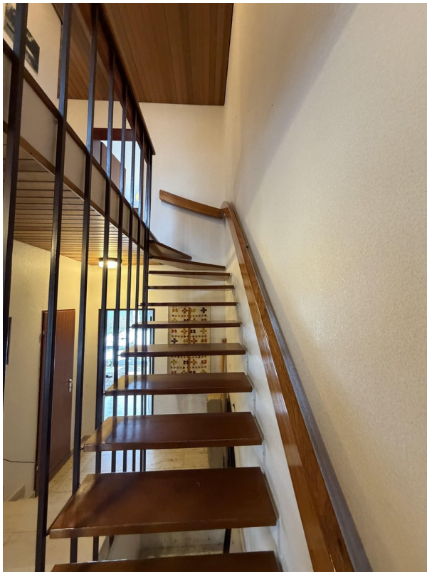
Treppe ins OG