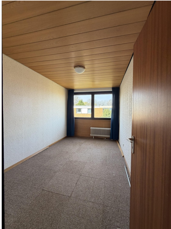
Zimmer 4 im OG