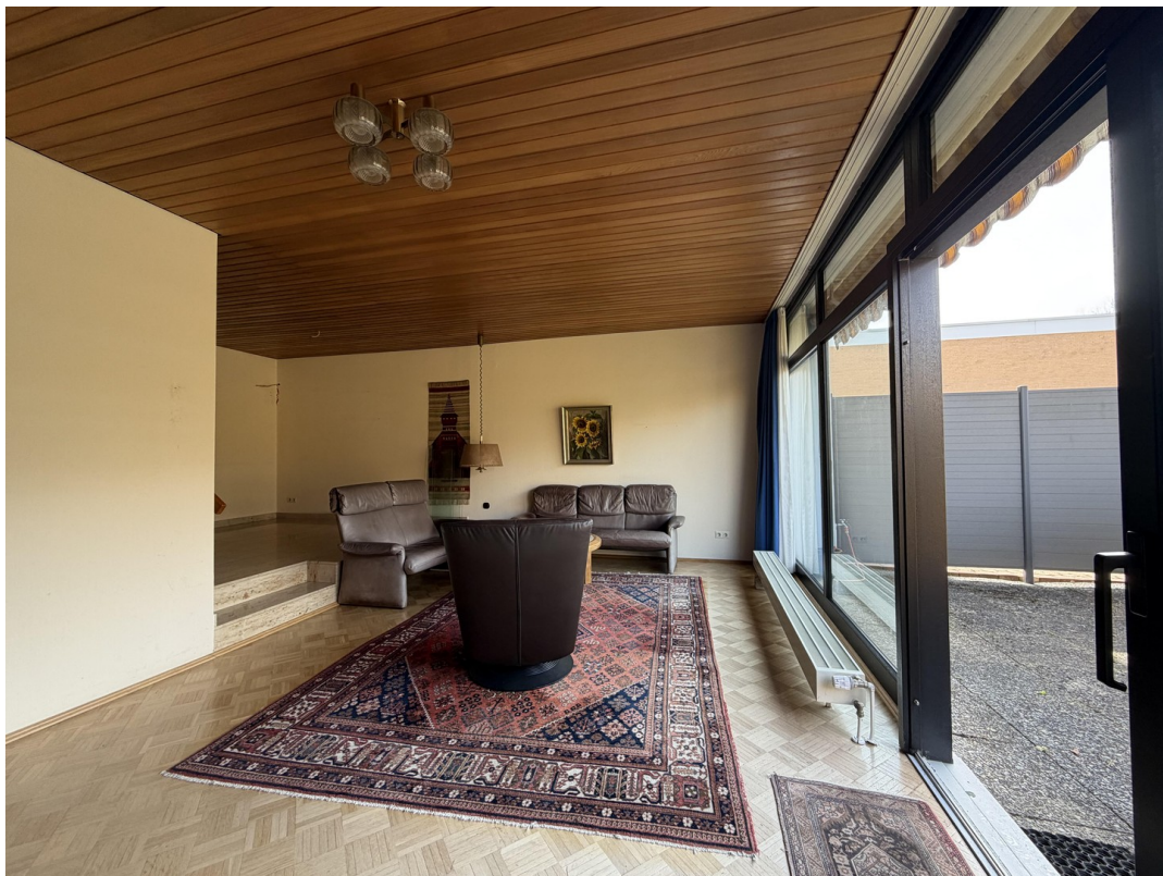
Wohnzimmer mit Esszimmer