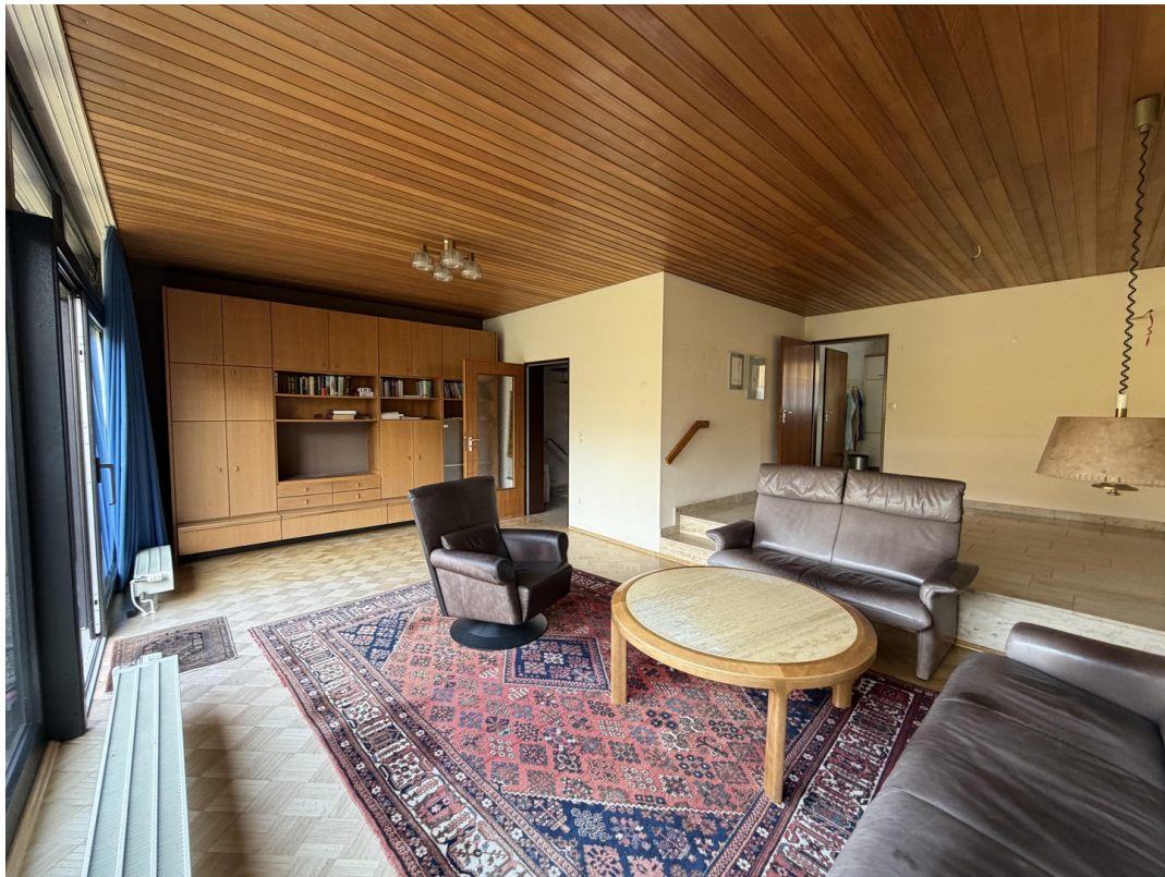
Wohnzimmer mit Esszimmer