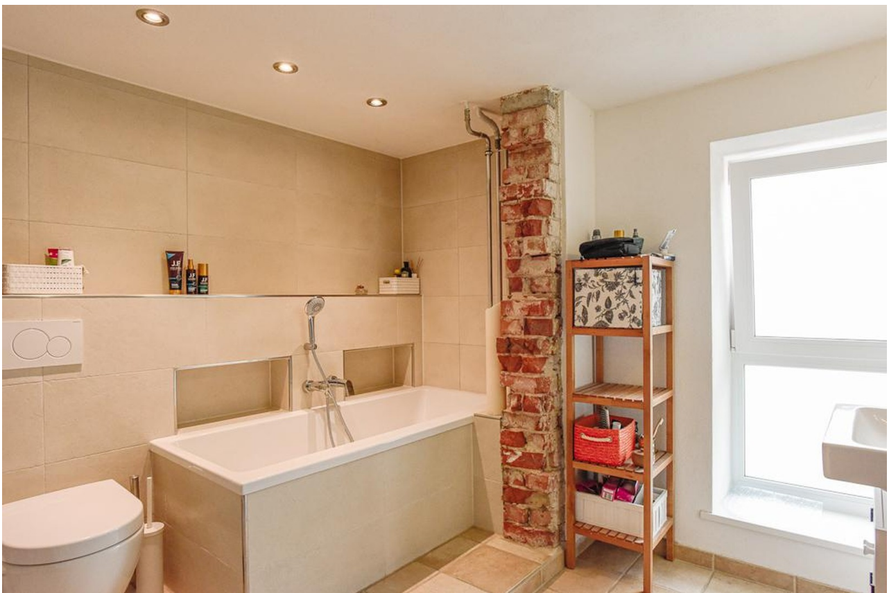
Badezimmer (Wanne + Dusche)