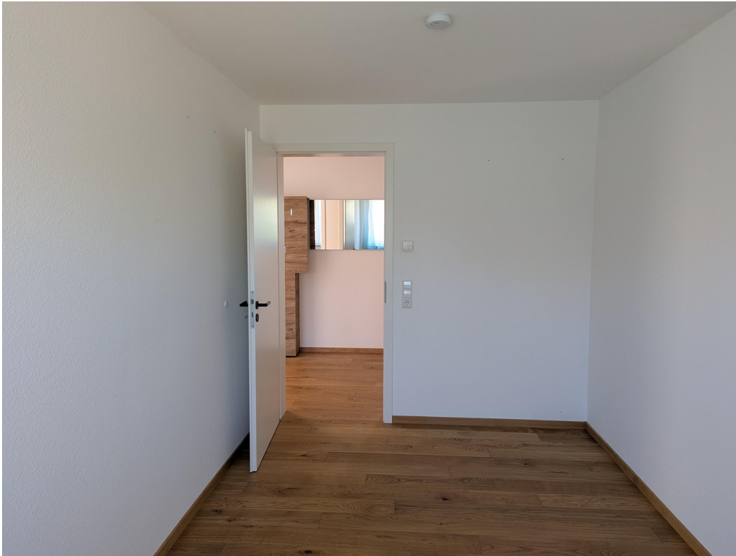
Kind 2 / Büro