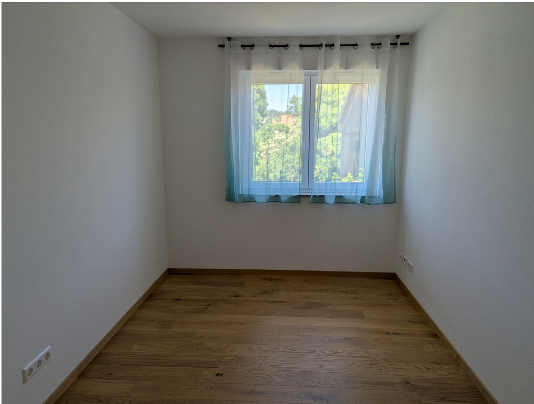
Kind 2 / Büro