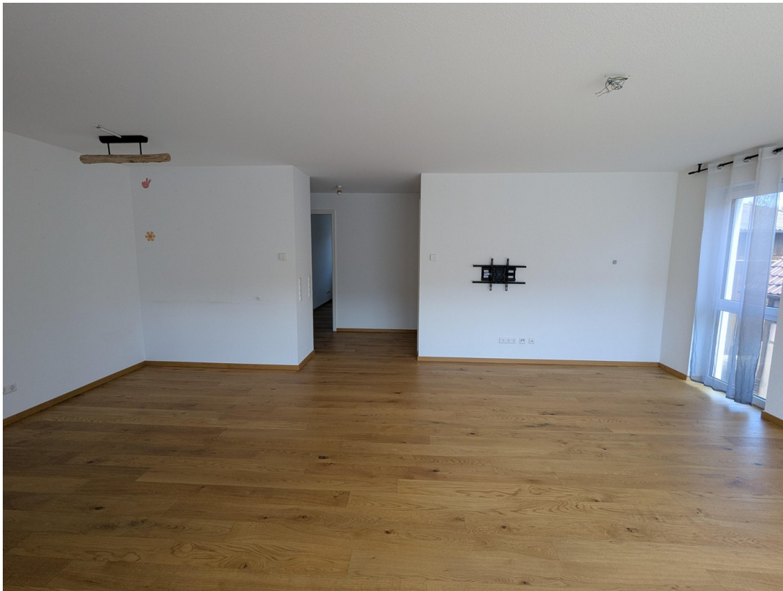
Küche, Wohnen, Essen