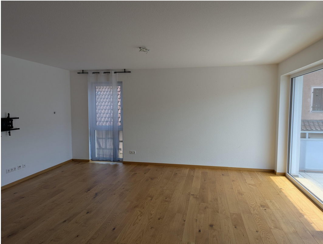
Küche, Wohnen, Essen