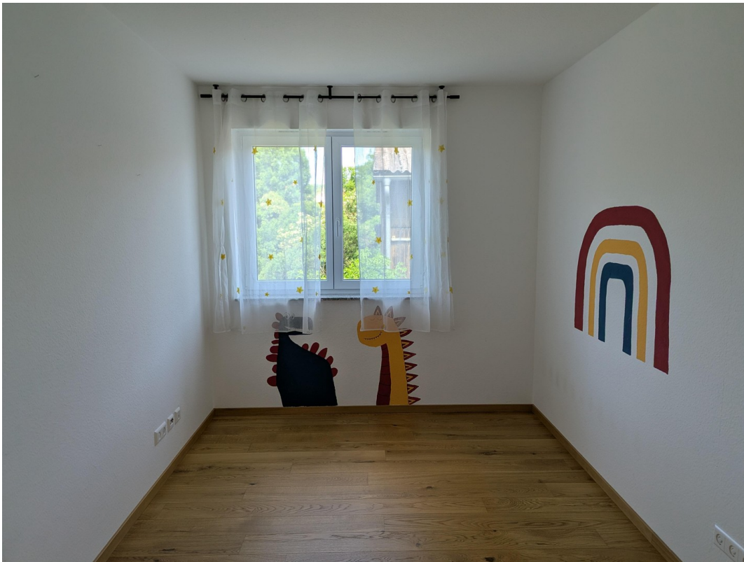
Kind 1 / Büro