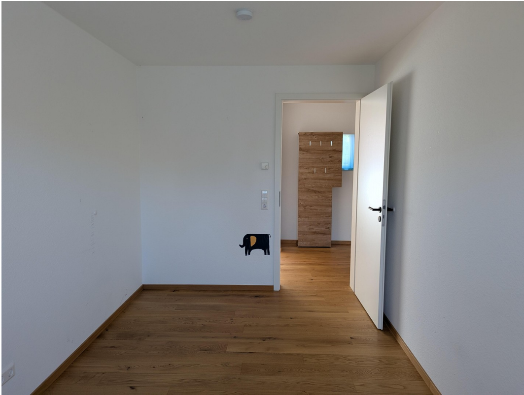
Kind 1 / Büro