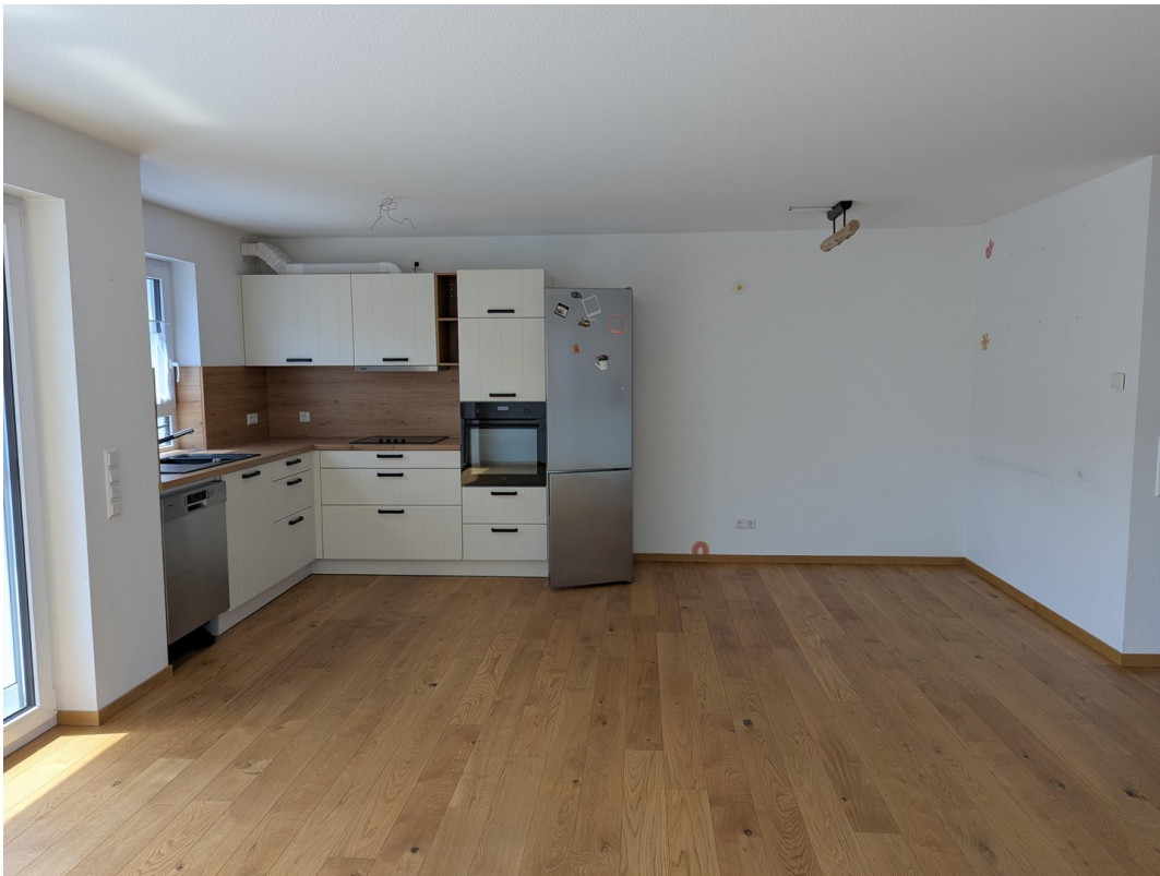
Küche, Wohnen, Essen