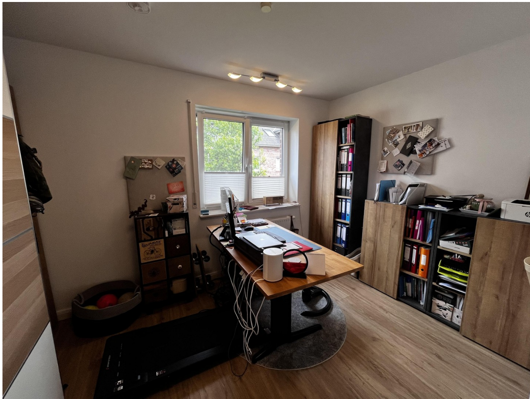
Kinder- bzw. Arbeitszimmer