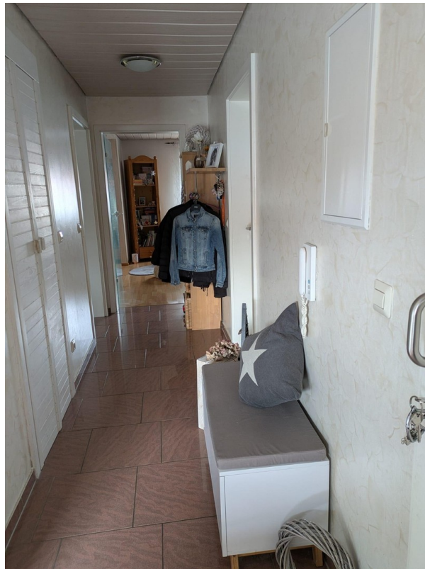
Eingangsbereich / Flur