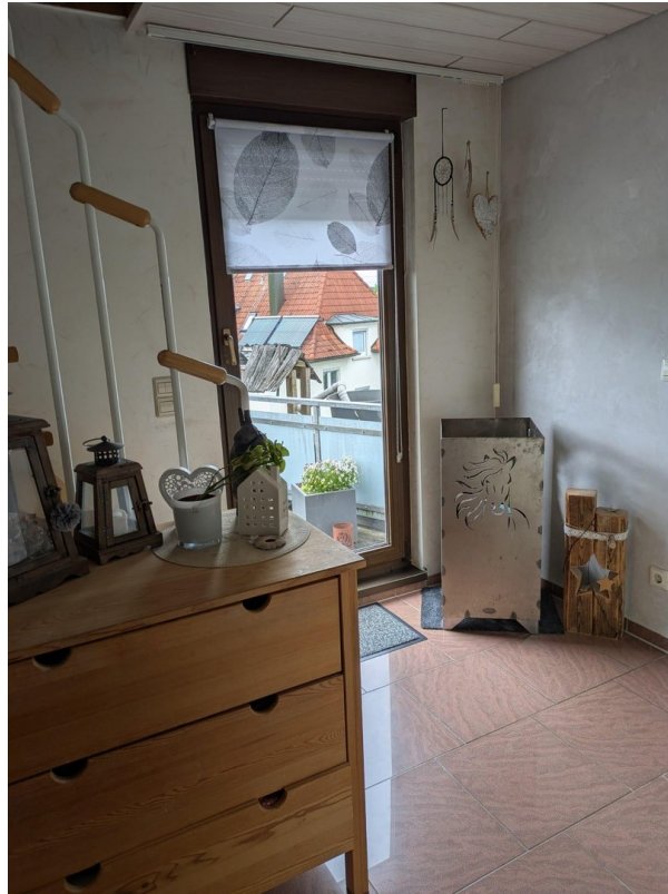
Eingangsbereich / Flur