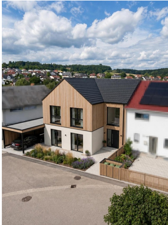
KI - Hausplanung