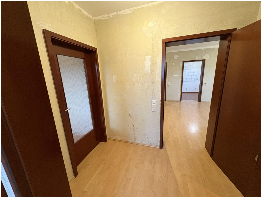
kleiner Flur innen