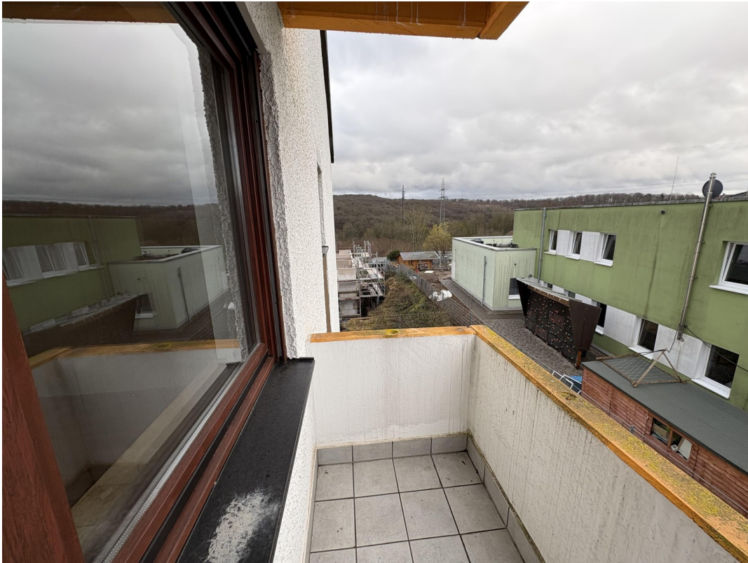
Balkon am Schlafzimmer