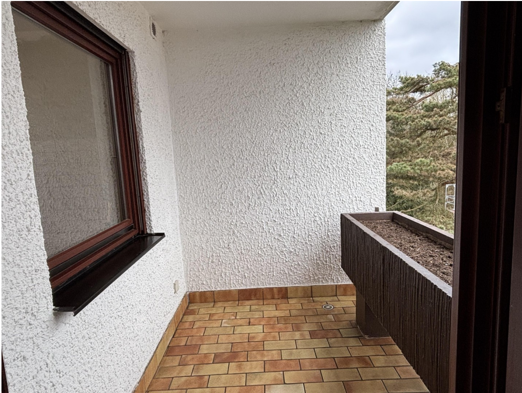
Balkon an Wohnzimmer