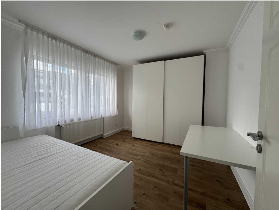
Schlafzimmer - Kind 1