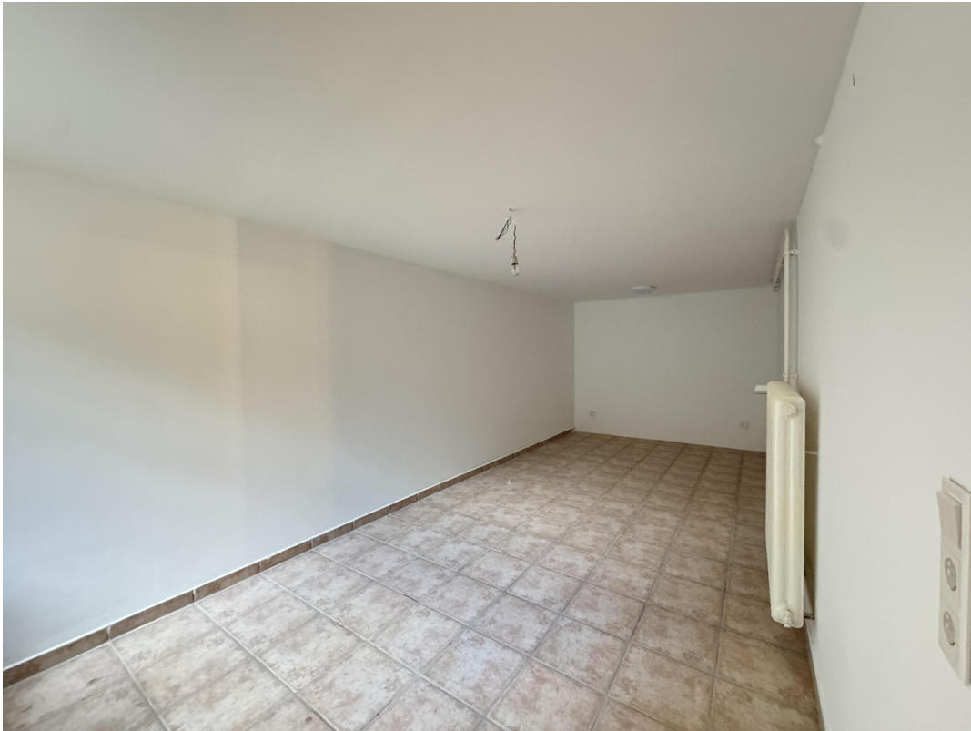
Keller - Abstellraum