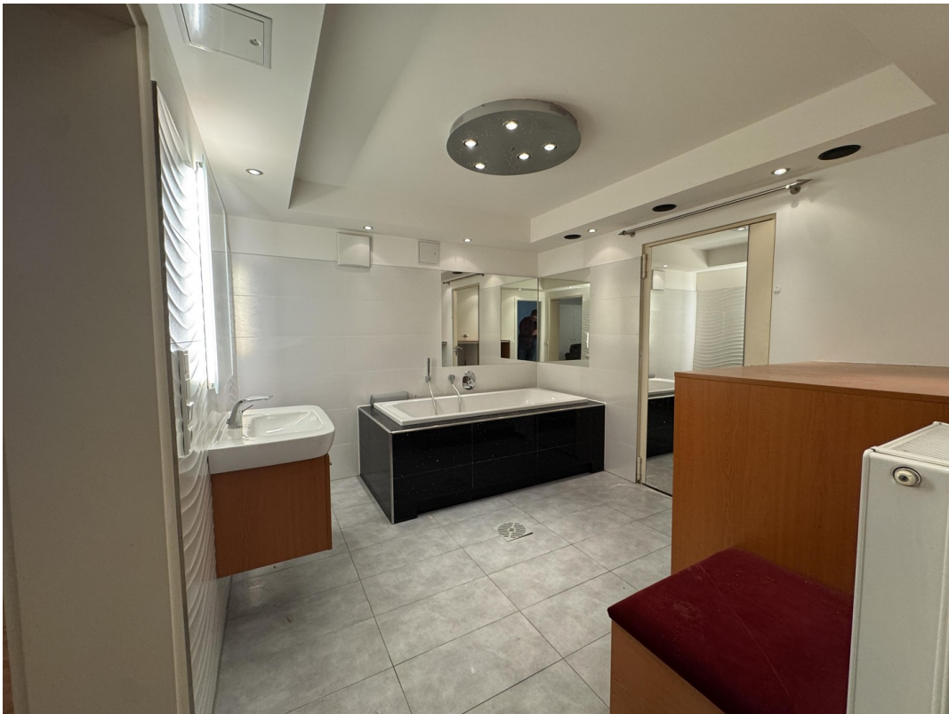
Keller - Whirlpool