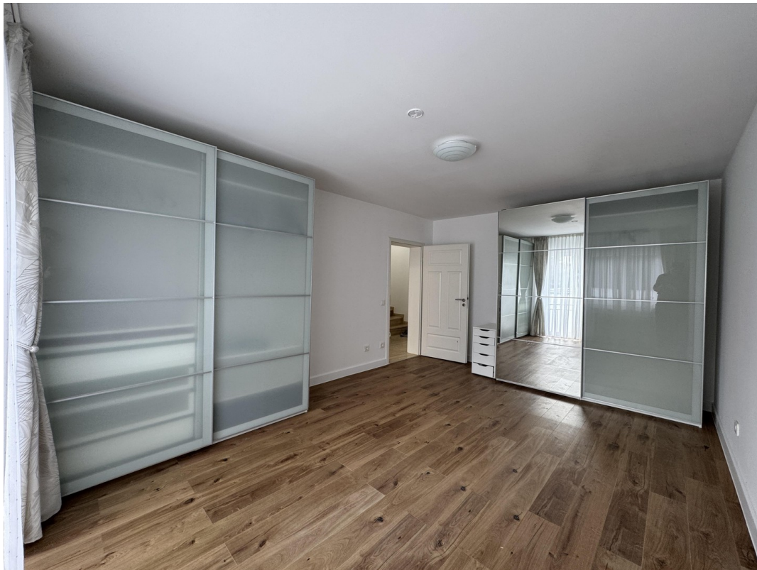
Schlafzimmer - Eltern