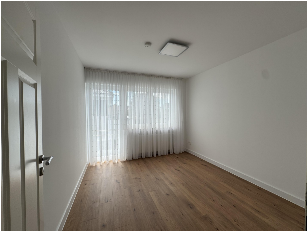
Schlafzimmer - Kind 2