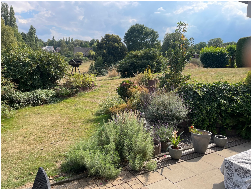
Blick auf die Pferdekoppel