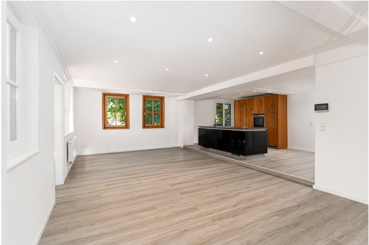
Wohn-/Essküche ohne Möbel