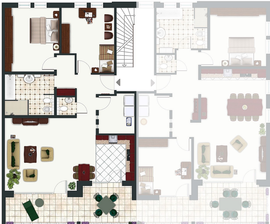
Grundriss - EG Wohnung