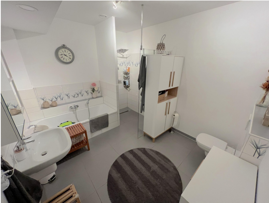
Badezimmer - Beispiel