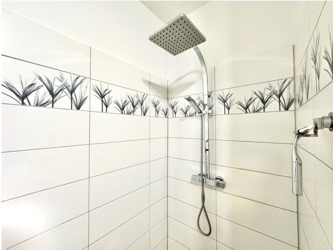
Duschbereich mit Regenbrause