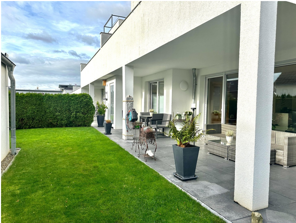
Garten - Beispiel