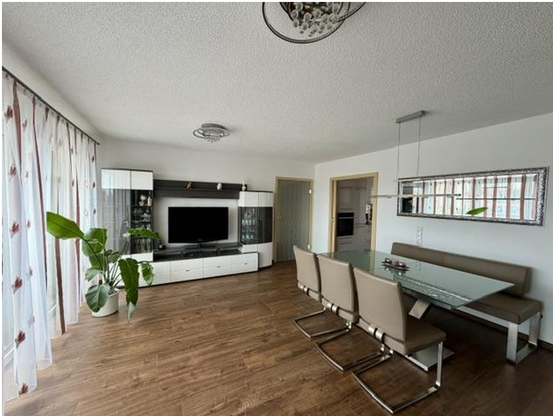
Wohn- und Essbereich B.1