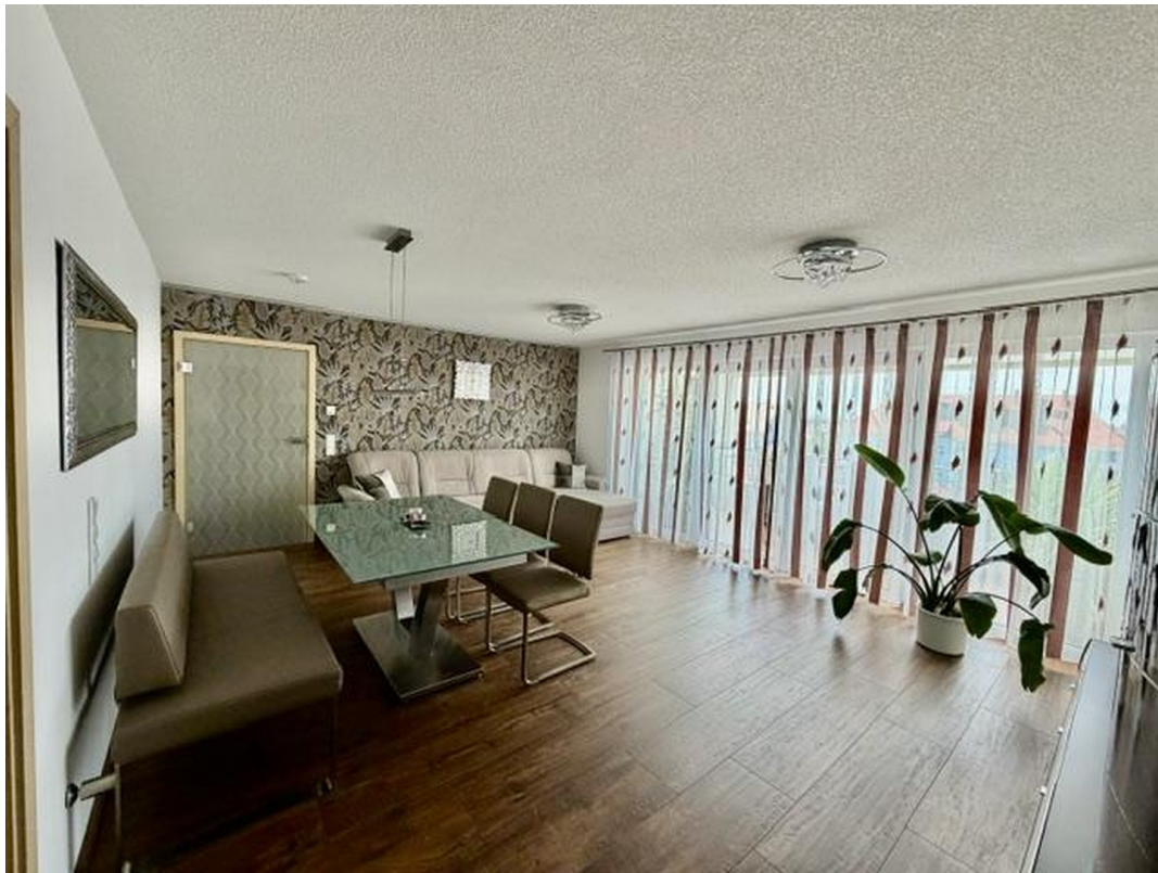
Wohn-und Essbereich B.2