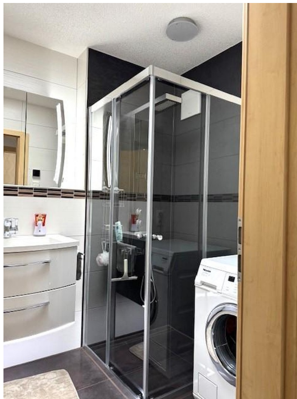
Kinderbad mit Dusche B.2