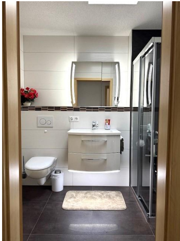
Kinderbad mit Dusche B.1