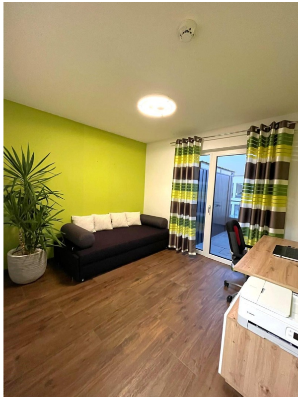
Kinderzimmer 2 / Büro