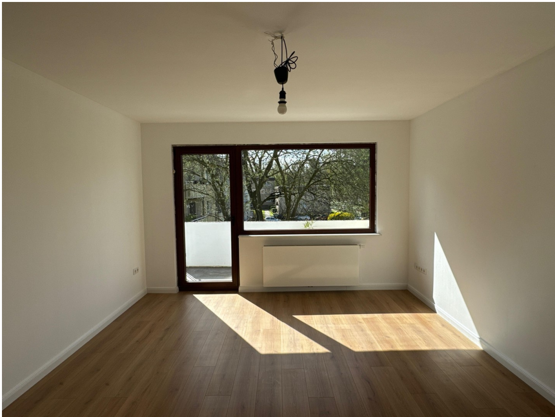
Frisch saniertes Wohnzimmer