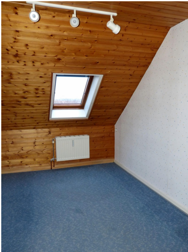
Zimmer im Dachgeschoss