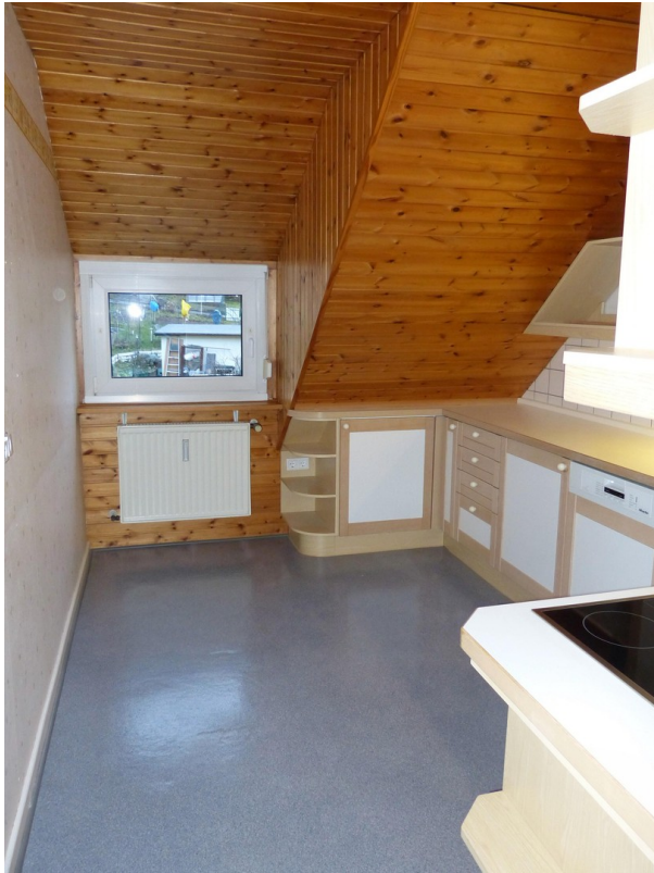
Essküche im Dachgeschoss