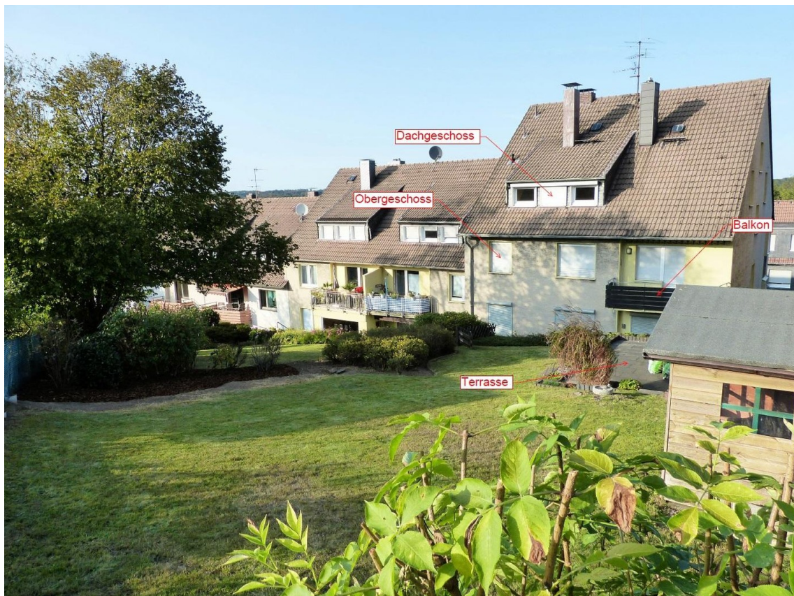
Lage der Wohnung