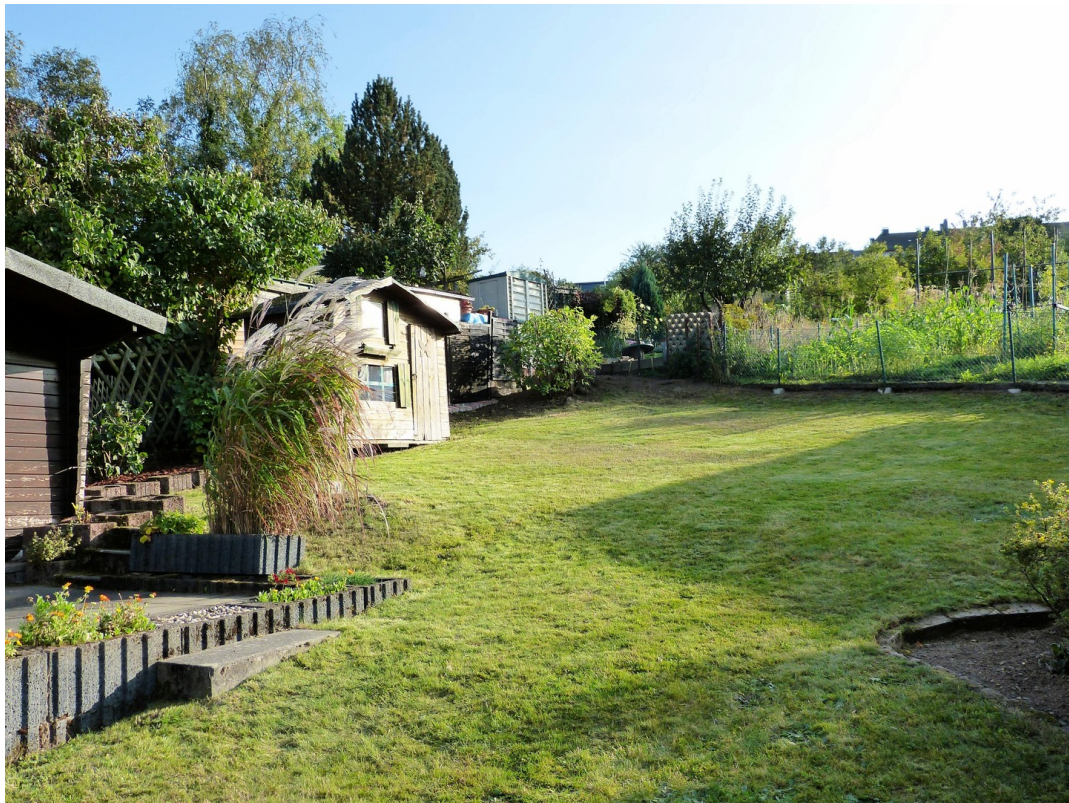
Blick in den Garten, links die