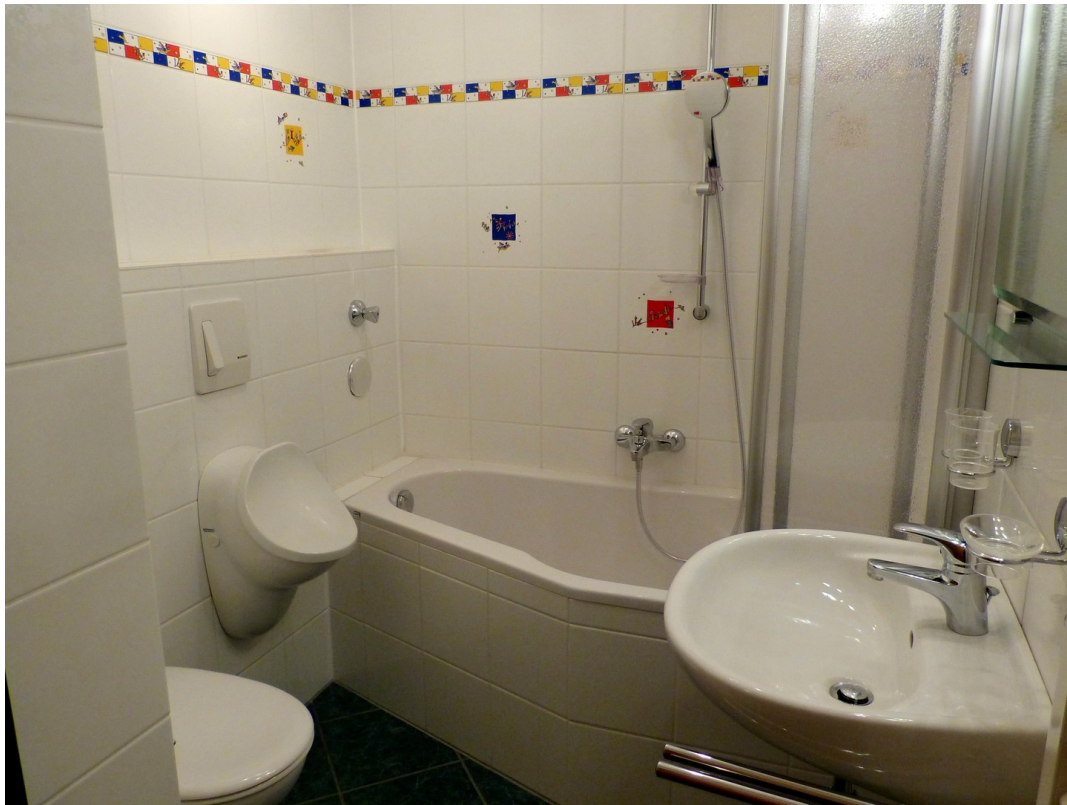
Bad im Obergeschoss