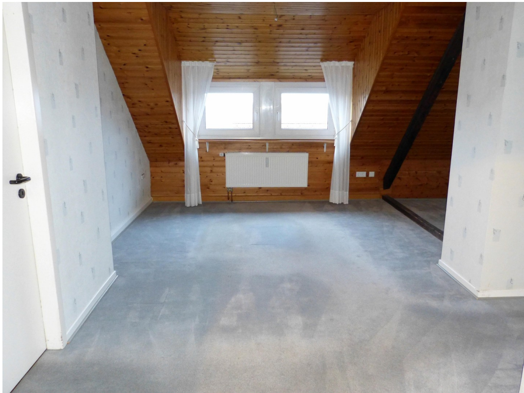
Wohn- und Esszimmer im Dachges