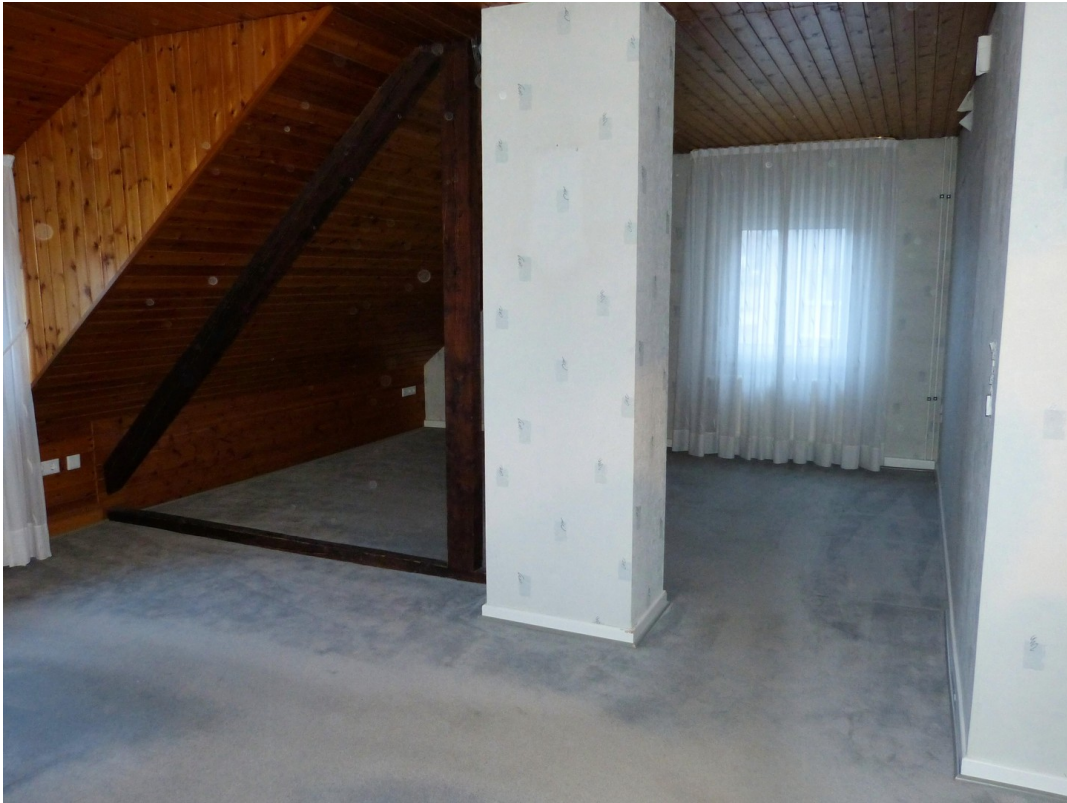
Wohn- und Esszimmer im Dachges