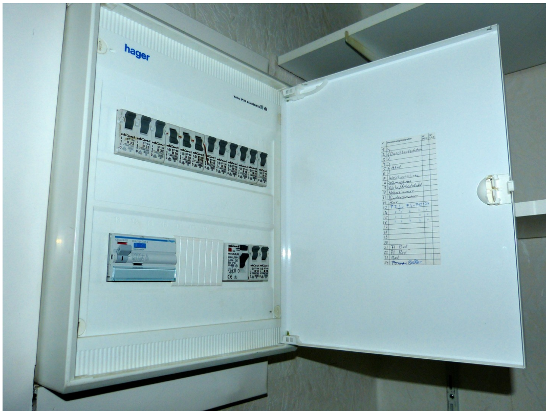
Sicherungskasten im Obergescho