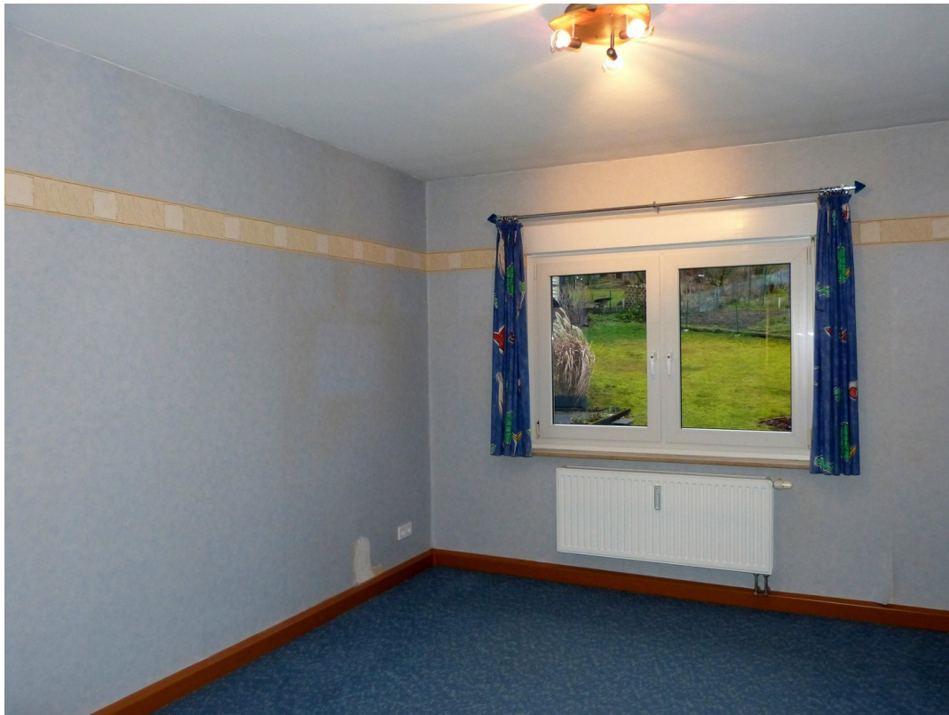
Kinderzimmer im Obergeschoss