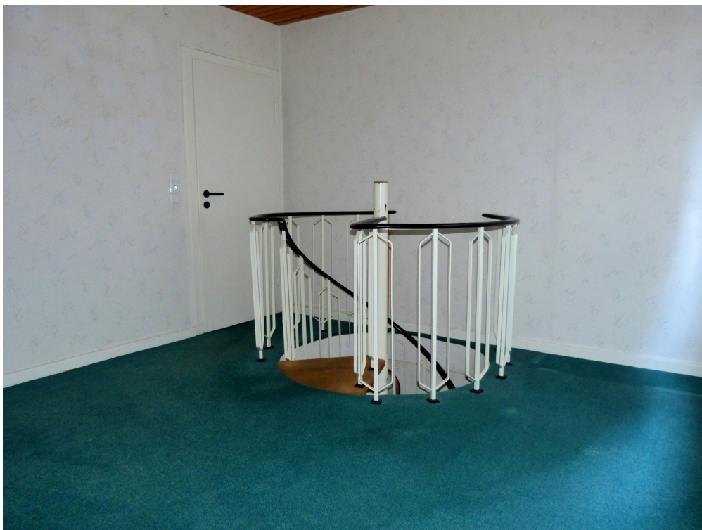
Zimmer im Dachgeschoss mit Ver