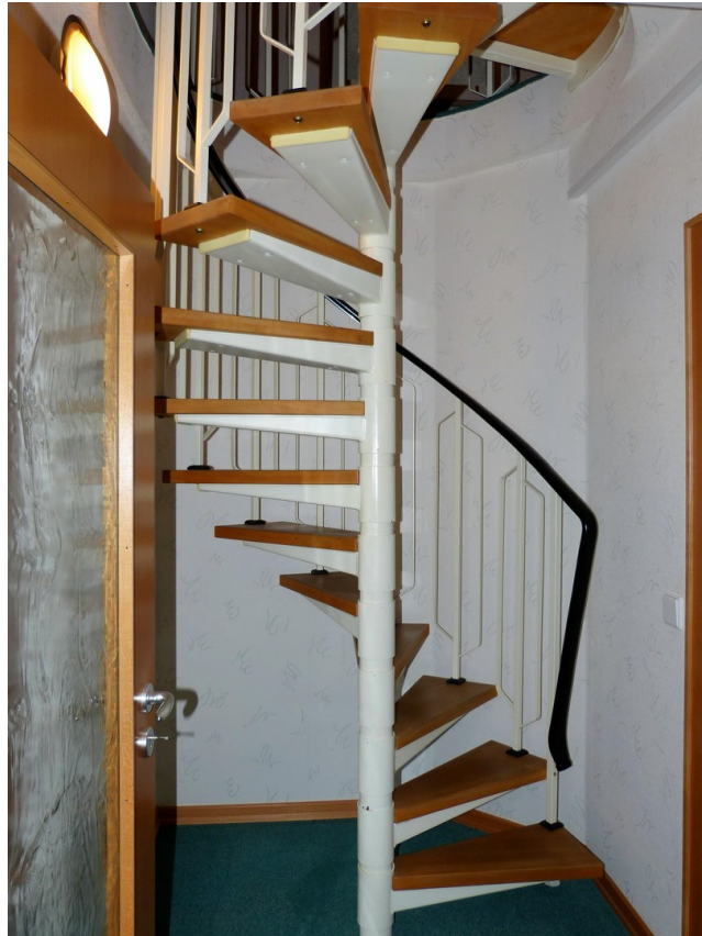
Verbindungstreppe innerhalb de