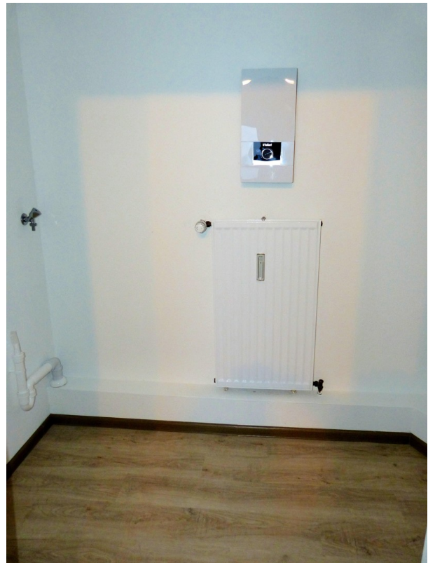
Hauswirtschaftsraum im Dach...