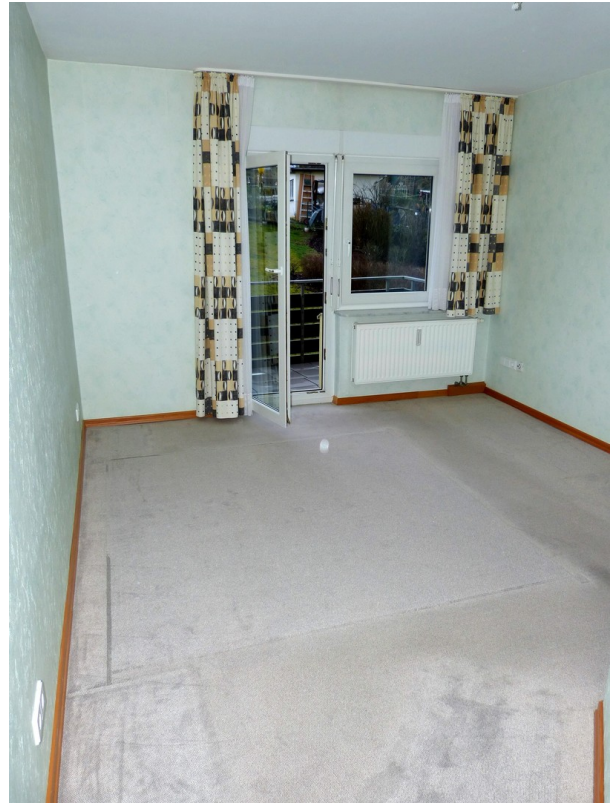
Schlafzimmer im Obergeschoss m