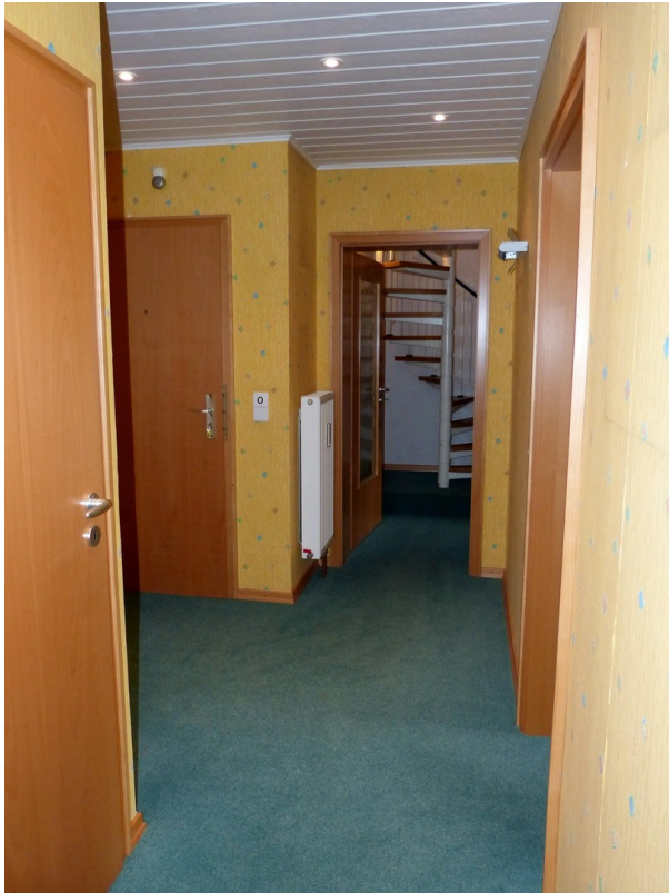
Flur im Obergeschoss