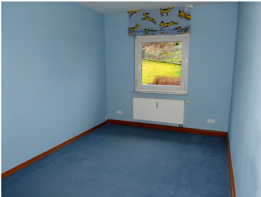
Arbeitszimmer im Obergeschoss