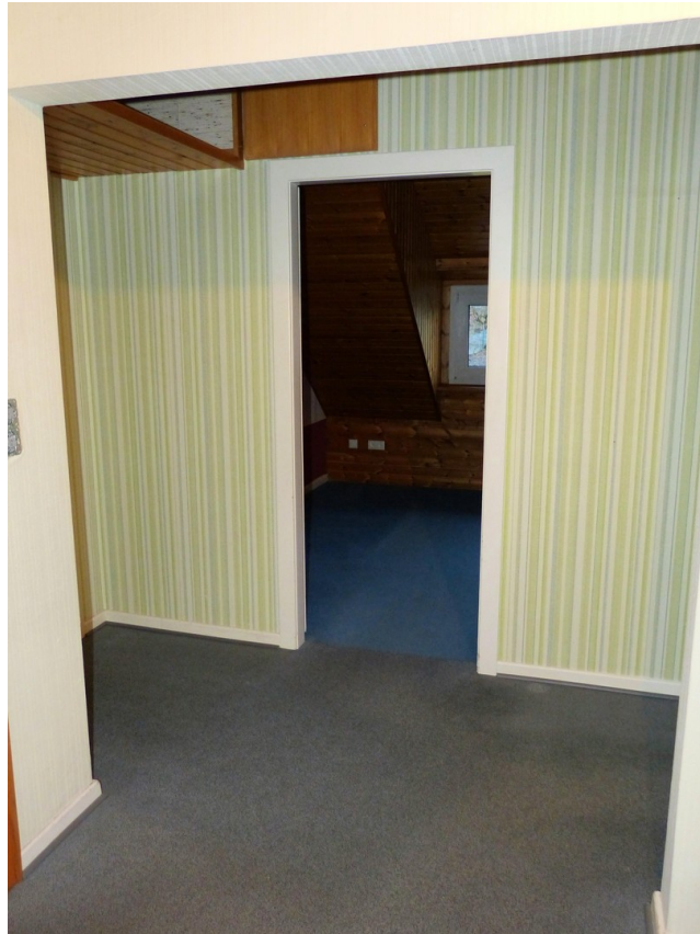
Flur im Dachgeschoss