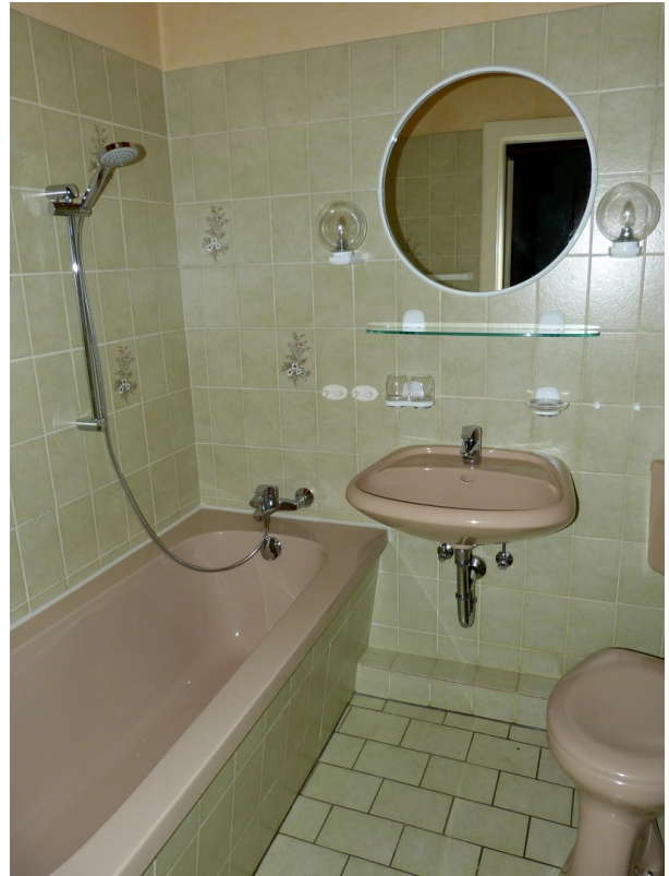
Bad im Dachgeschoss