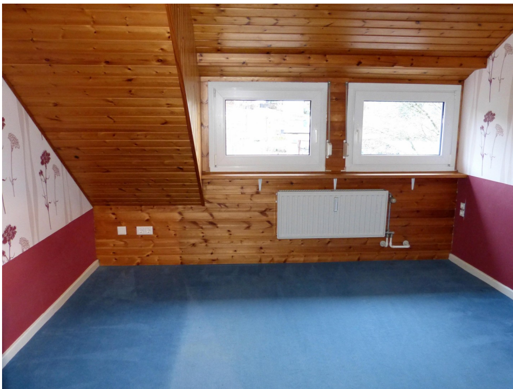
Kinderzimmer im Dachgeschoss