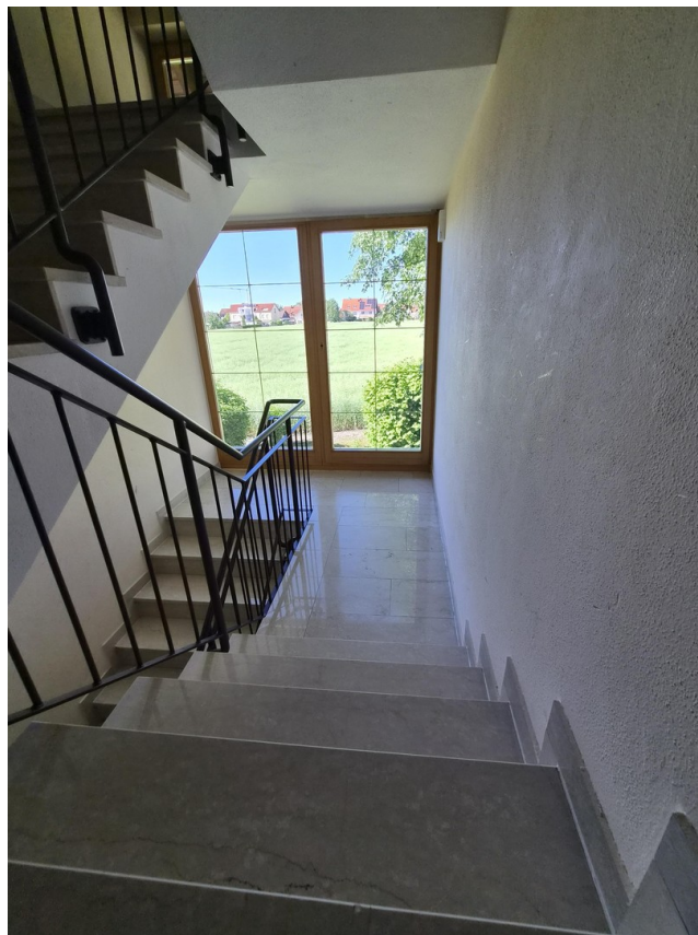
Treppenhaus zum 1.OG