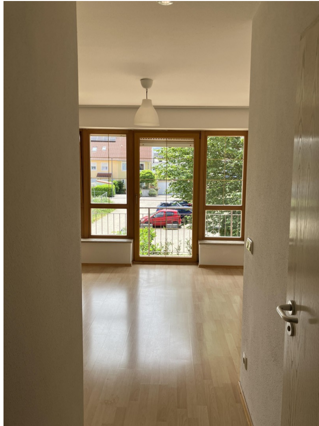
Flur und Wohnzimmer