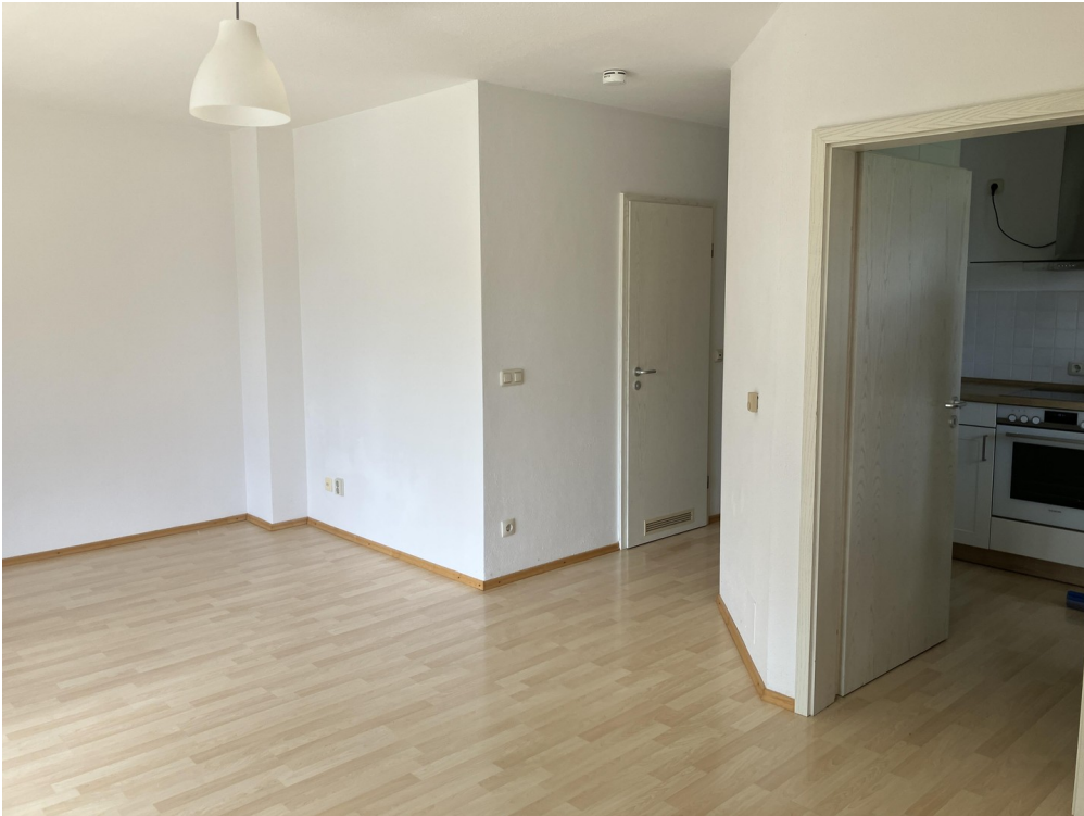
Wohnzimmer Blick Küche u Bad