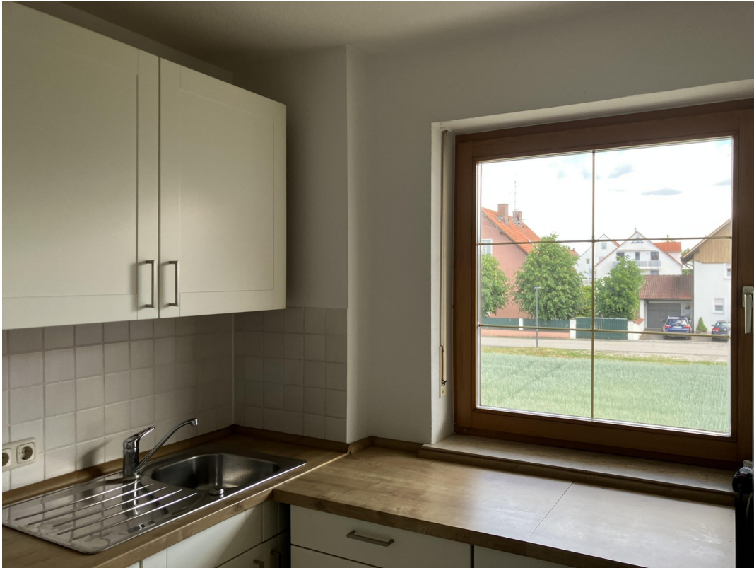
Küche mit Fenster