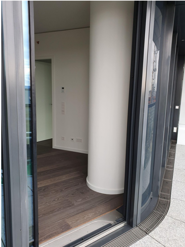
auf Balkon nach Innen