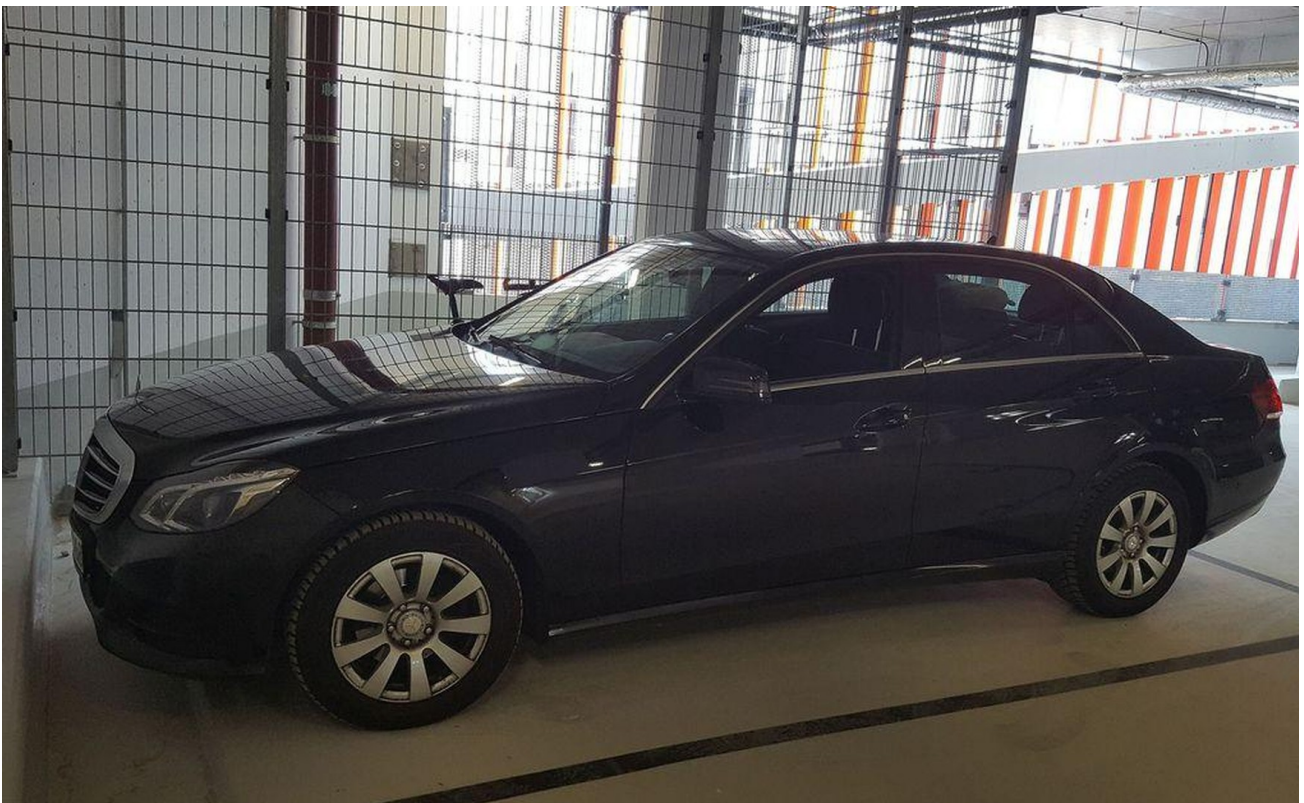
Abstellplatz im Parkhaus