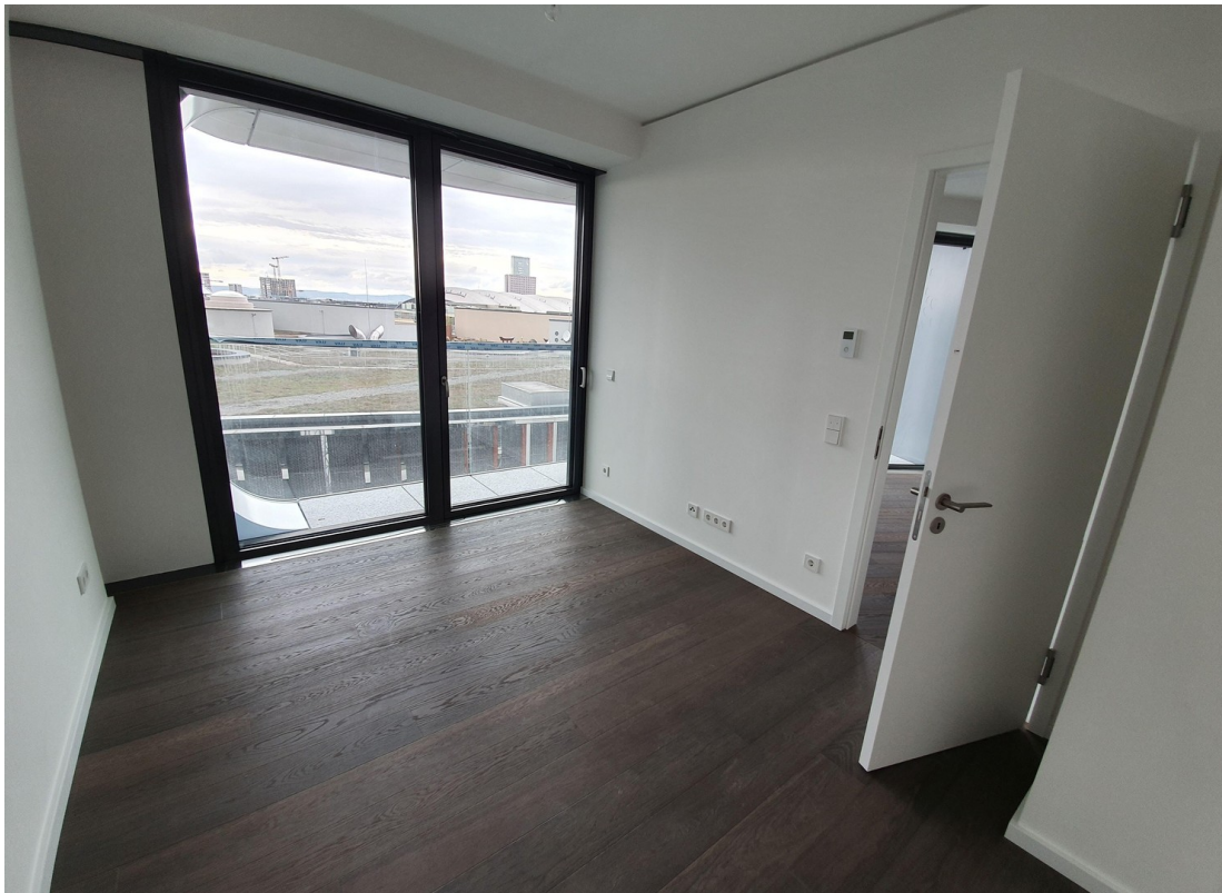
Schlafzimmer Richtung Fenster