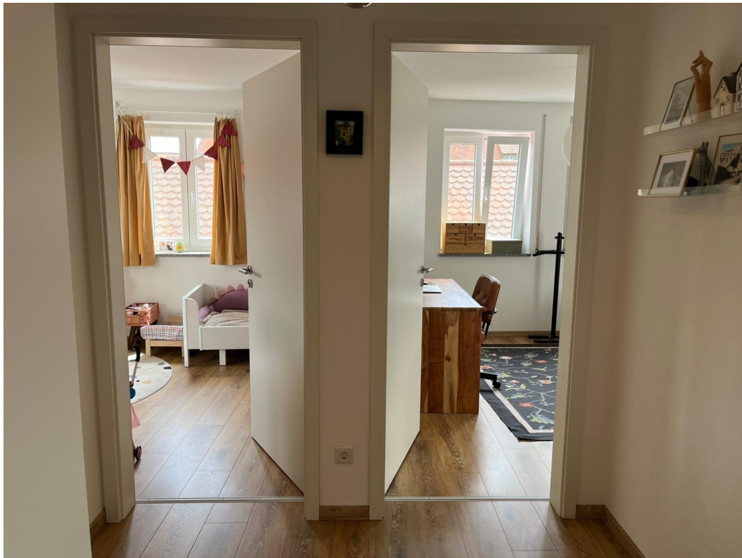
Flur mit Blick in Zimmer