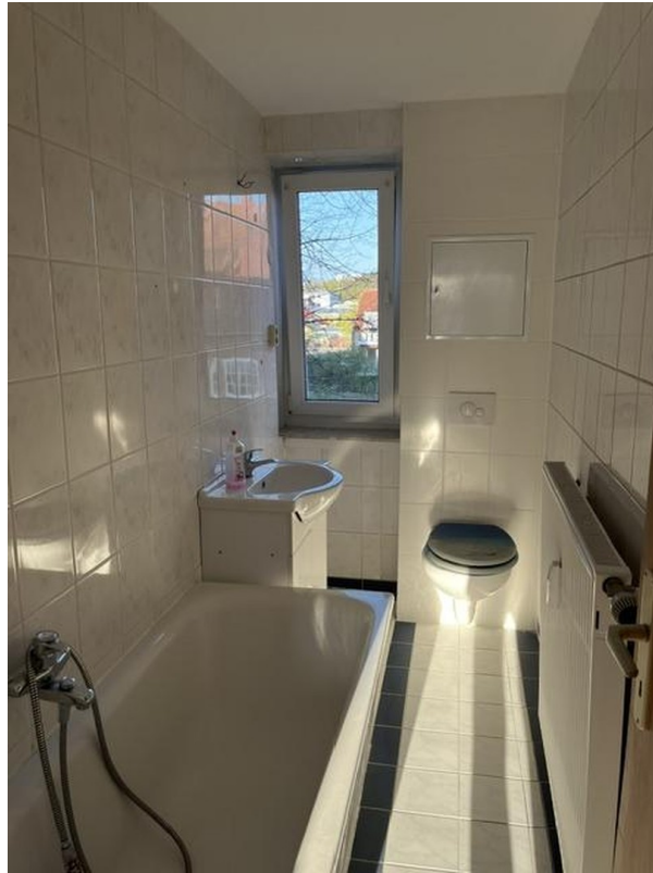
Bad mit Badewanne+Fenster