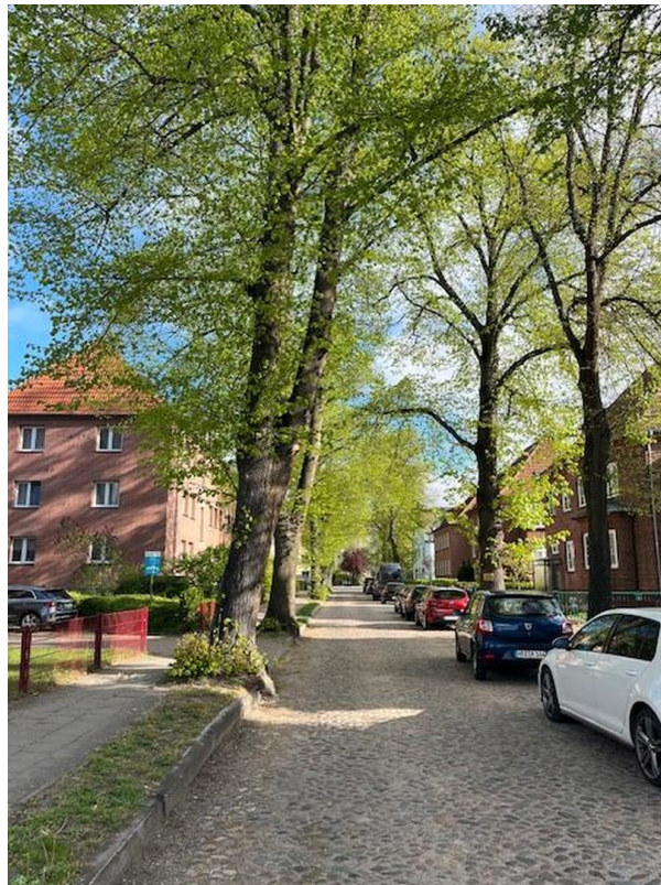
Blick in die Straße