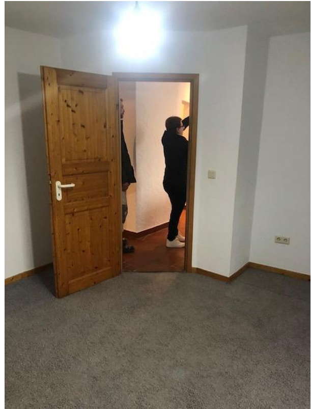
1.Schlafz. mit altem Bodenbela