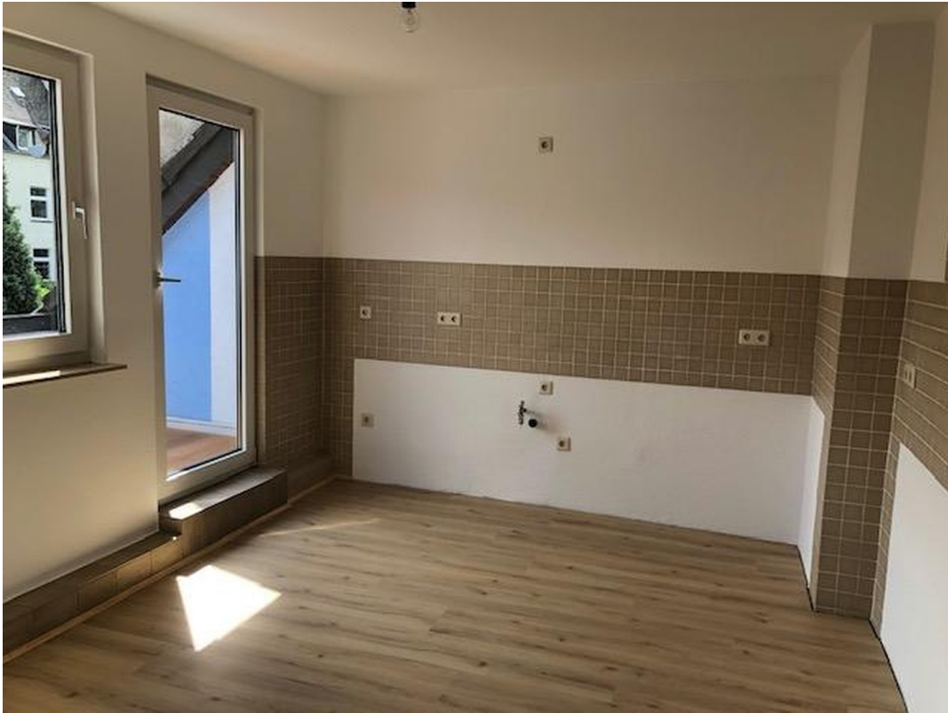
Wohnküche mit Ausg. z. Balkon