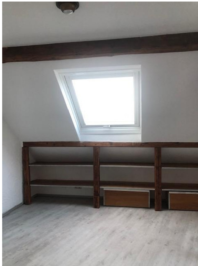
neues Veluxfenster im Wohnz.