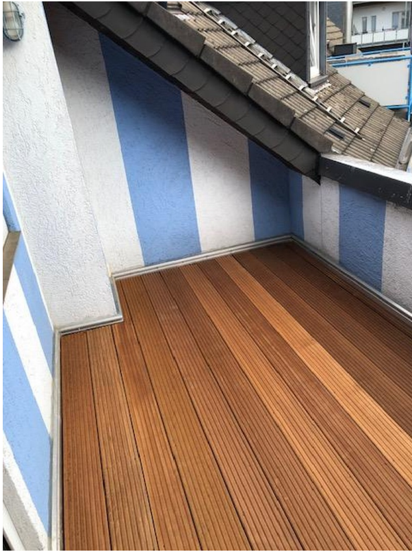
Balkon von 1,90 x 3,70 Meter