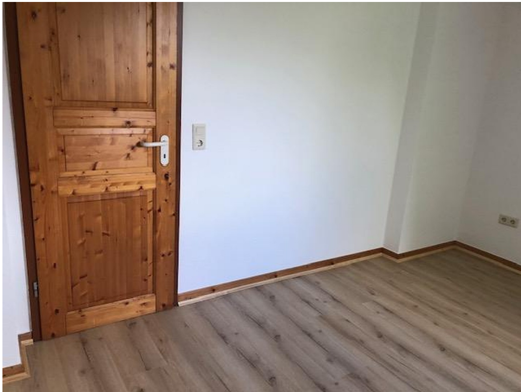
zweites Schlafzimmer von 12 qm