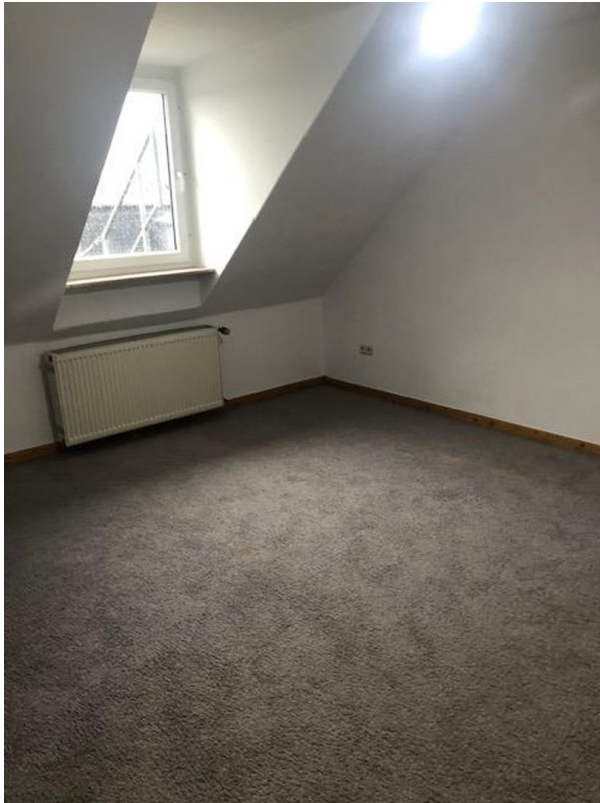
1.Schlafz. mit altem Bodenbela