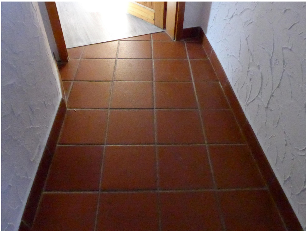
Bodenbelag im Gang zu den Räum