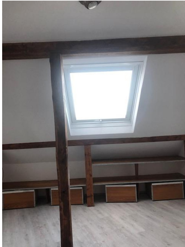
neues Veluxfenster im Wohnz.