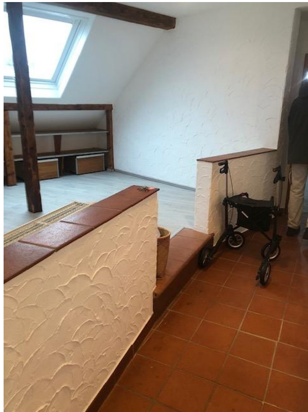
Stufe zum Wohnzimmer