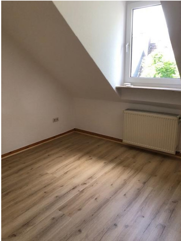
zweites Schlafzimmer von 12 qm