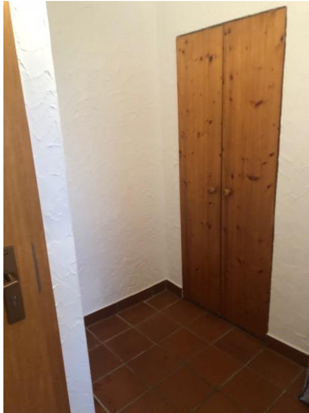
Einbauschränke in der Diele