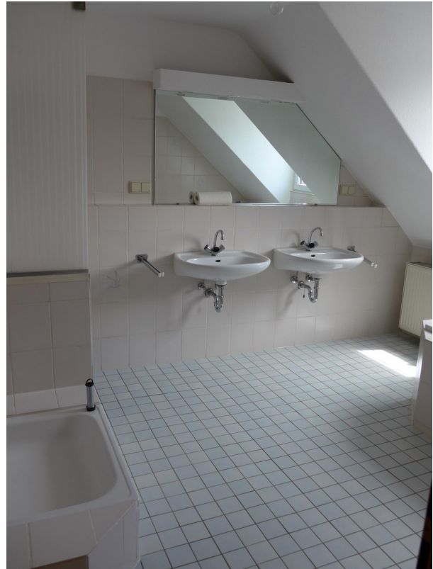
Bad von 10 qm