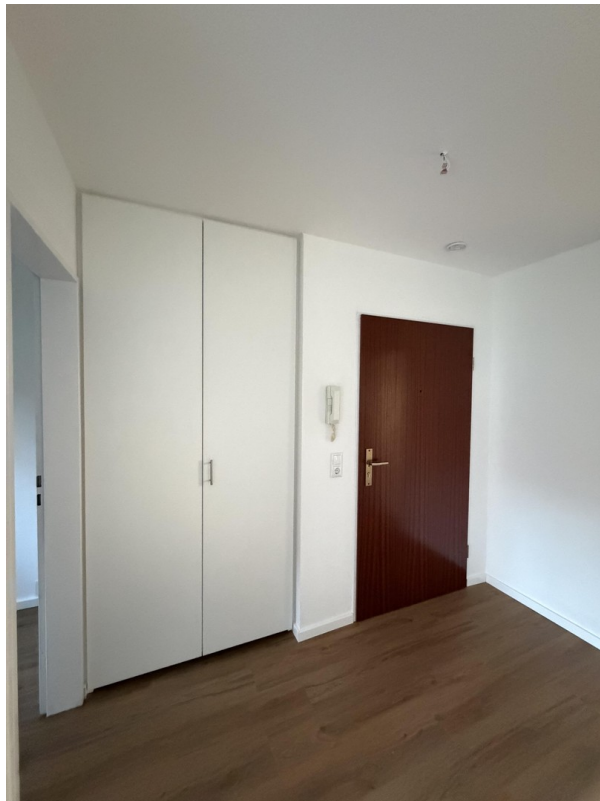
Eingangsbereich mit Abseite