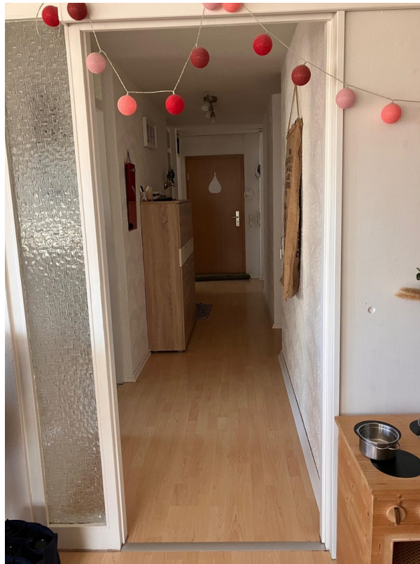
Blick Wohn-Esszimmer in Flur