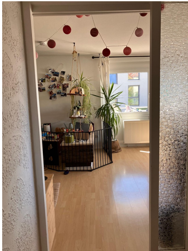
Blick Flur in Wohn-Esszimmer