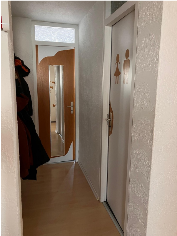
Flur Richtung Badezimmer