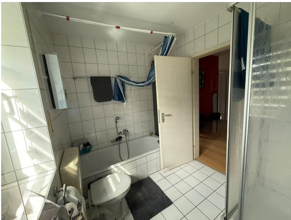
Bad mit Badewanne und Dusche