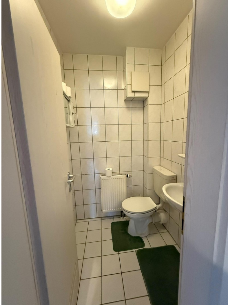
Gäste WC / Abstellraum