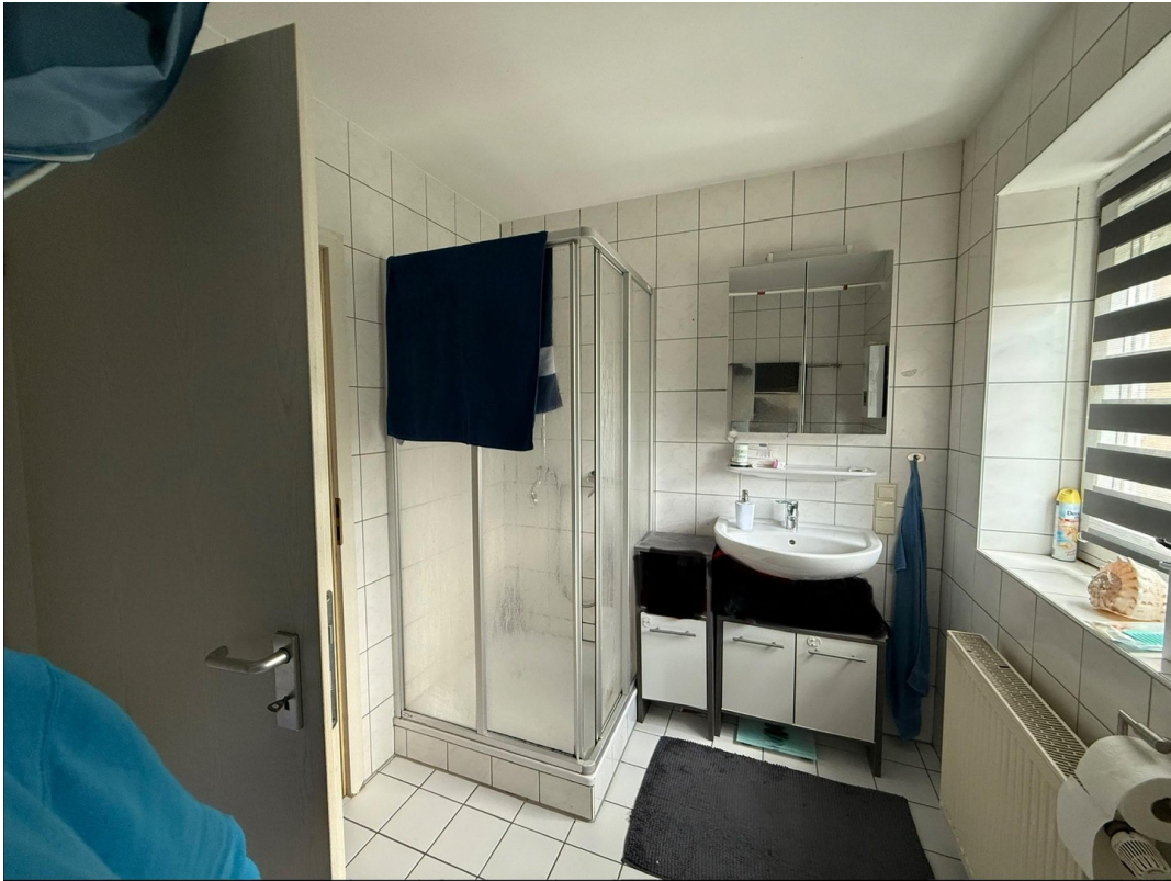
Bad mit Badewanne und Dusche