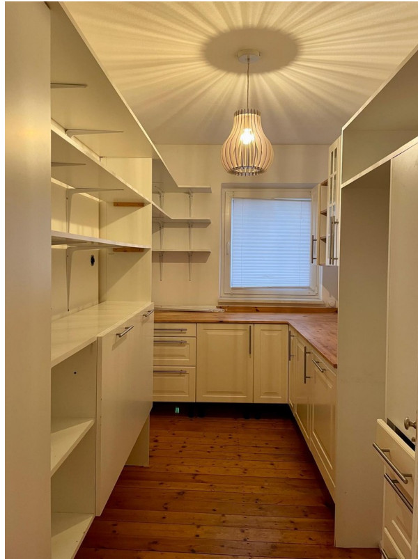
Wäsche- / Vorrats- / Abstellraum