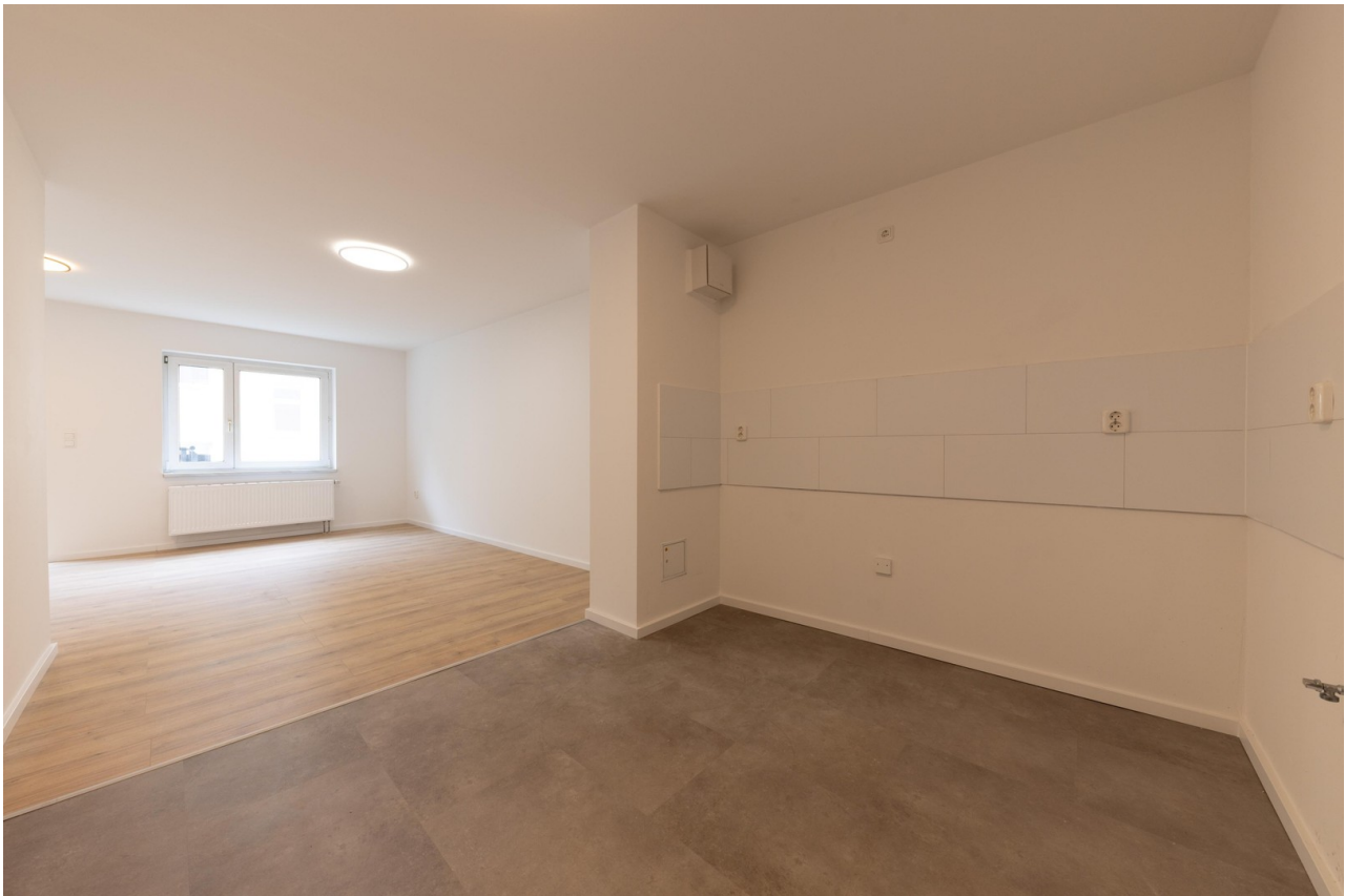
offenes Wohnzimmer 2