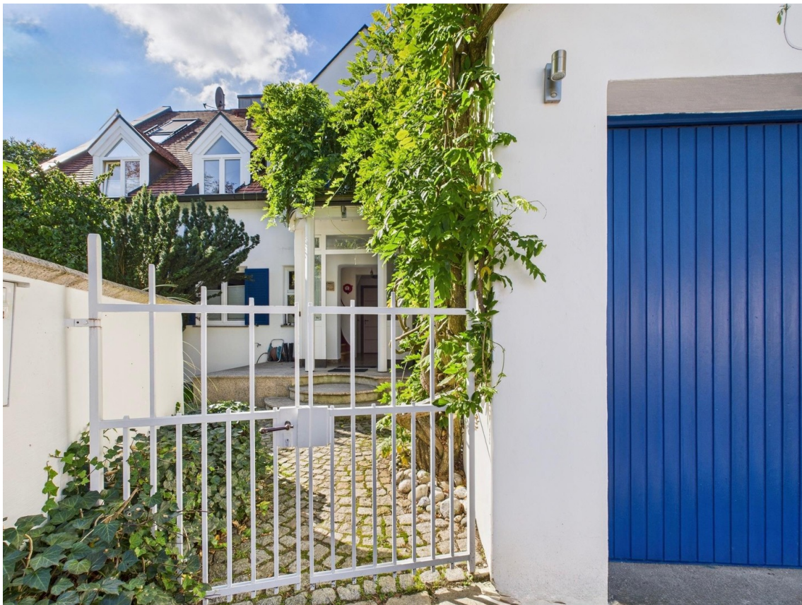
Eingangsbereich mit Garage