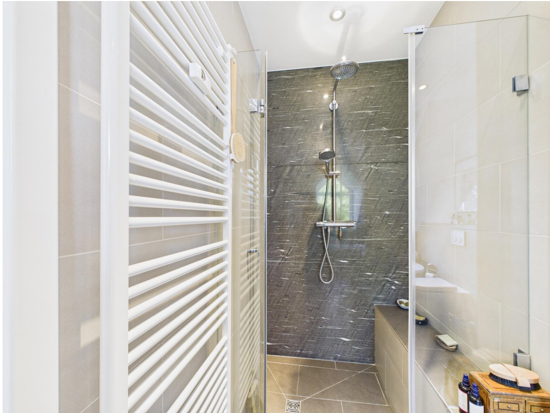
Natursteindusche mit Sitzbank