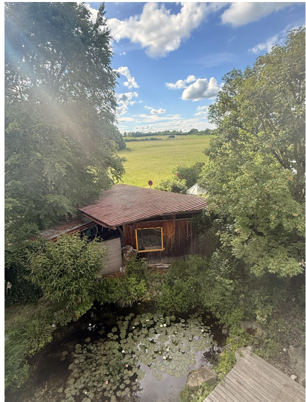
Blick zum Westgarten