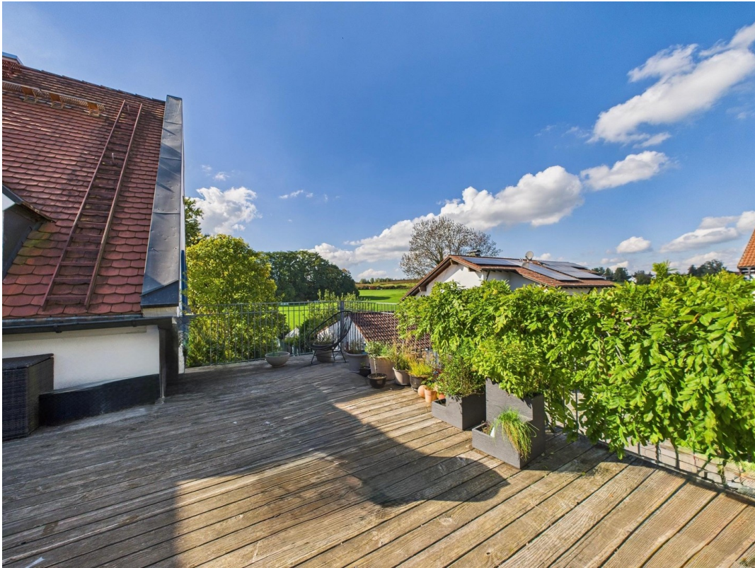
Dachterrasse mit Weitblick