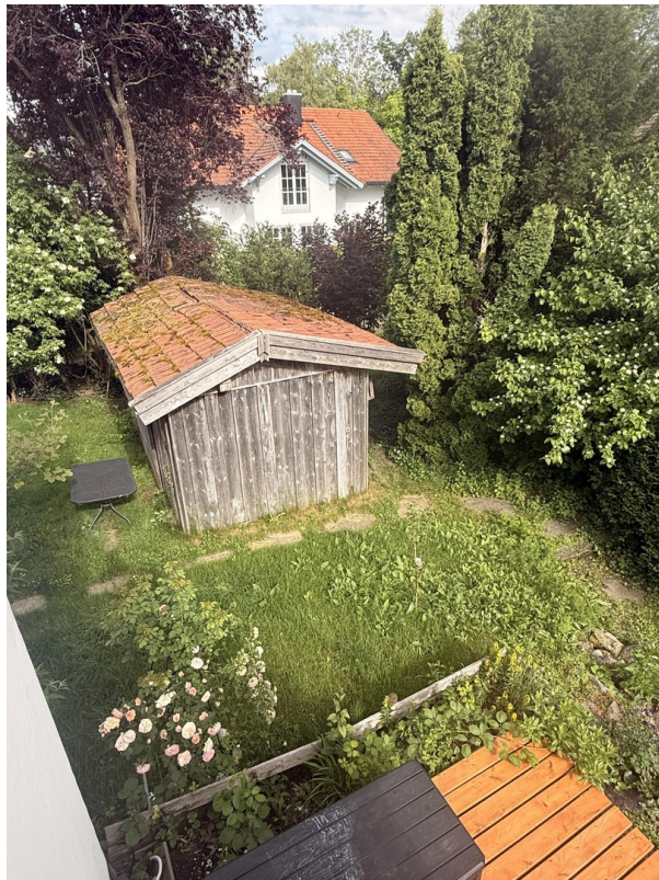
Blick vom Südbalkon links