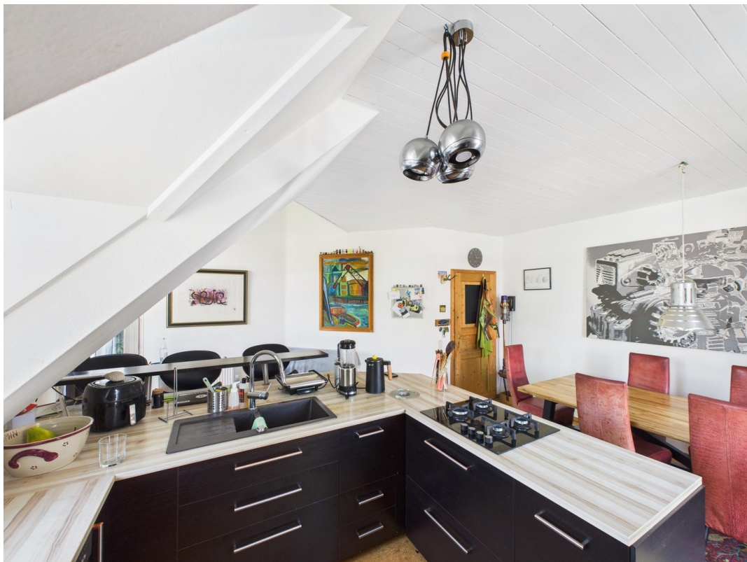
Wohnküche, Bar und Essbereich