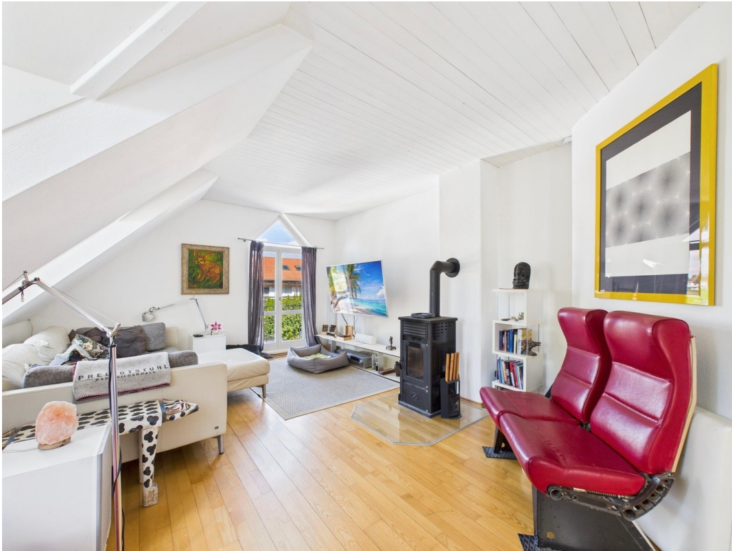
Wohnzimmer mit Kaminofen