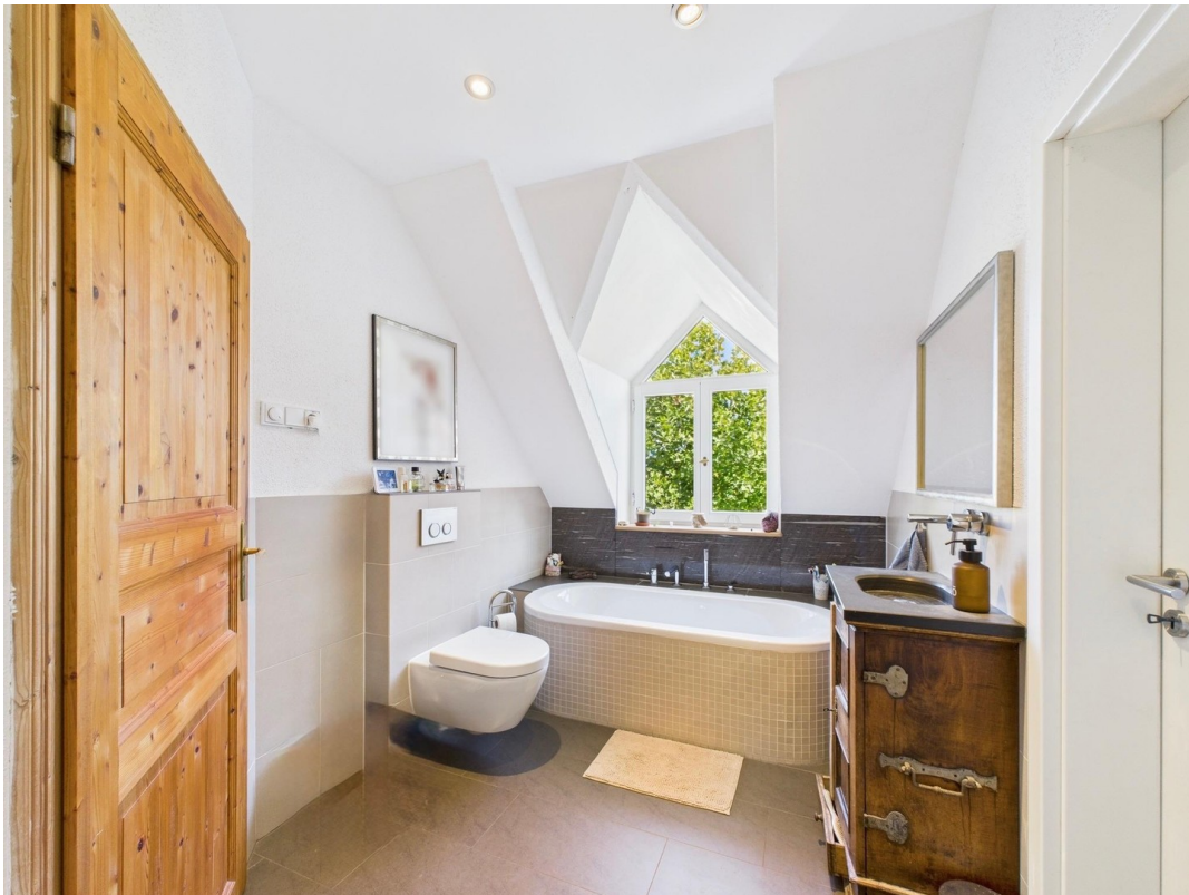
Angrenzendes Bad mit FBH