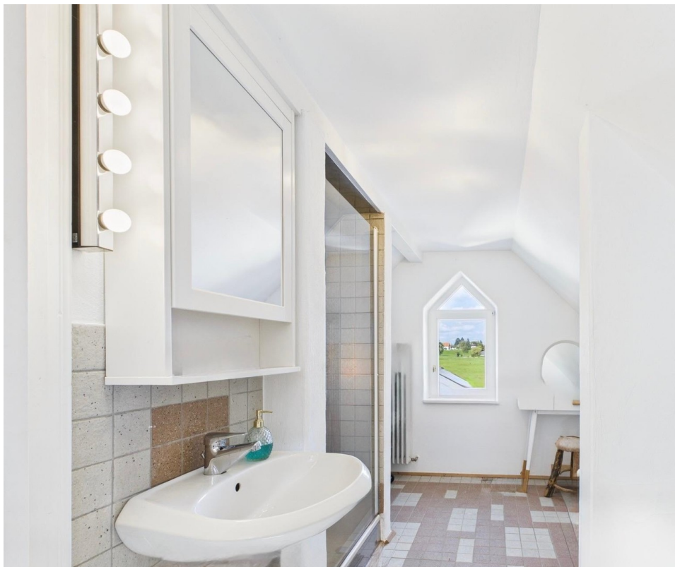
Tageslichtbad mit Dusche u WC