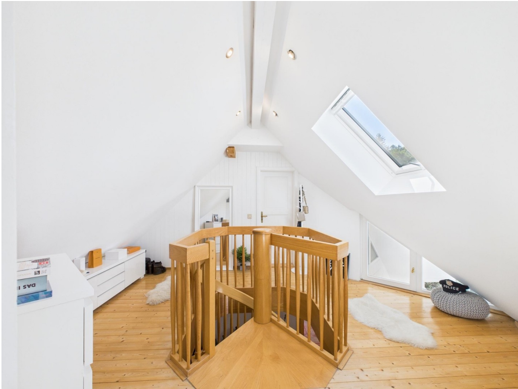
Ankunft im DG