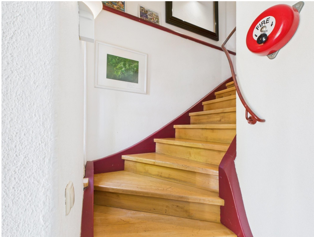
Aufgang zur Wohnung