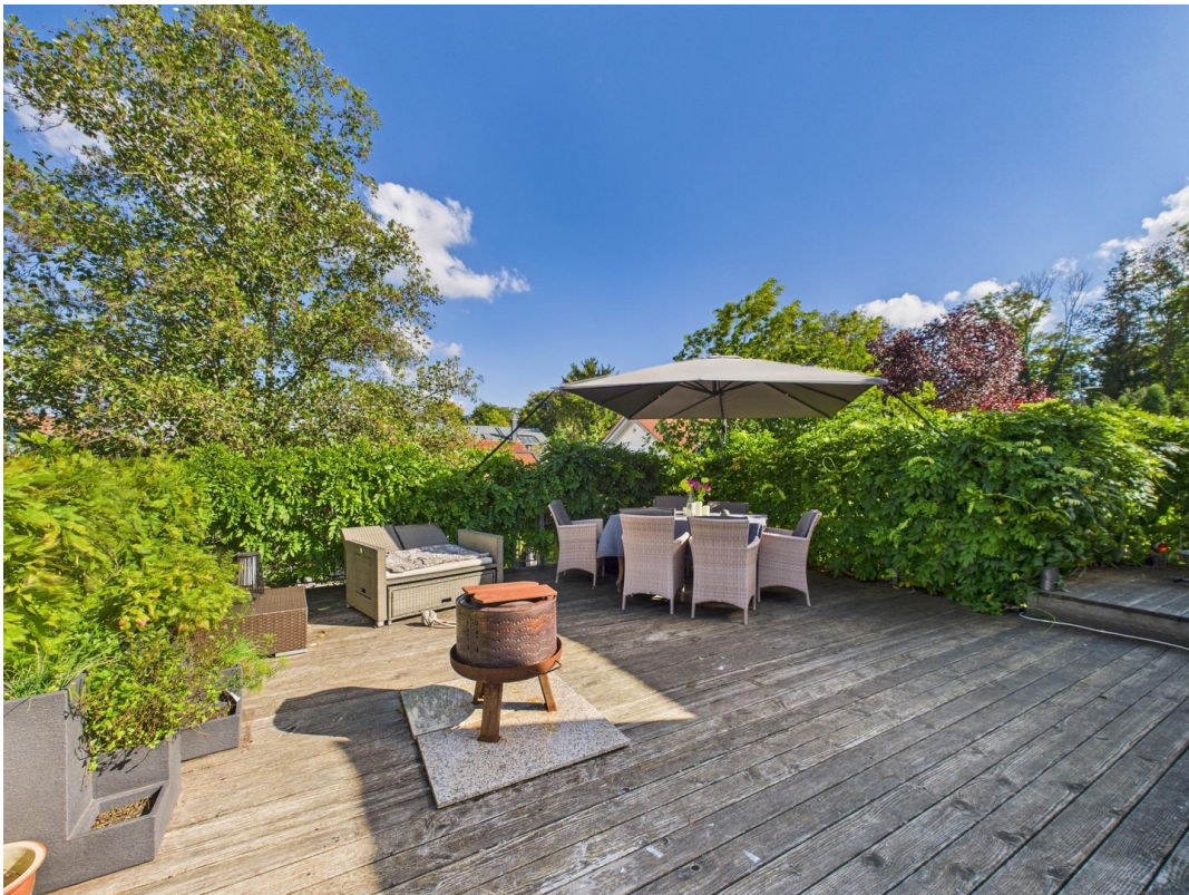
Dachterrasse mit Begrünung