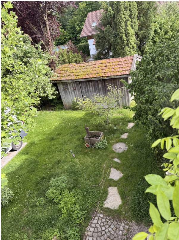
Gartenanteil mit Hütte