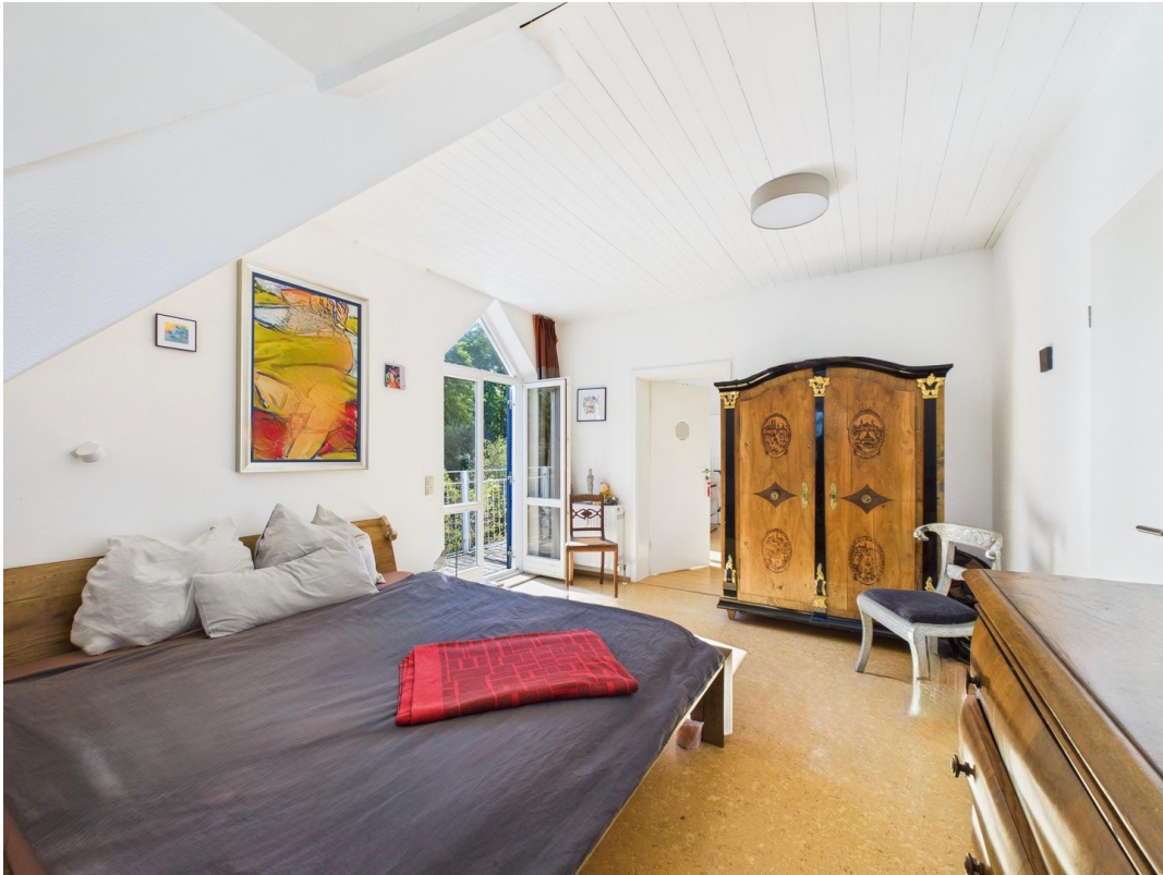
Schlafzimmer mit Südbalkon