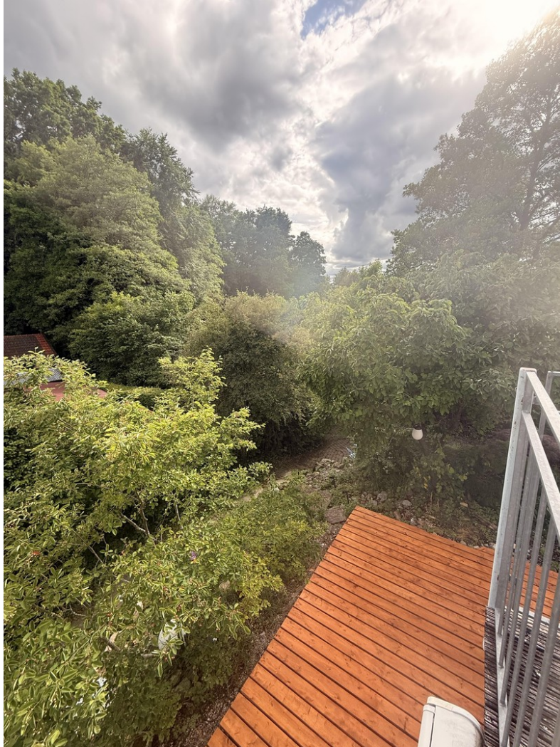
Blick vom Südbalkon rechts