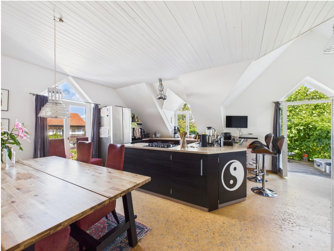
Küche mit Ausgang Terrasse