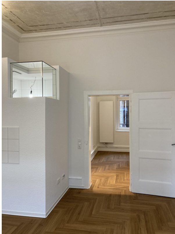
Küche Blick zum Schlafzimmer