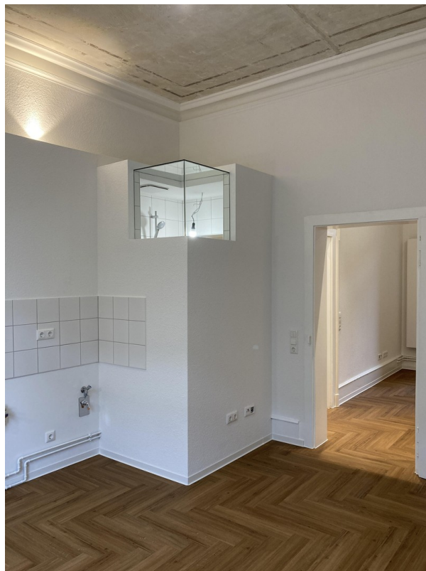
Küche Blick zum Schlafzimmer