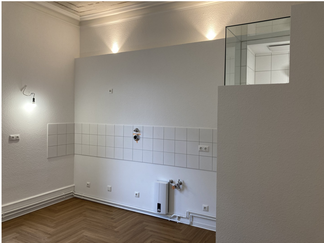
Küchennische zur Karlstr.