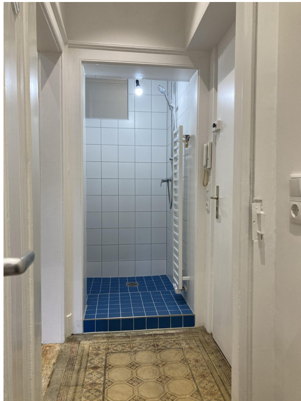
Flur und Dusche