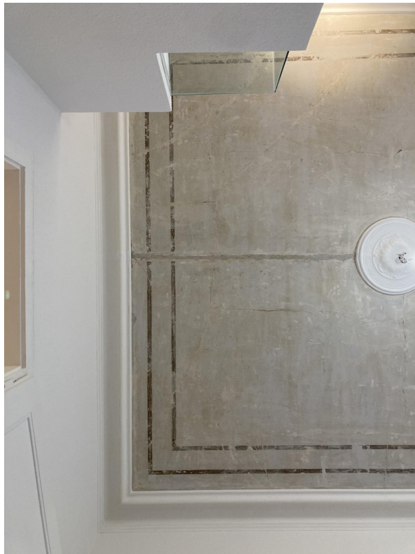
Decke in Küche