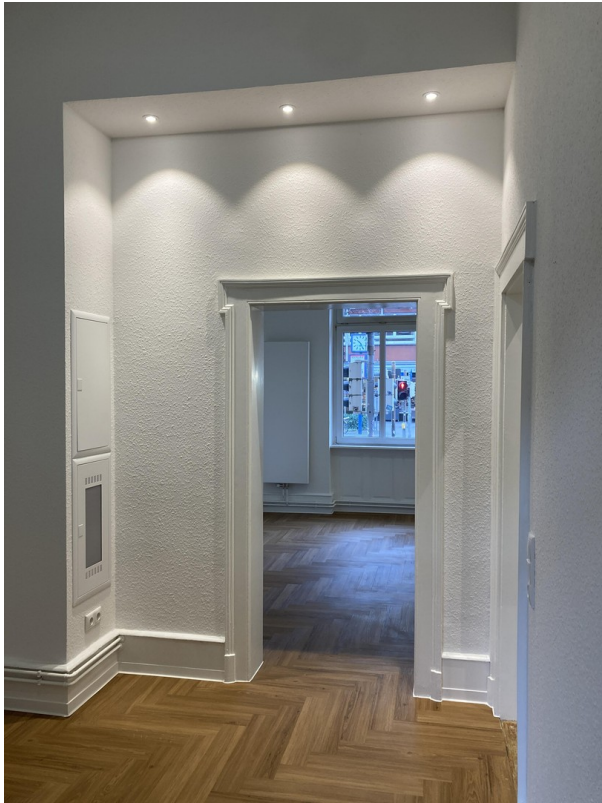
Schlafzimmer zur Küche