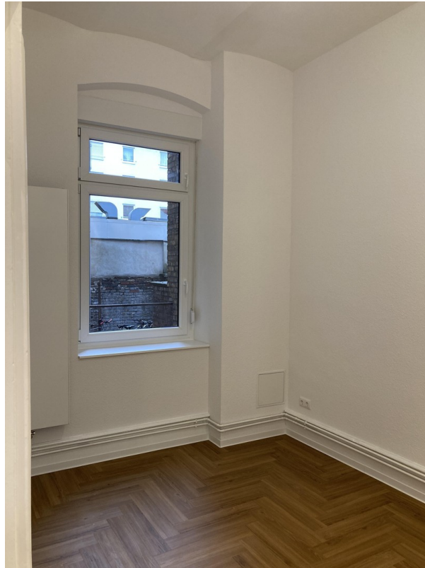
Schlafzimmer zum Hof