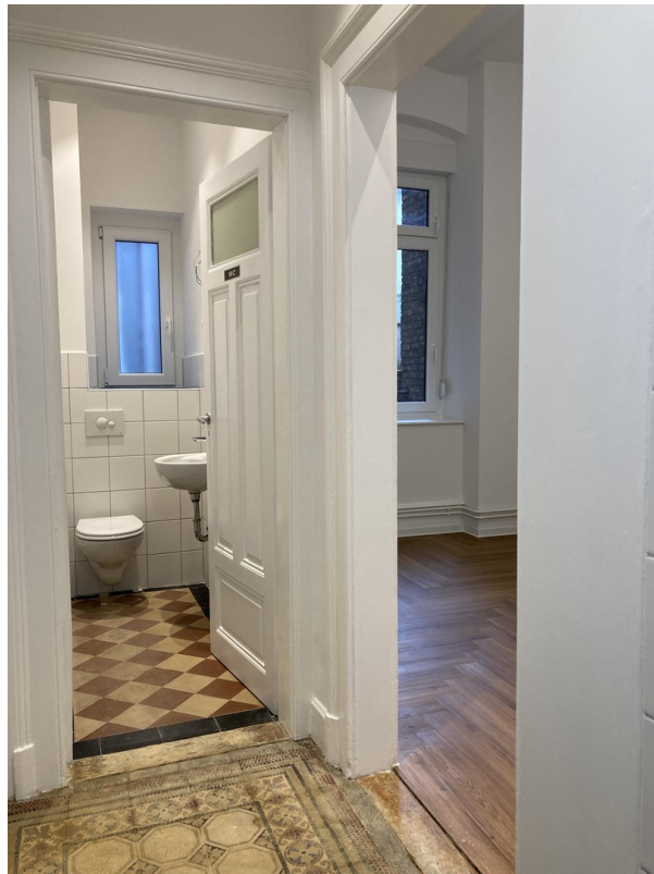
Flur und WC