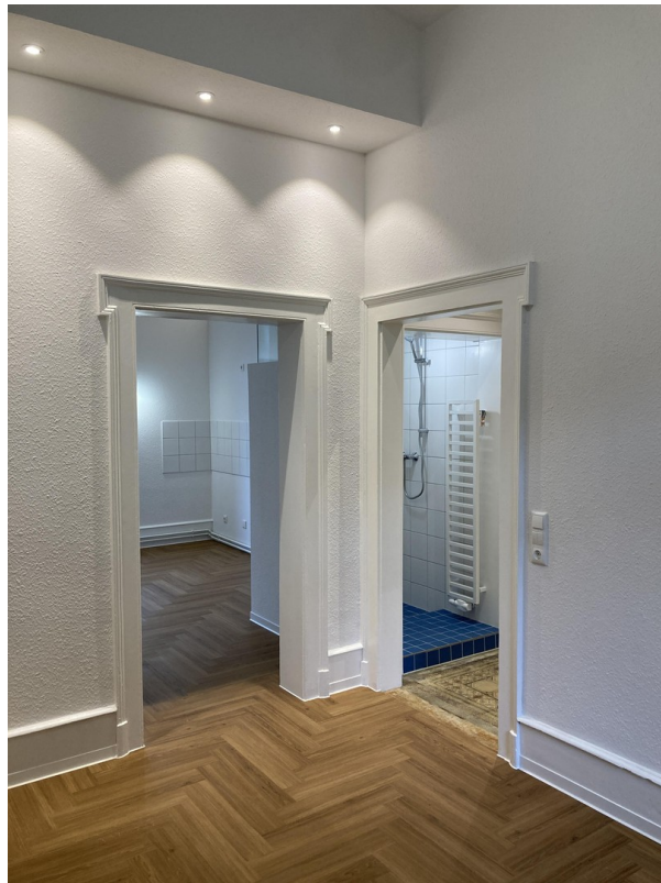
Schlafzimmer mit Flur & Küche