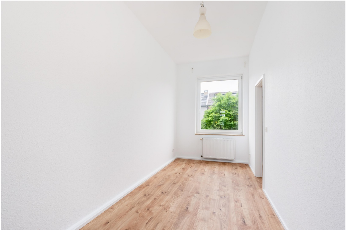
Arbeitszimmer / Kinderzimmer