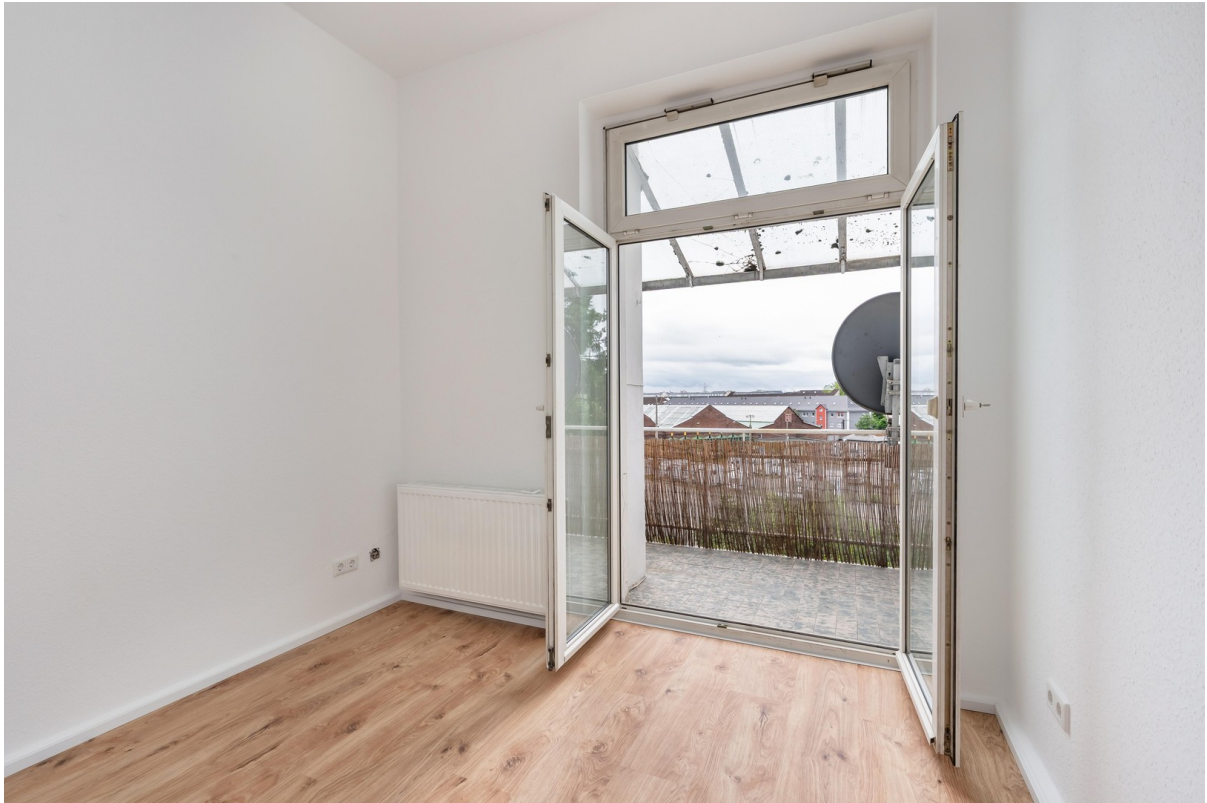
Blick zum Balkon