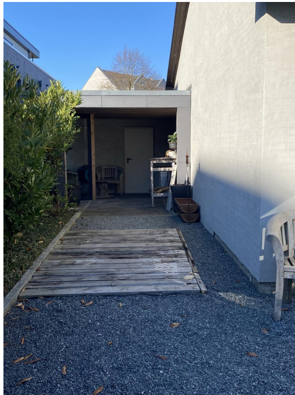
Überdachung zur Garage/Garten