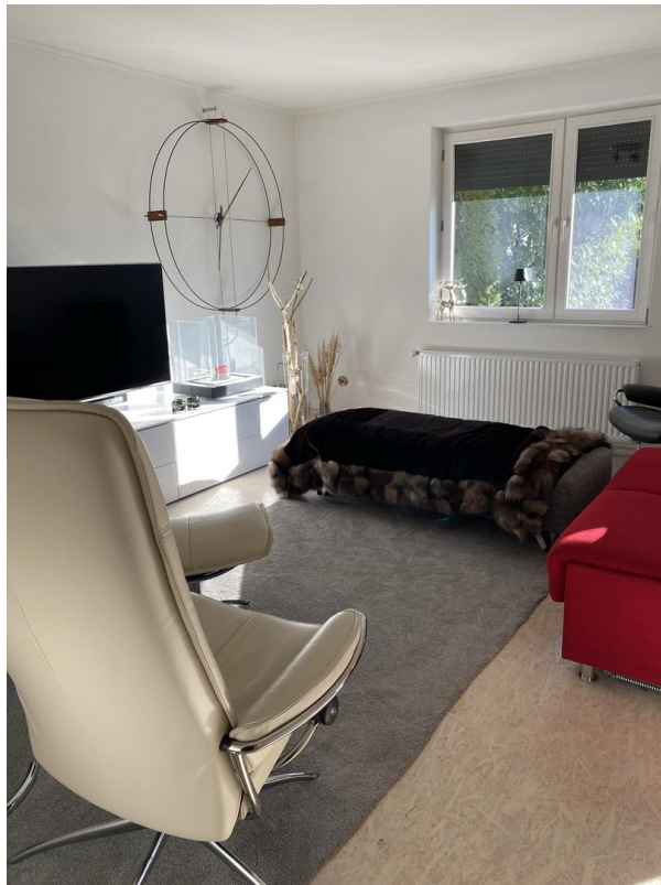
Wohn bzw. Eßzimmer