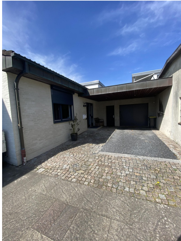
Eingang mit Carport