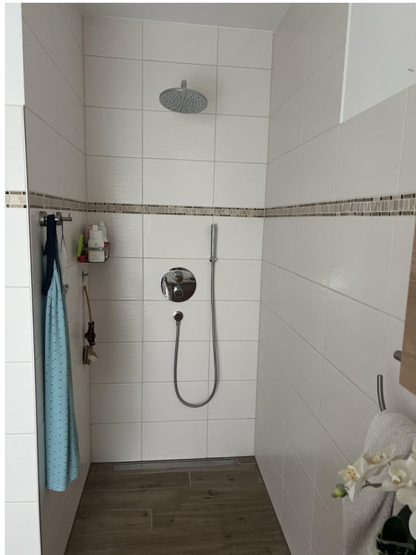
Dusche im Bad