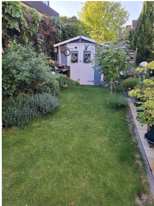
Garten mit Geräteschuppen