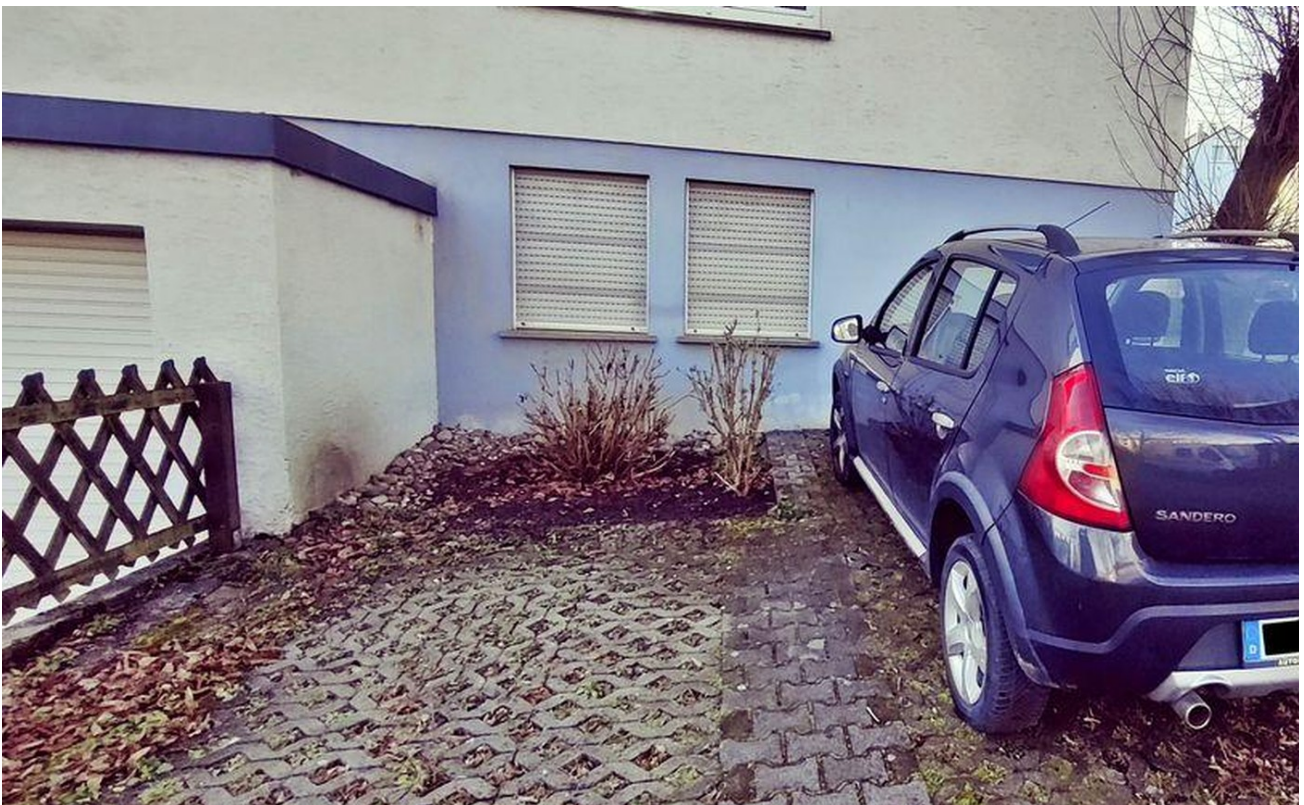
Stellplatz Bild 2