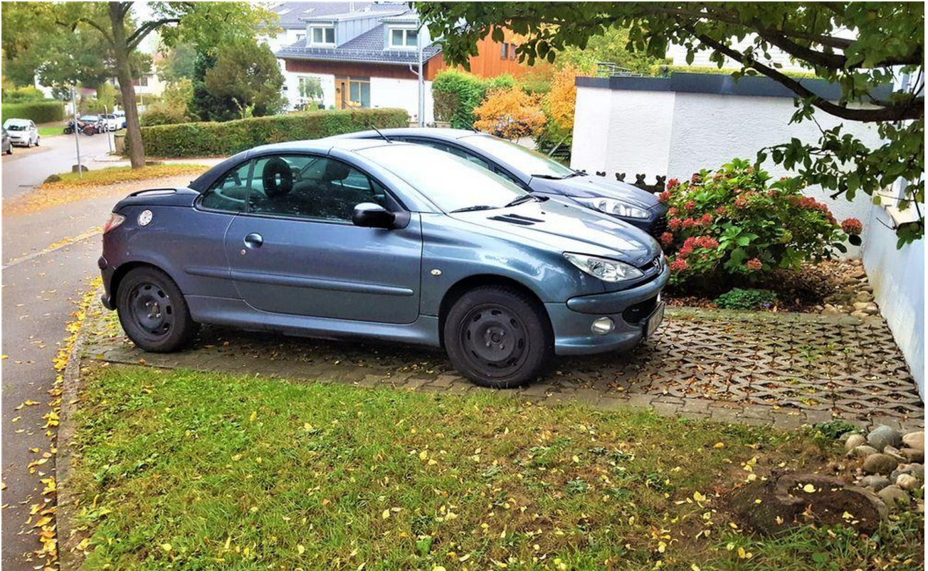
Stellplatz Bild 1