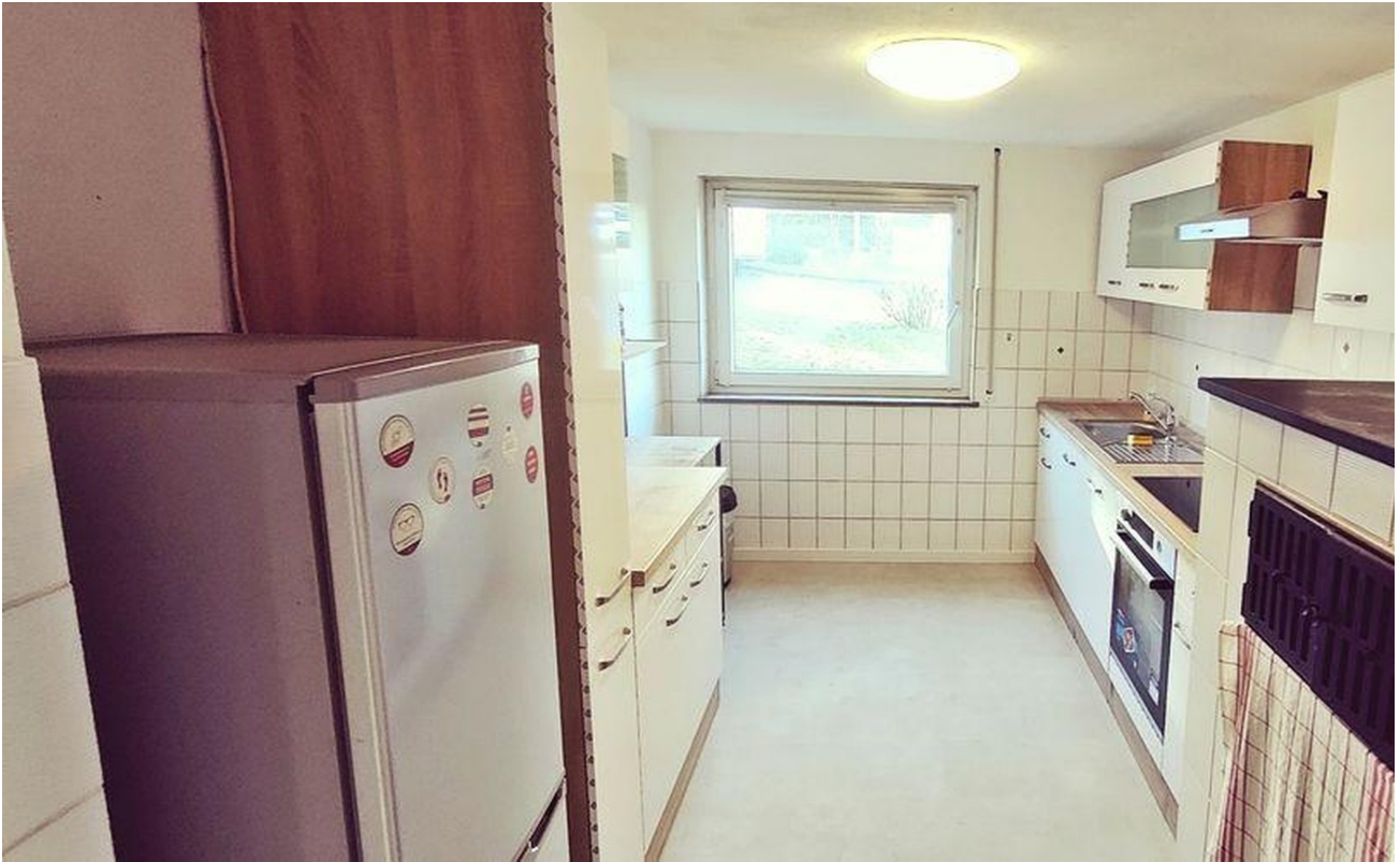
Küche Bild 1