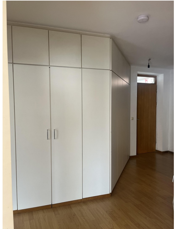
Einbauschränk als Lagerraum