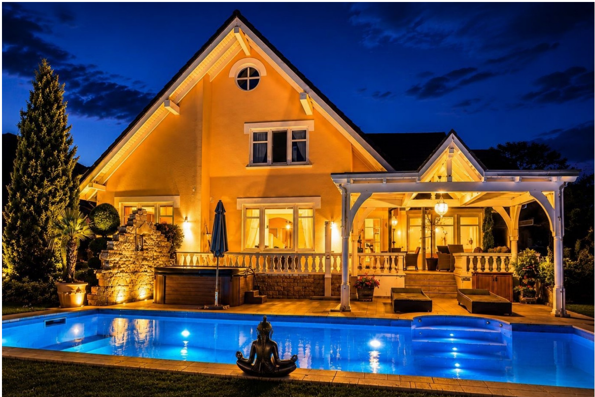
Rückansicht bei Nacht