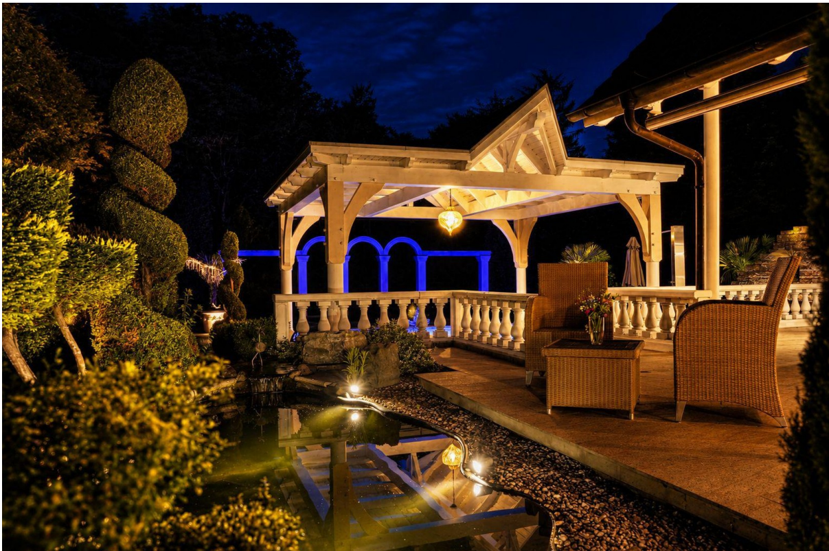
Teich bei Nacht