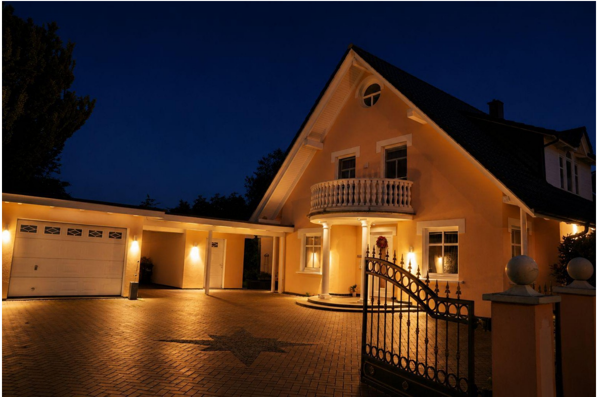
Einfahrt bei Nacht