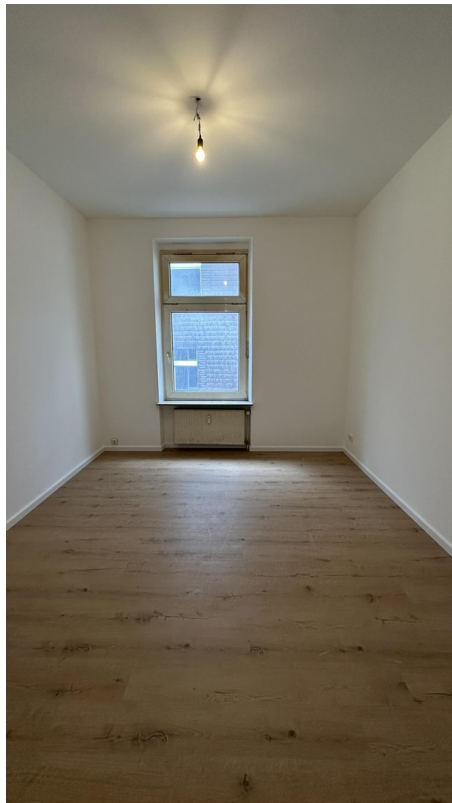
Zimmer 4 (Kind/Büro)