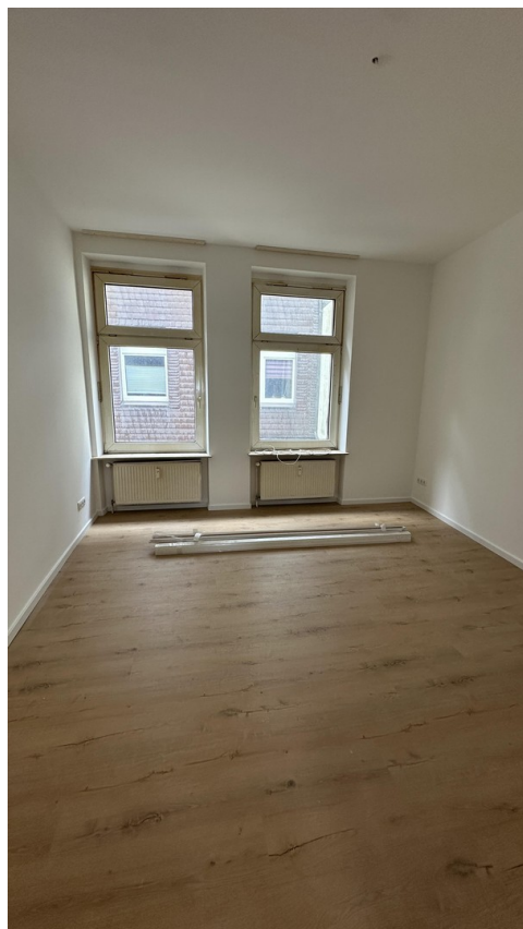
Zimmer 2 (Schlafzimmer)