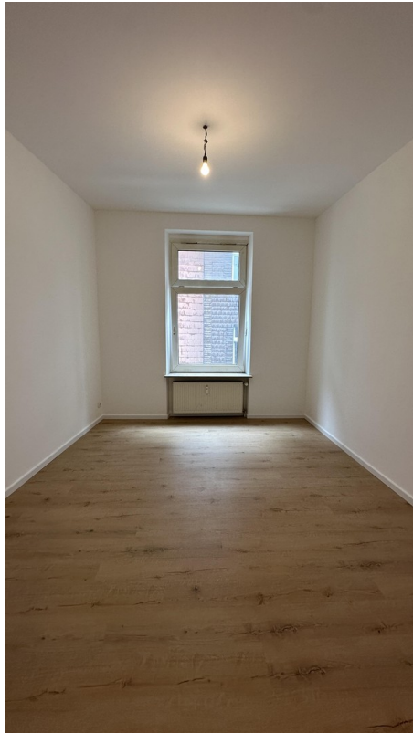
Zimmer 3 (Kind/Büro)