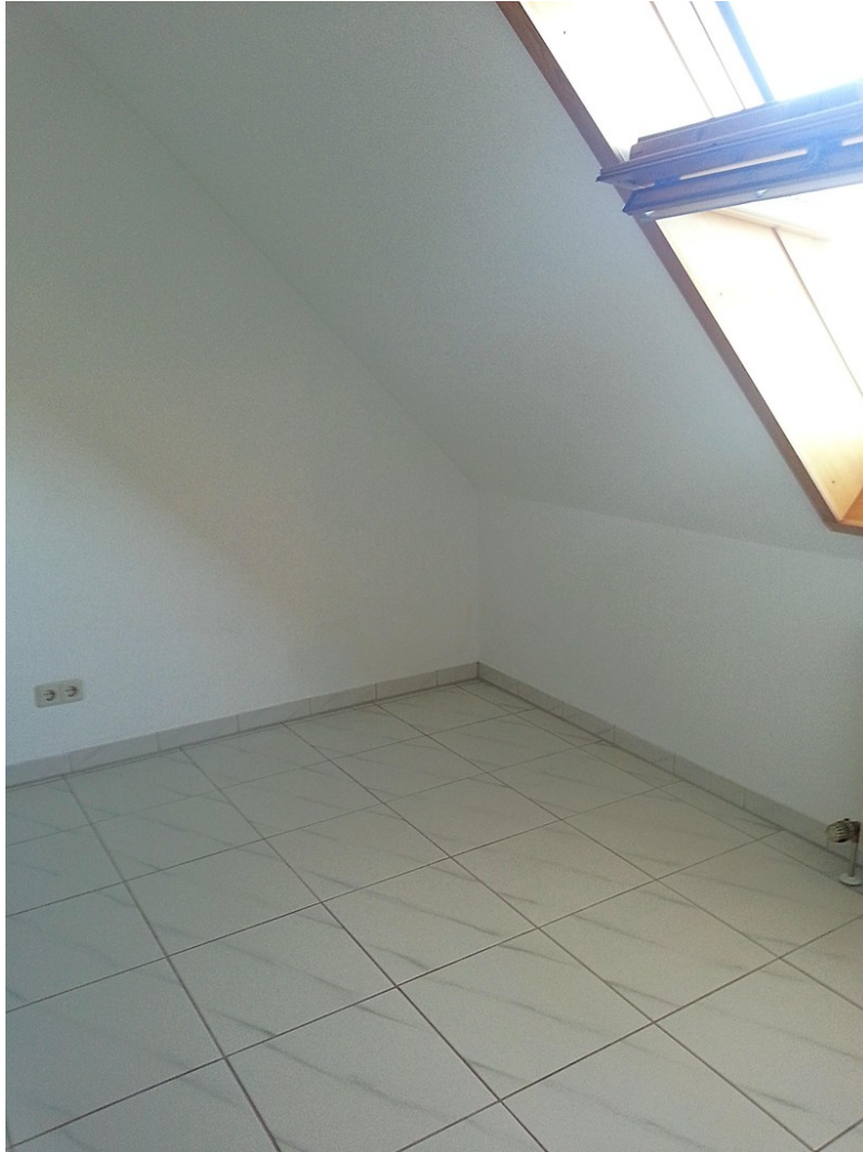
3. Zimmer, 2. Ebene