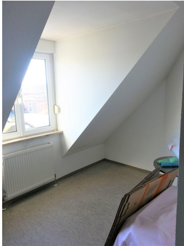
Separater Raum außerhalb Whg.