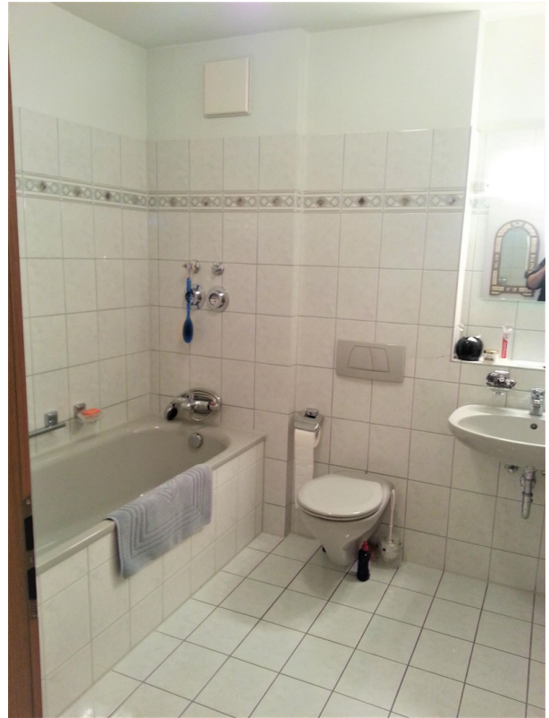
Bad, 2. Ebene