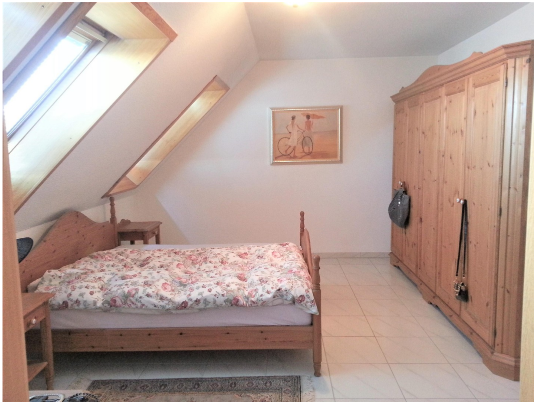
Schlafzimmer, 2. Ebene