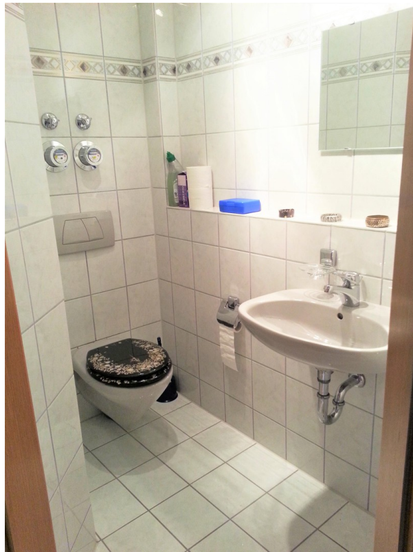
Gäste-WC, 1. Ebene