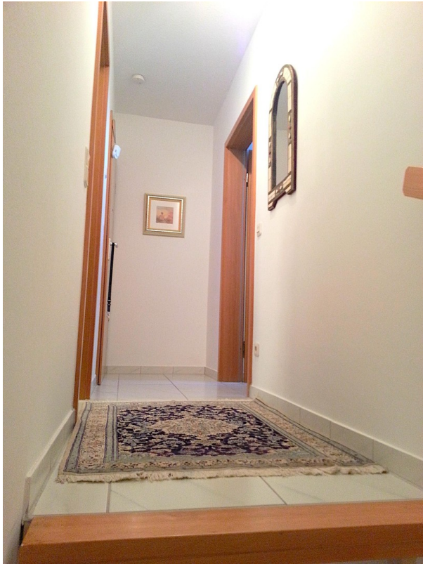
Gang 2. Ebene