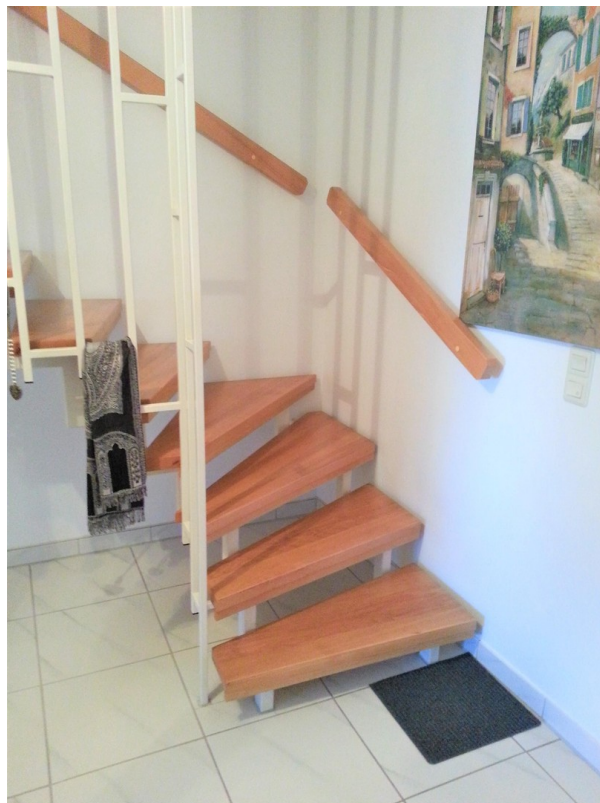
Treppe auf 2. Ebene