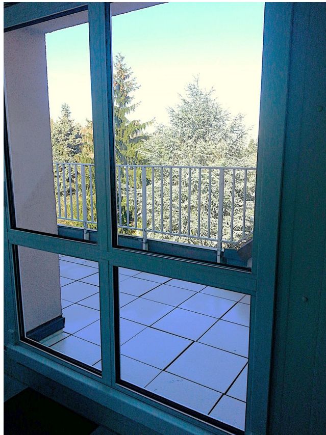
Blick Terrasse, Schiebetür