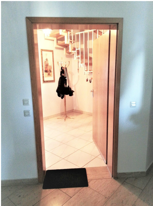
Eingang vom Treppenhaus