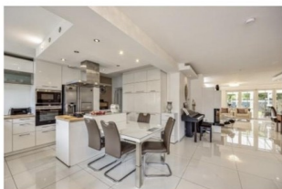
Essbereich mit Blick ins Wohnzimmer