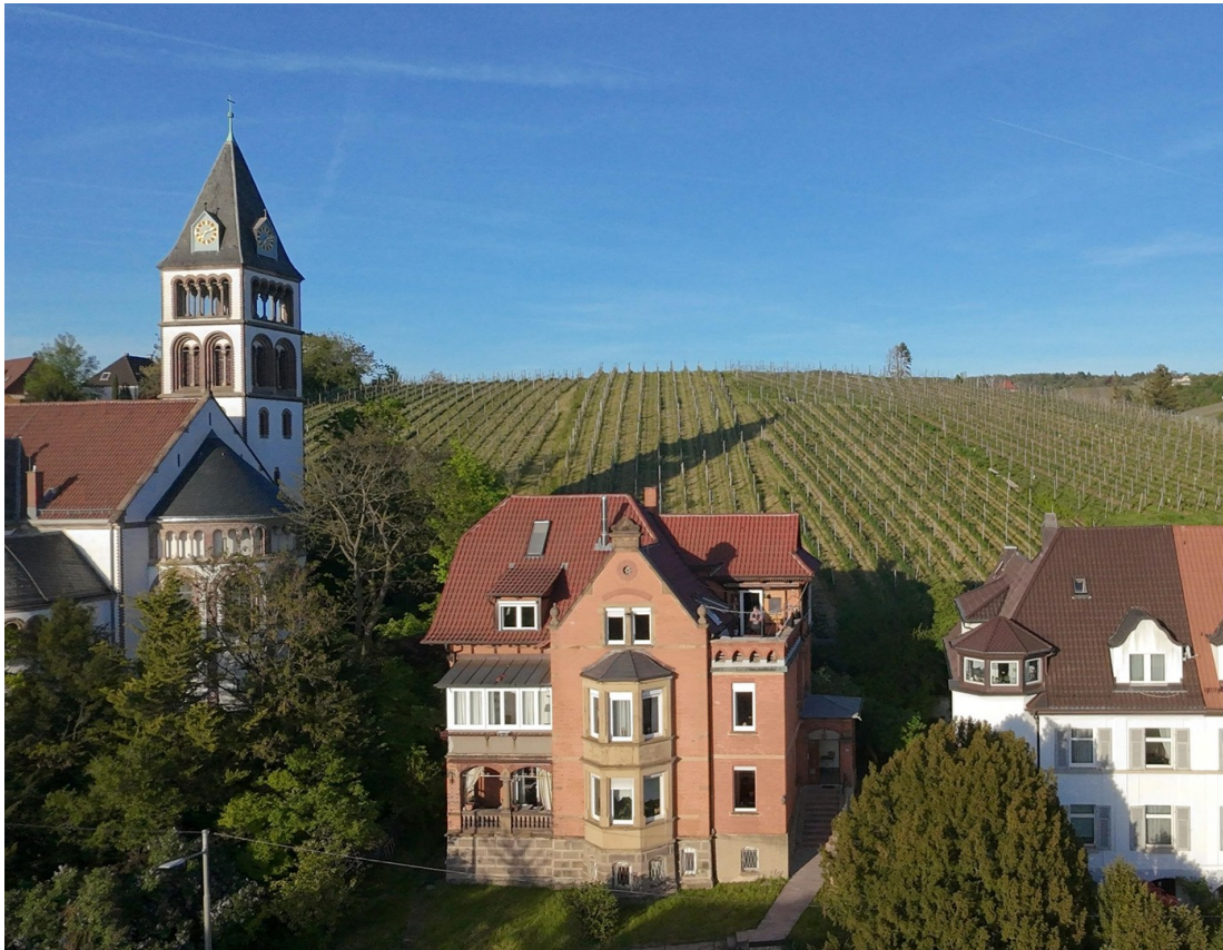
Villa am Wenberg