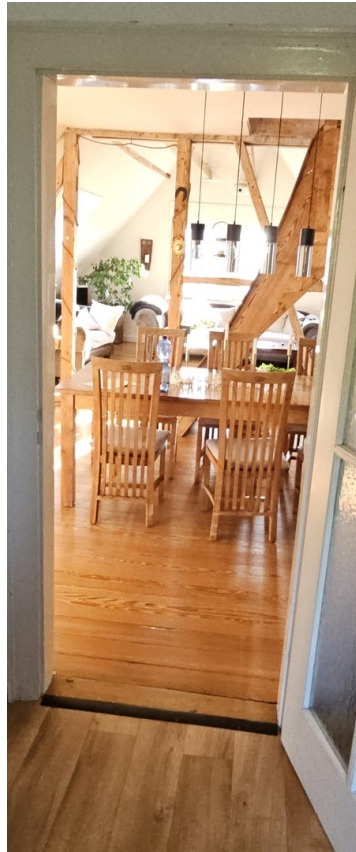
Blick aus Küche