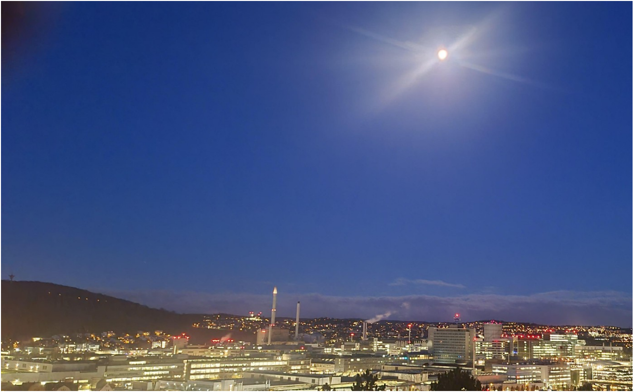
Blick aus dem Schlafzimmer