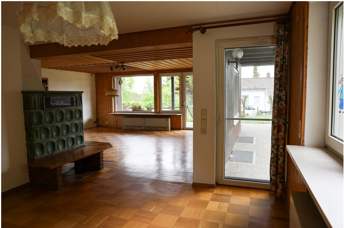
vom Esszimmer ins Wohnzimmer