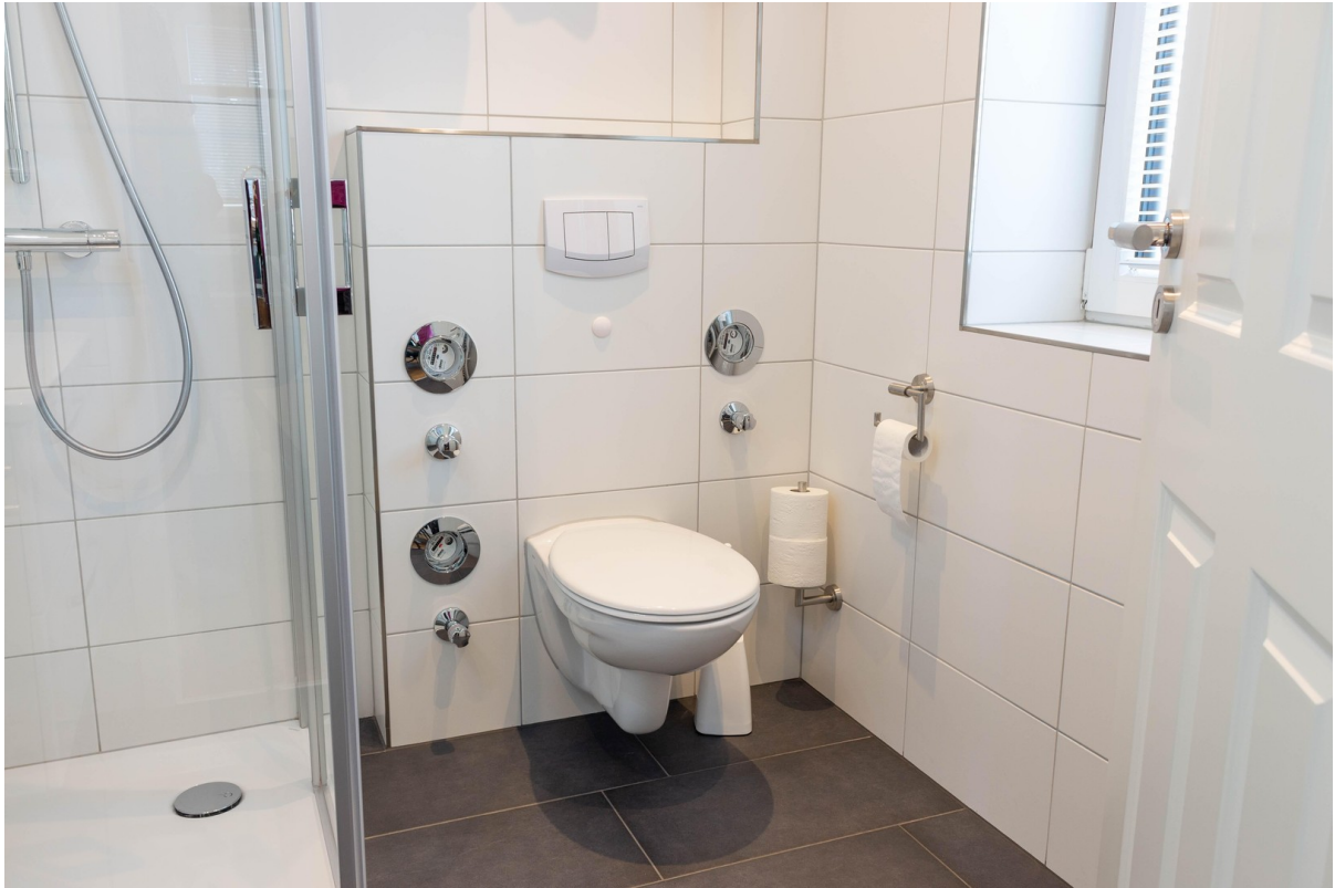
Bungalow Appartement Bad