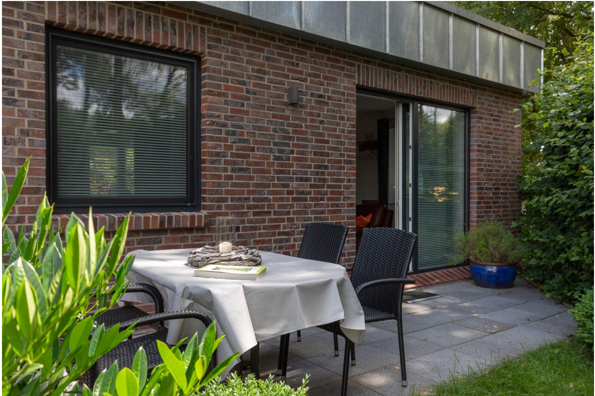
Bungalow Terrasse hinten