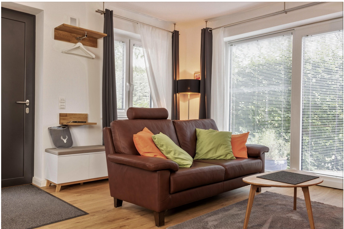
Bungalow Appartement Wohnen