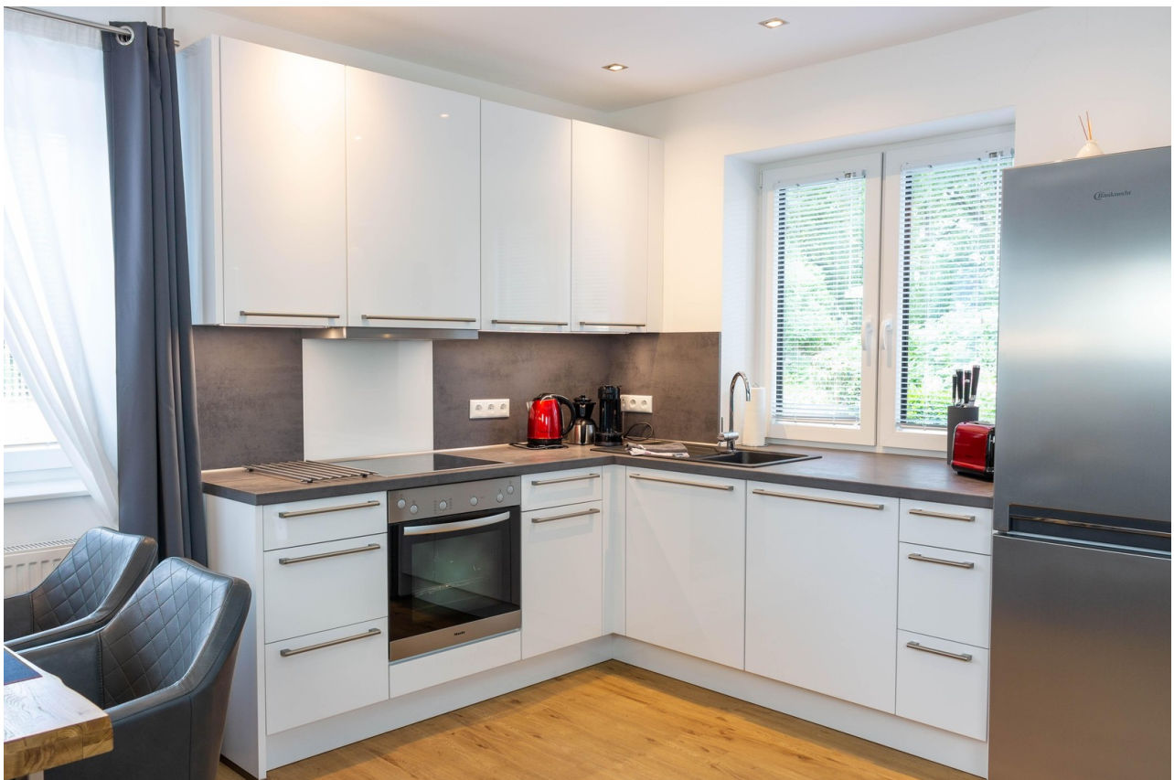
Bungalow Appartement Küche