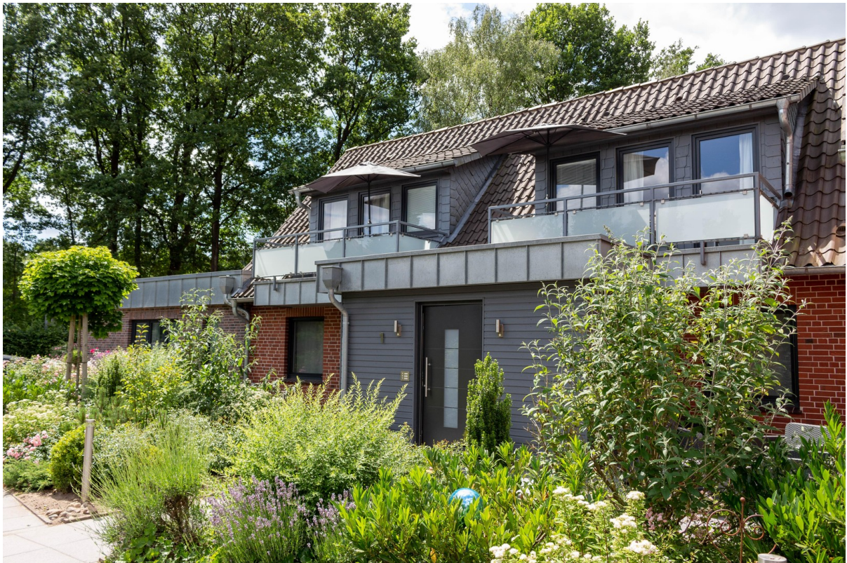
Hausansicht vorne Osten