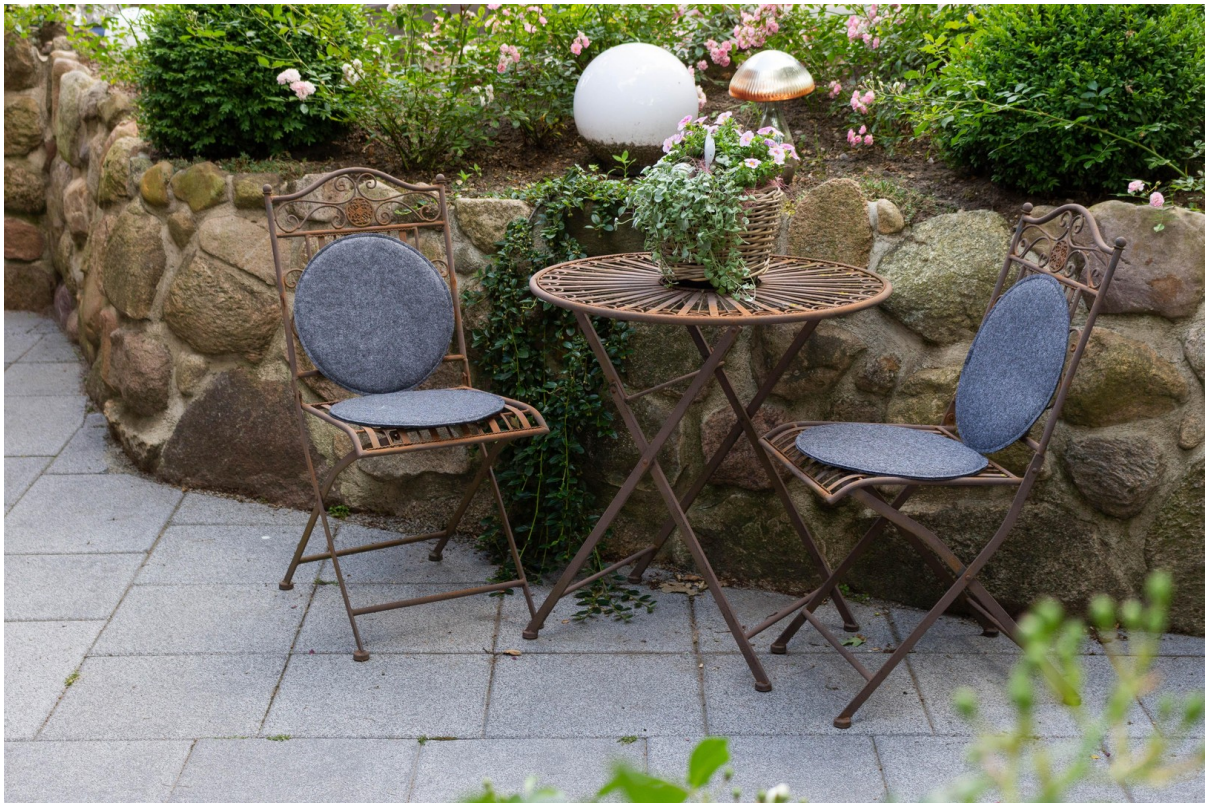
Bungalow Terrasse vorn