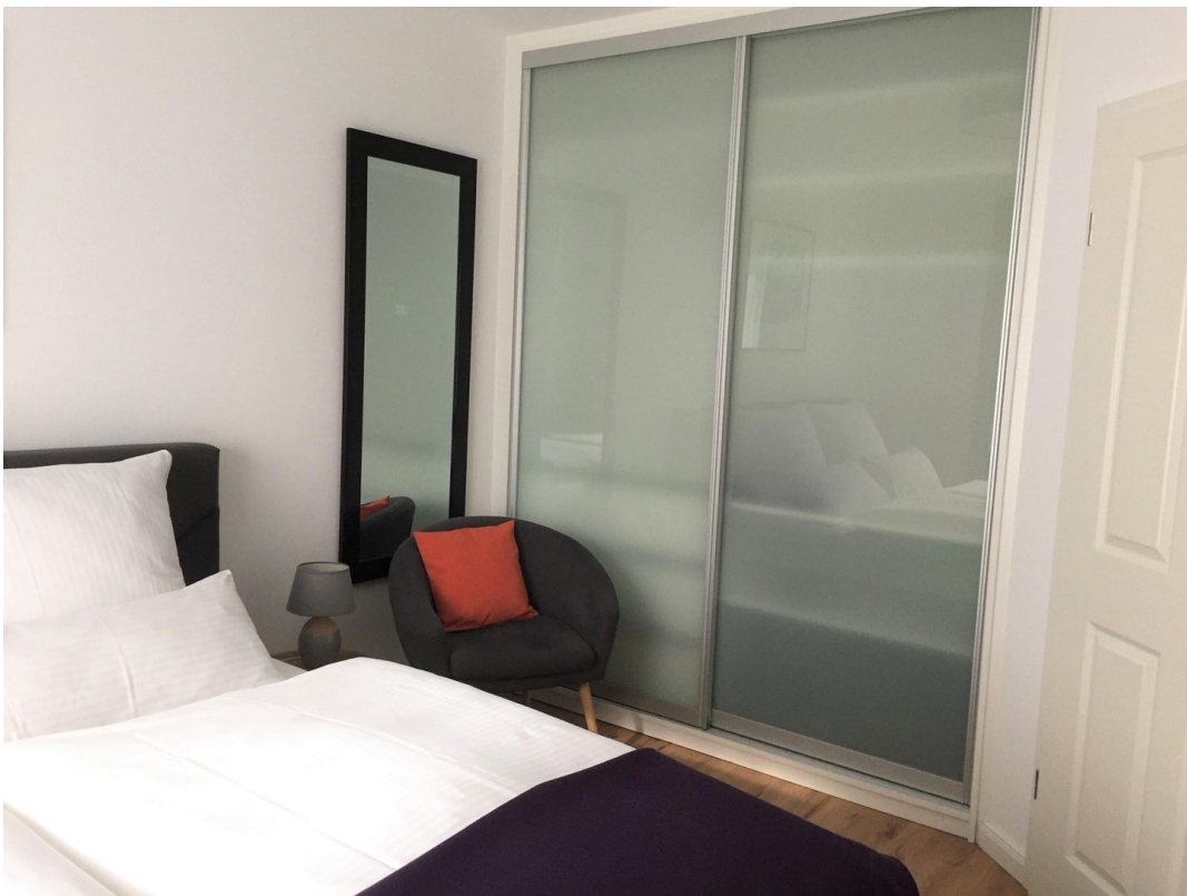
Bungalow Appartement Schlafen