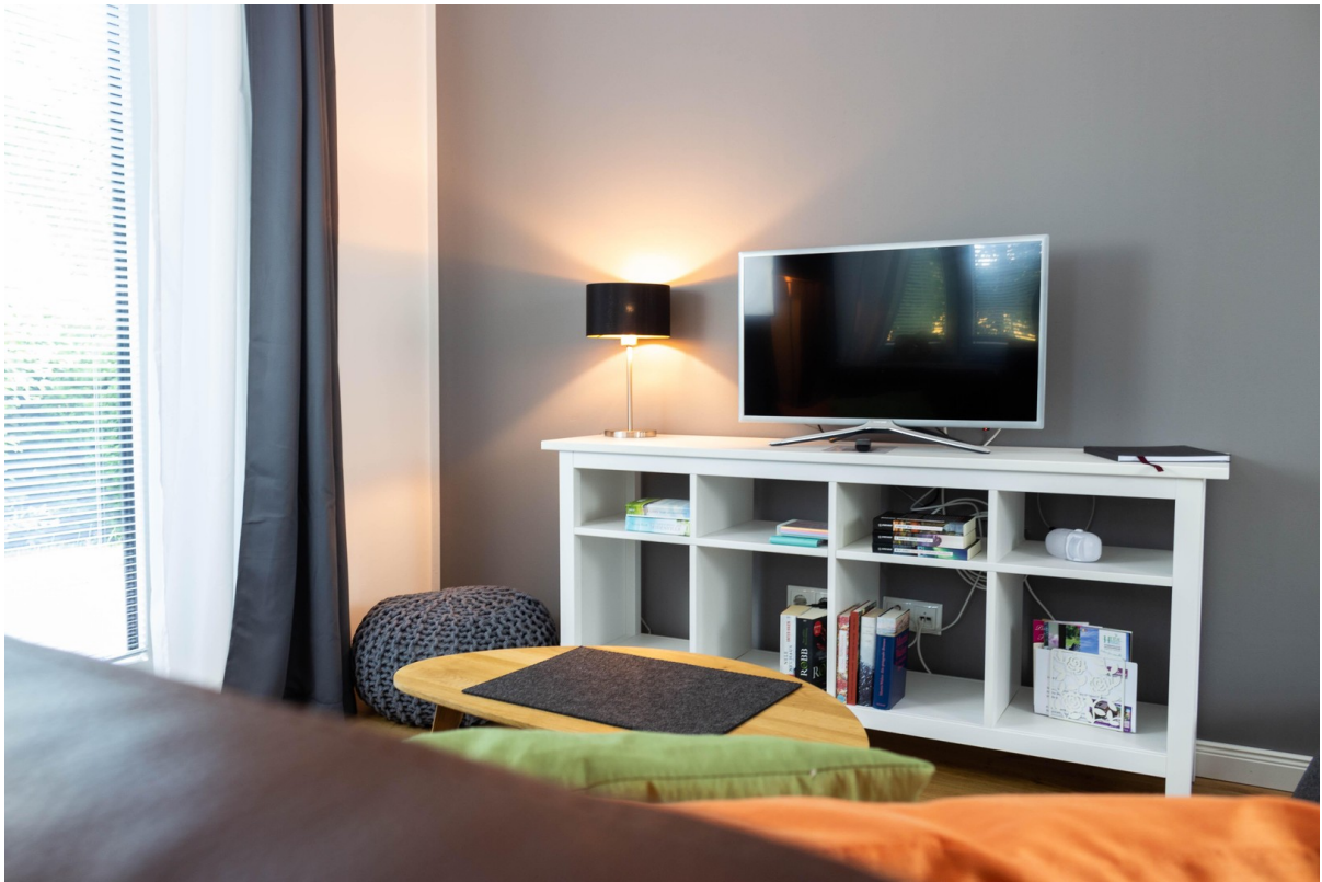
Bungalow Appartement Wohnen