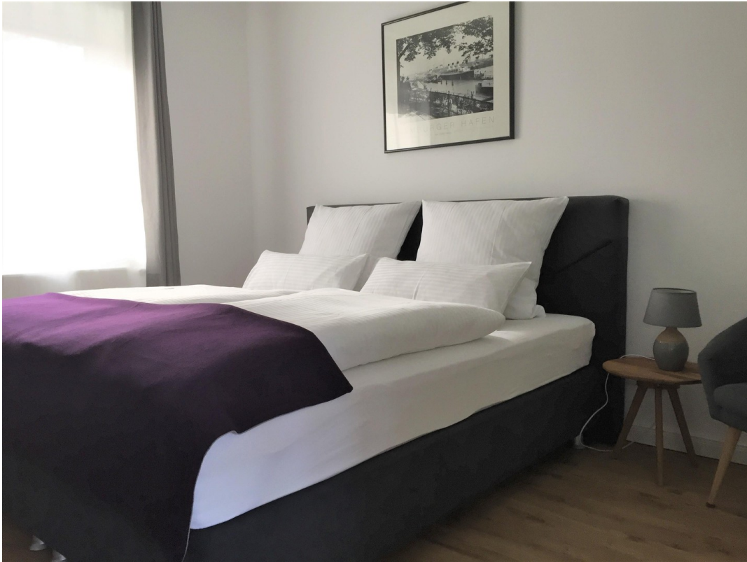
Bungalow Appartement Schlafen