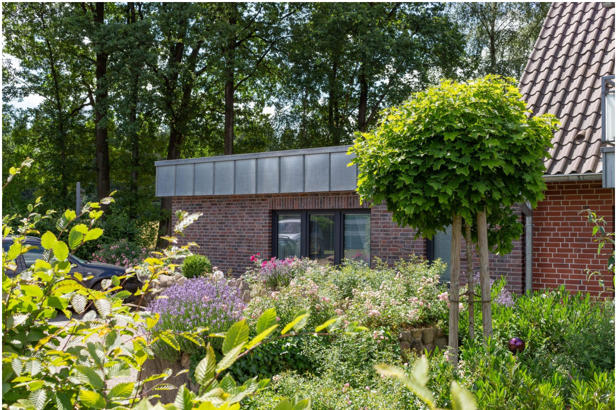
Bungalow Appartement vorne