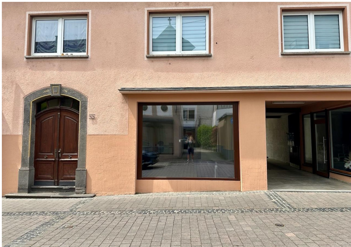
moderne doppelverglaste Front