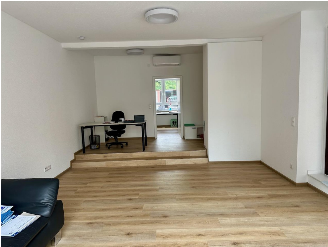
Hauptraum mit Podest