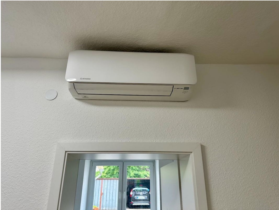
Klimagerät mit Heizung