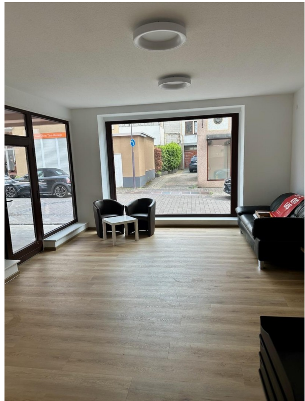
Hauptraum mit Straßenblick