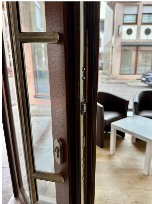
modern gesicherte Eingangstür