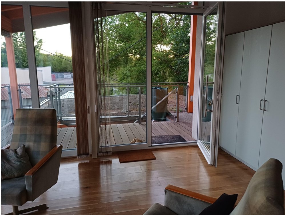
Blick nach draußen