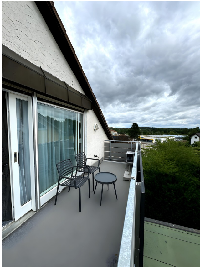
Balkon mit Balkonkraftwerk