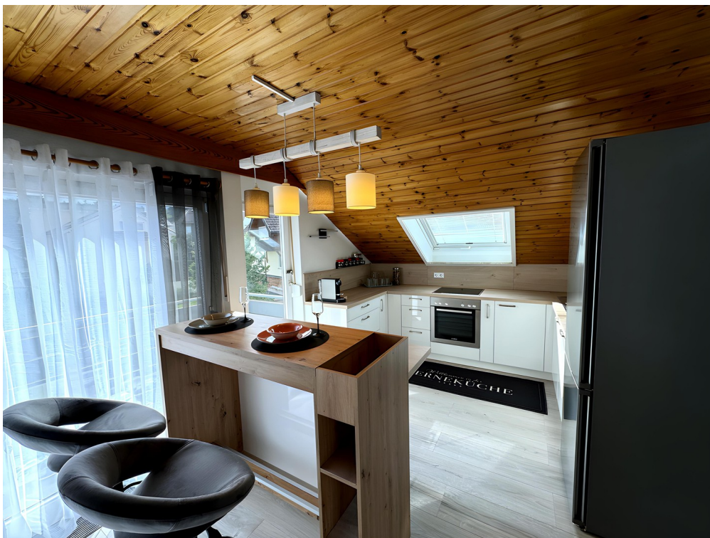
Offene Küche mit Bar