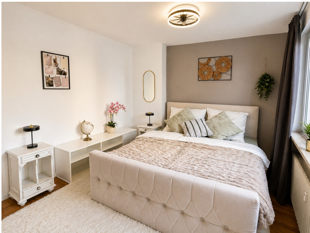
Schlafzimmer Bild 2