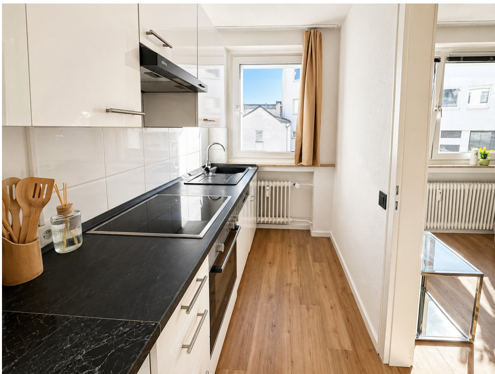
Küche Bild 1