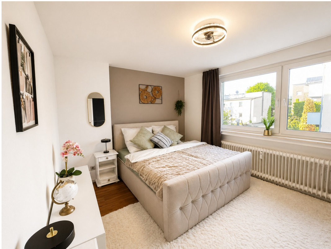
Schlafzimmer Bild 1