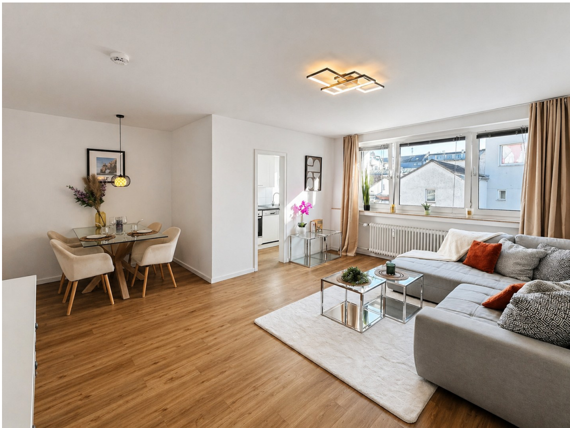
Wohnzimmer Bild 1