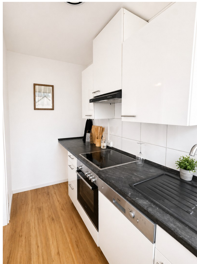
Küche Bild 3