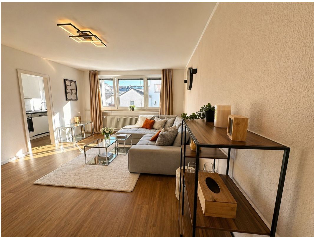
Wohnzimmer Bild 3