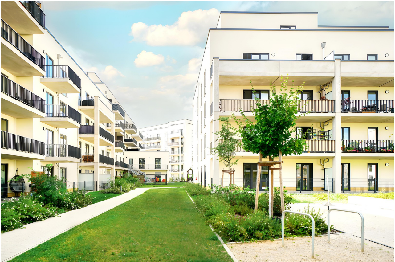
Areal Halske Gärten 2