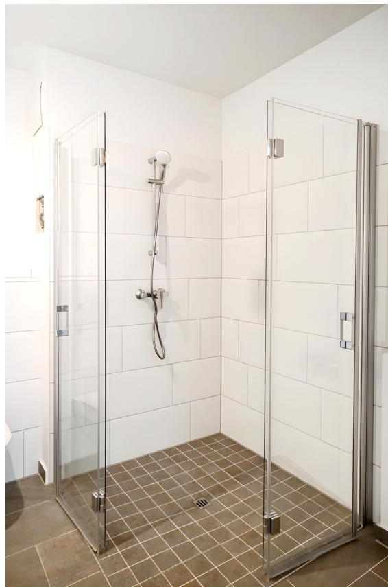
Beispielansicht Badezimmer 1