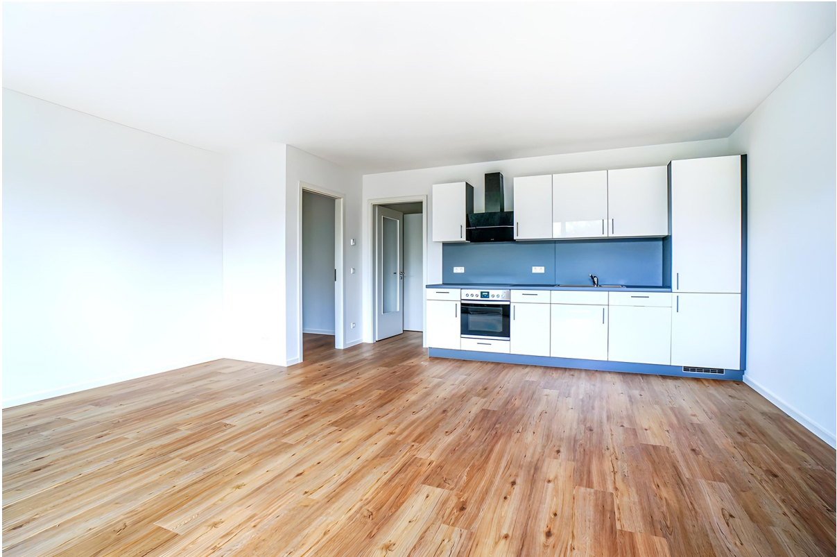
Beispielansicht Wohnbereich 1