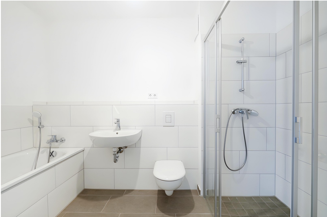
Beispielansicht Badezimmer 2