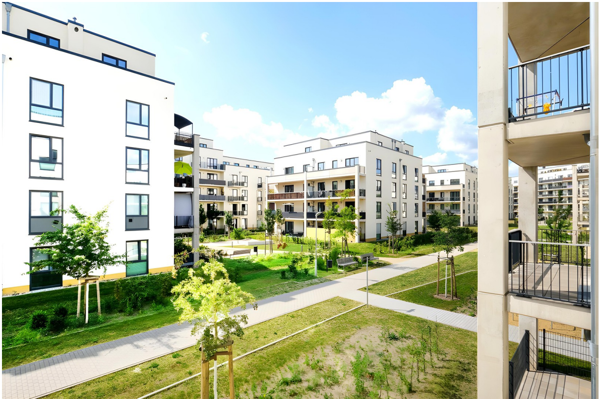
Areal Halske Gärten 3