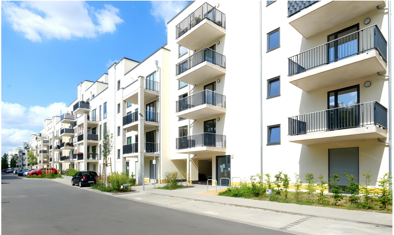
Areal Halske Gärten