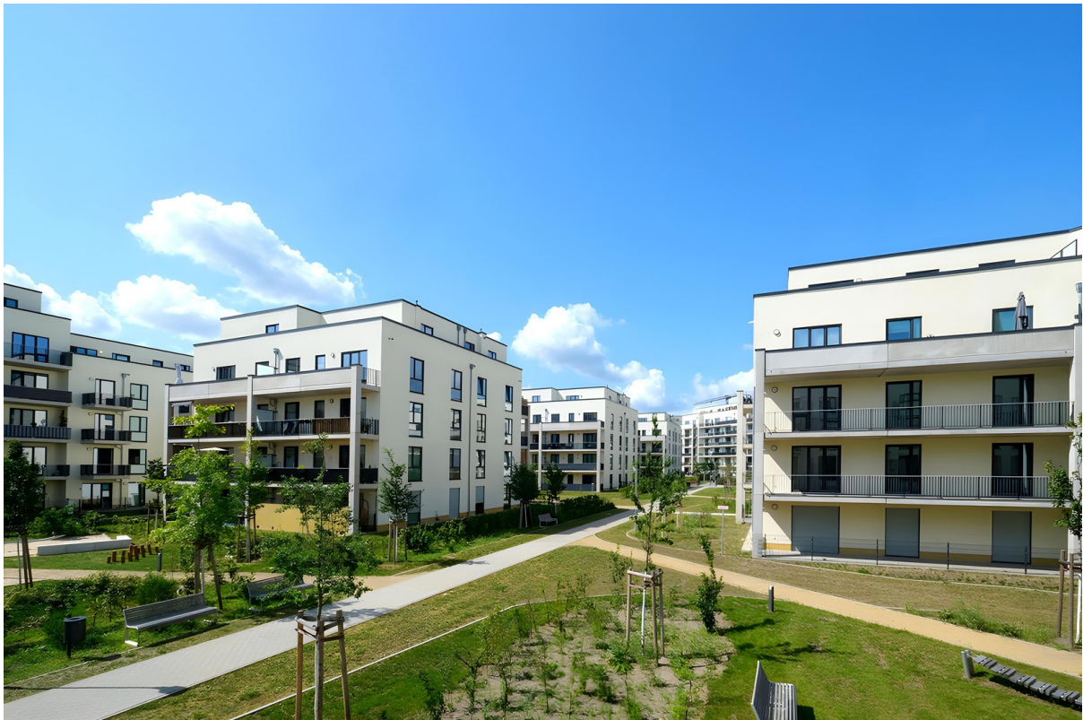
Areal Halske Gärten 4