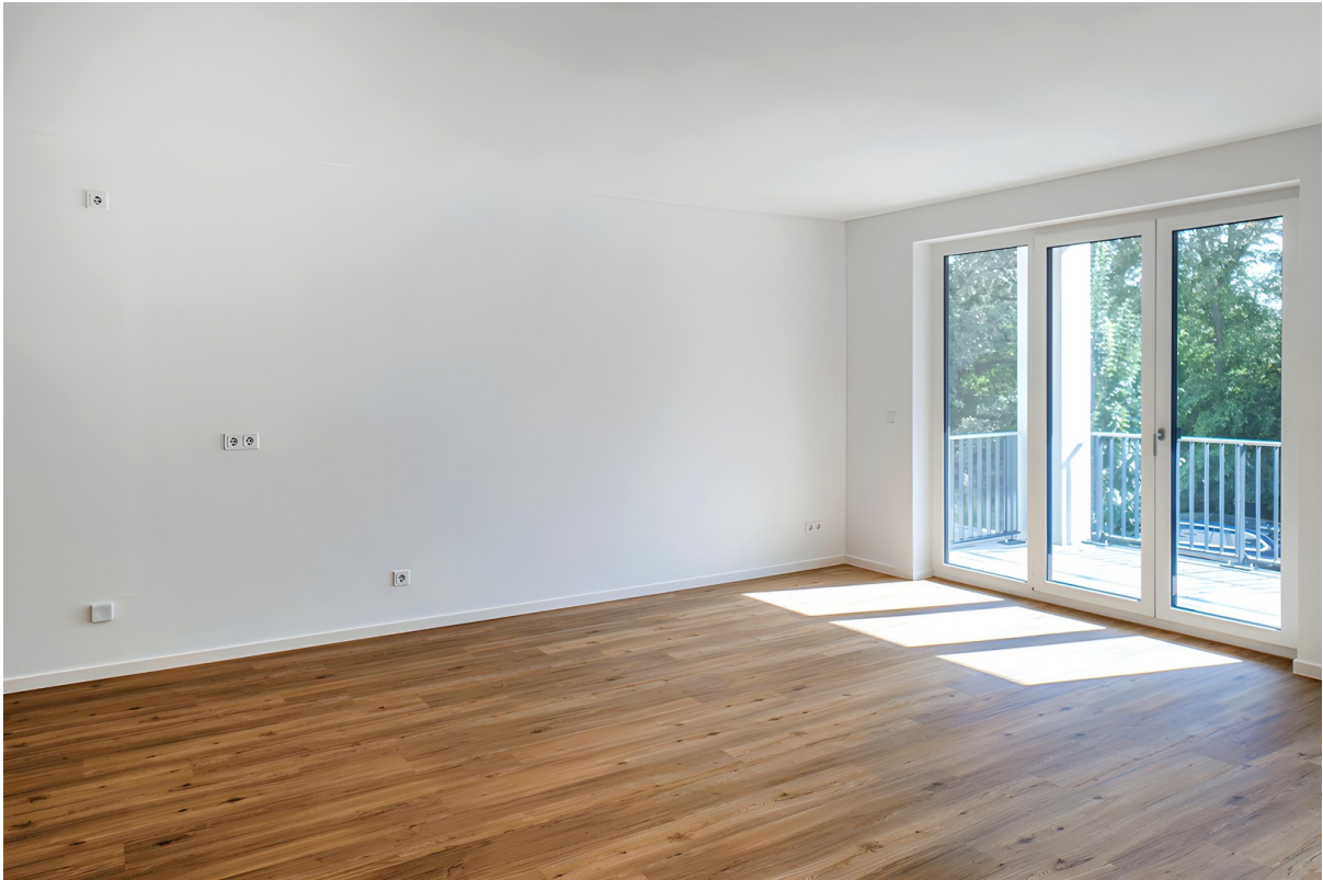
Beispielansicht Zimmer 1