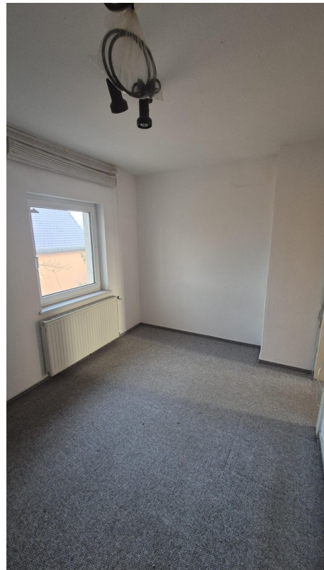
1. Zimmer OG