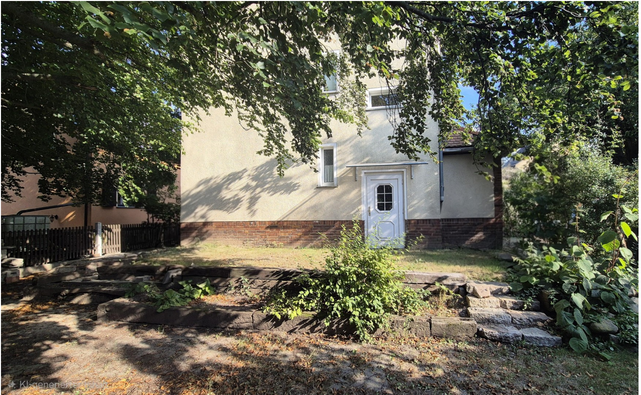
hintere Ansicht Haus