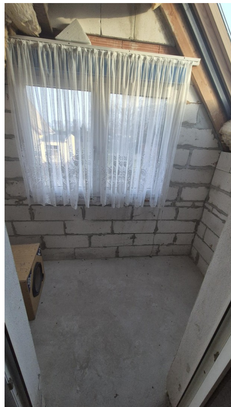
Loggia 3. Zimmer OG