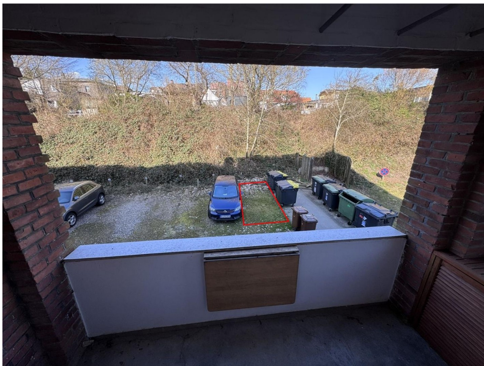
Balkon inkl. Stellplatz