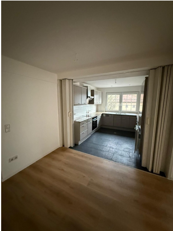
Küche / Essen